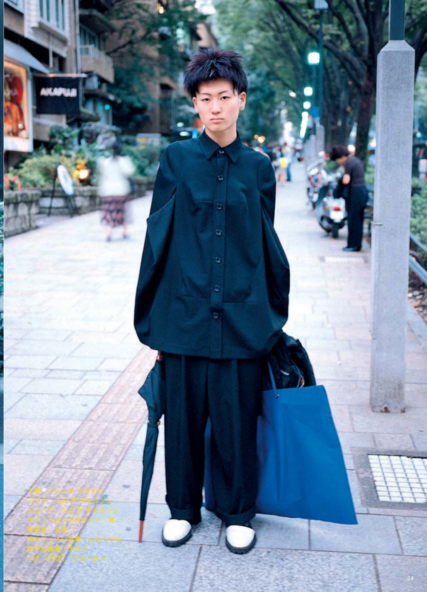
上着：ジュンヤ ワタナベ パンツ：コム デ ギャルソン シューズ：コム デ ギャルソン ファッションのポイント：黒 美容室：友達 今ハマっている事：しむらけん 好きな音楽：テクノ ハチ（19才）、フリーター