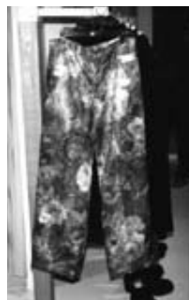
パンツ (Sah) ¥22,000