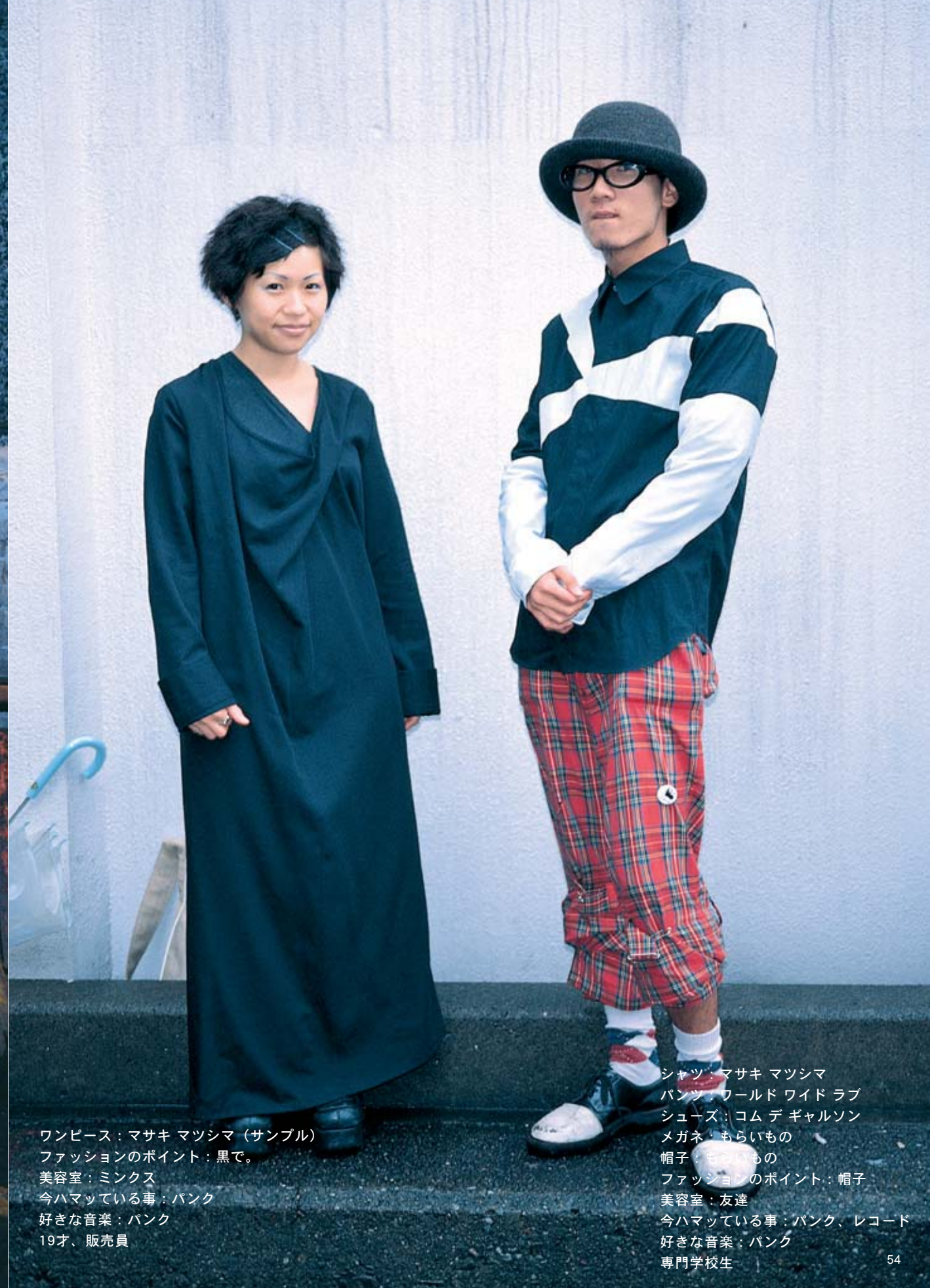
シャツ：マサキ マツシマ パンツ：ワールド ワイド ラブ シューズ：コム デ ギャルソン メガネ：もらいもの 帽子：もらいもの ファッションのポイント：帽子 美容室：友達 今ハマっている事：パンク、レコード 好きな音楽：パンク 専門学校生