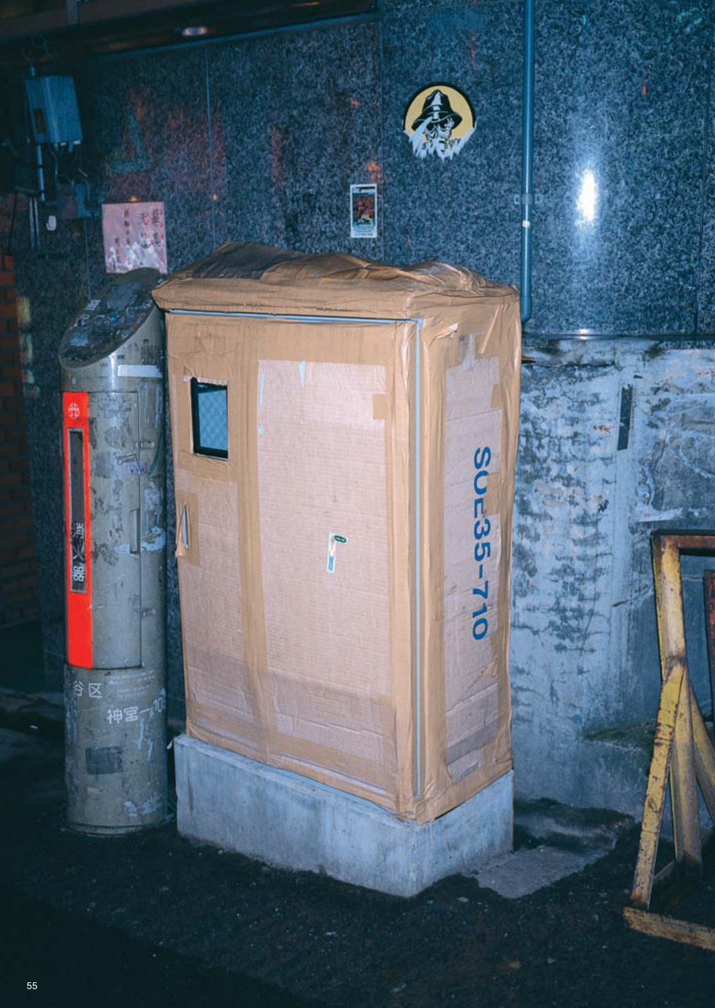
ワンピース：マサキ マツシマ（サンプル） ファッションのポイント：黒で。 美容室：ミンクス 今ハマっている事：パンク 好きな音楽：パンク 19才、販売員