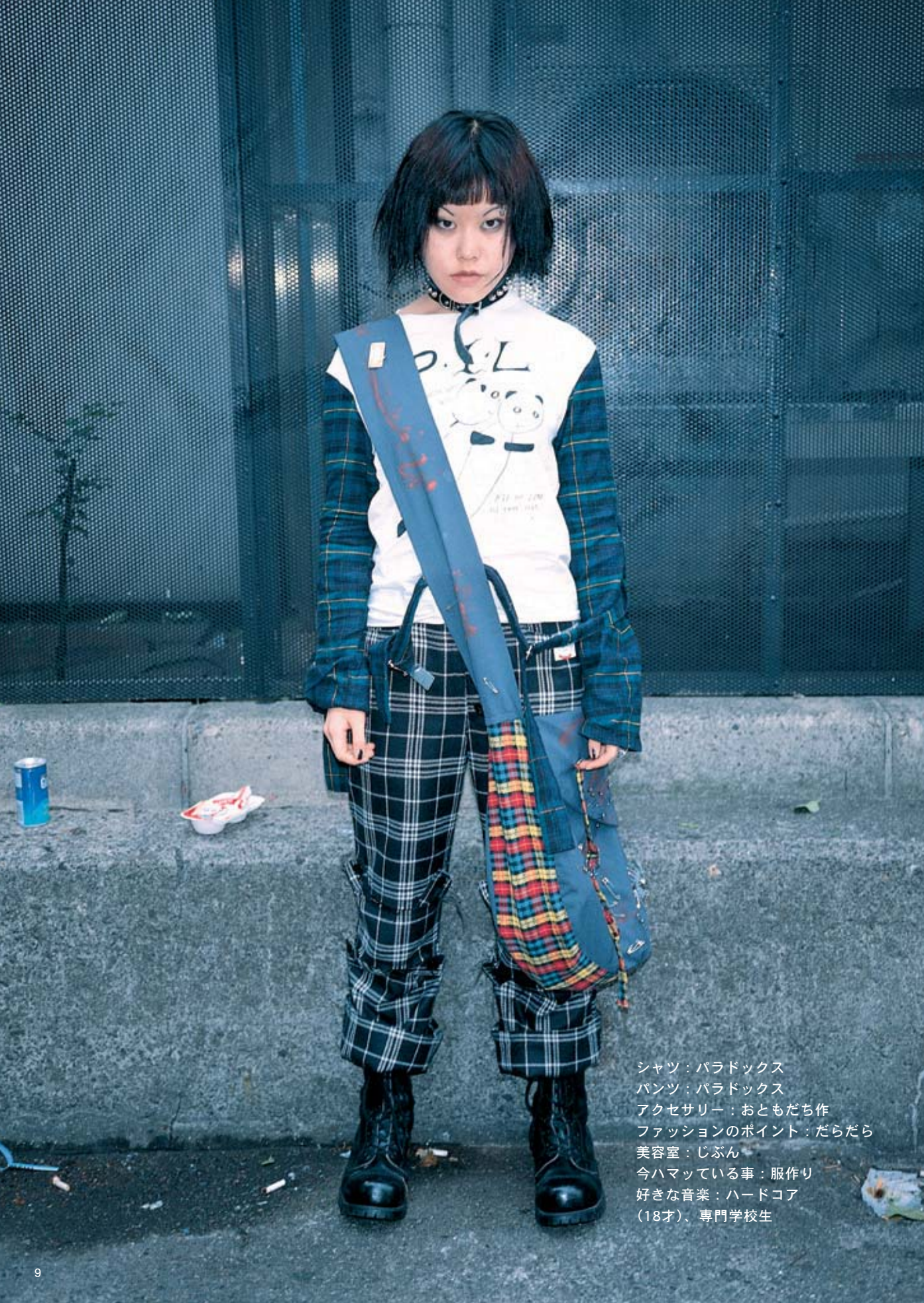
シャツ：パラドックス パンツ：パラドックス アクセサリー：おともだち作 ファッションのポイント：だらだら 美容室：じぶん 今ハマっている事：服作り 好きな音楽：ハードコア (18才)、専門学校生