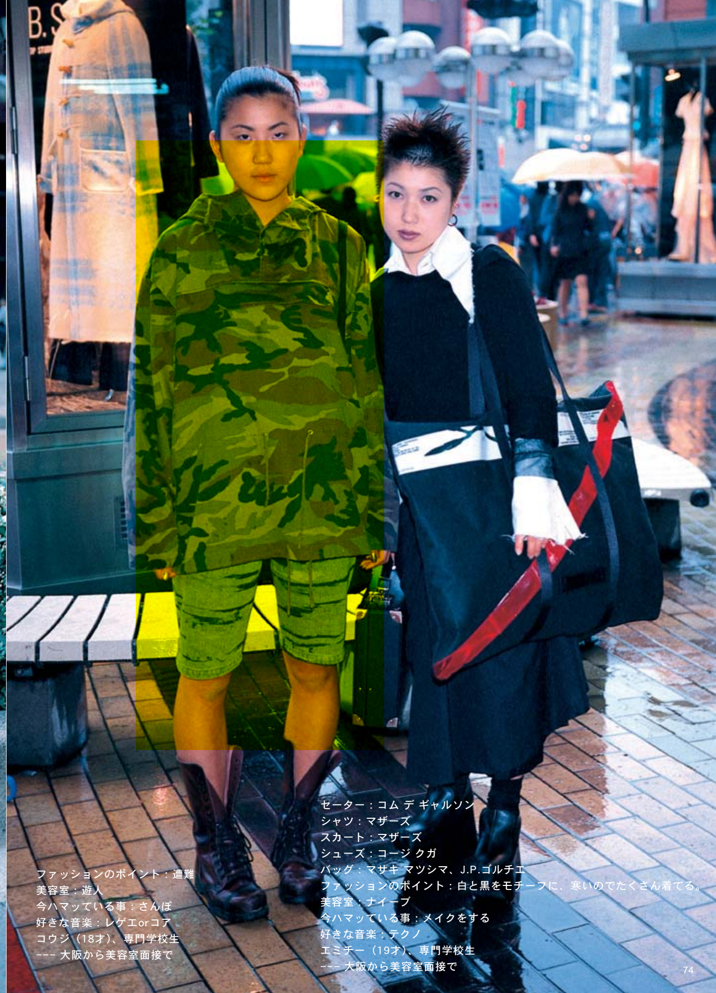
ファッションのポイント：遭難 美容室：遊人 今ハマっている事：さんぽ 好きな音楽：レゲエorコア コウジ（18才）、専門学校生 --- 大阪から美容室面接で