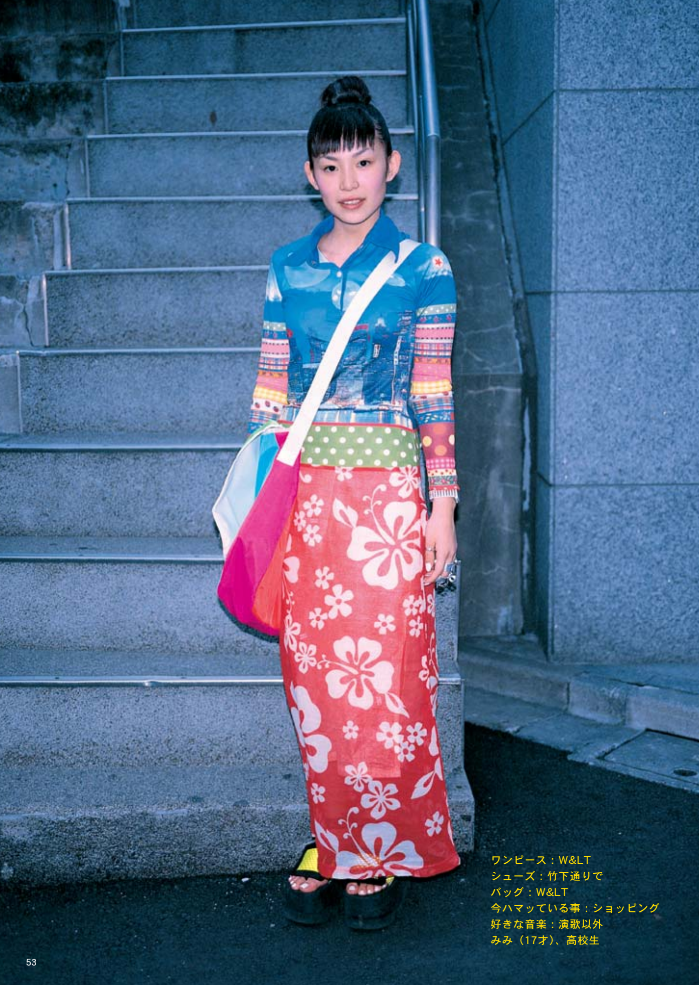
ワンピース：W&LT シューズ：竹下通りで バッグ：W&LT 今ハマっている事：ショッピング 好きな音楽：演歌以外 みみ（17才）、高校生