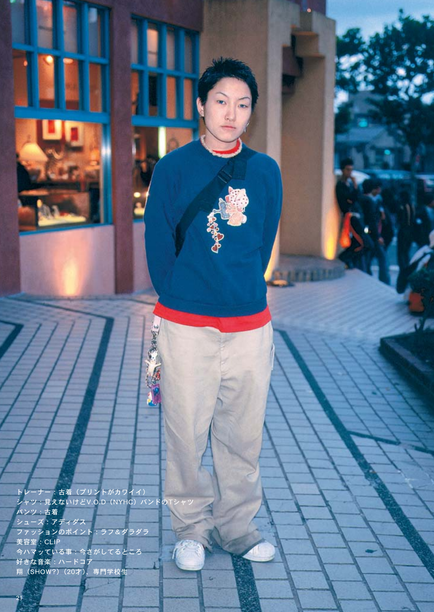
トレーナー：古着（プリントがカワイイ） シャツ：見えないけどV.O.D（NYHC）バンドのTシャツ パンツ：古着 シューズ：アディダス ファッションのポイント：ラフ&ダラダラ 美容室：CLIP 今ハマっている事：今さがしてる場所 好きな音楽：ハードコア 翔（SHOW?）（20才）、専門学校生