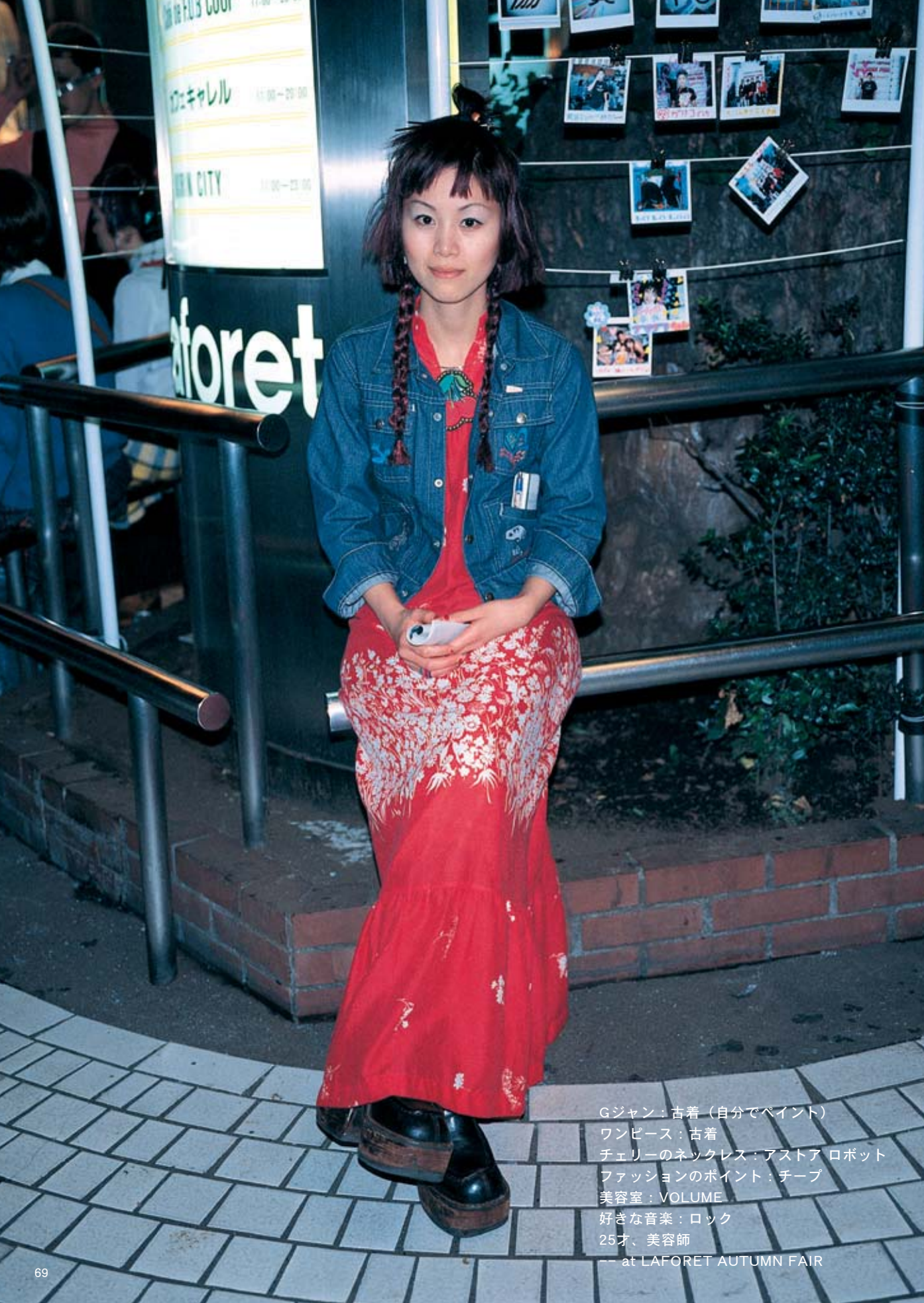
Gジャン：古着（自分でペイント） ワンピース：古着 チェリーのネックレス：アストア ロボット ファッションのポイント：チープ 美容室：VOLUME 好きな音楽：ロック 25才、美容師 --- at LAFORET AUTUMN FAIR