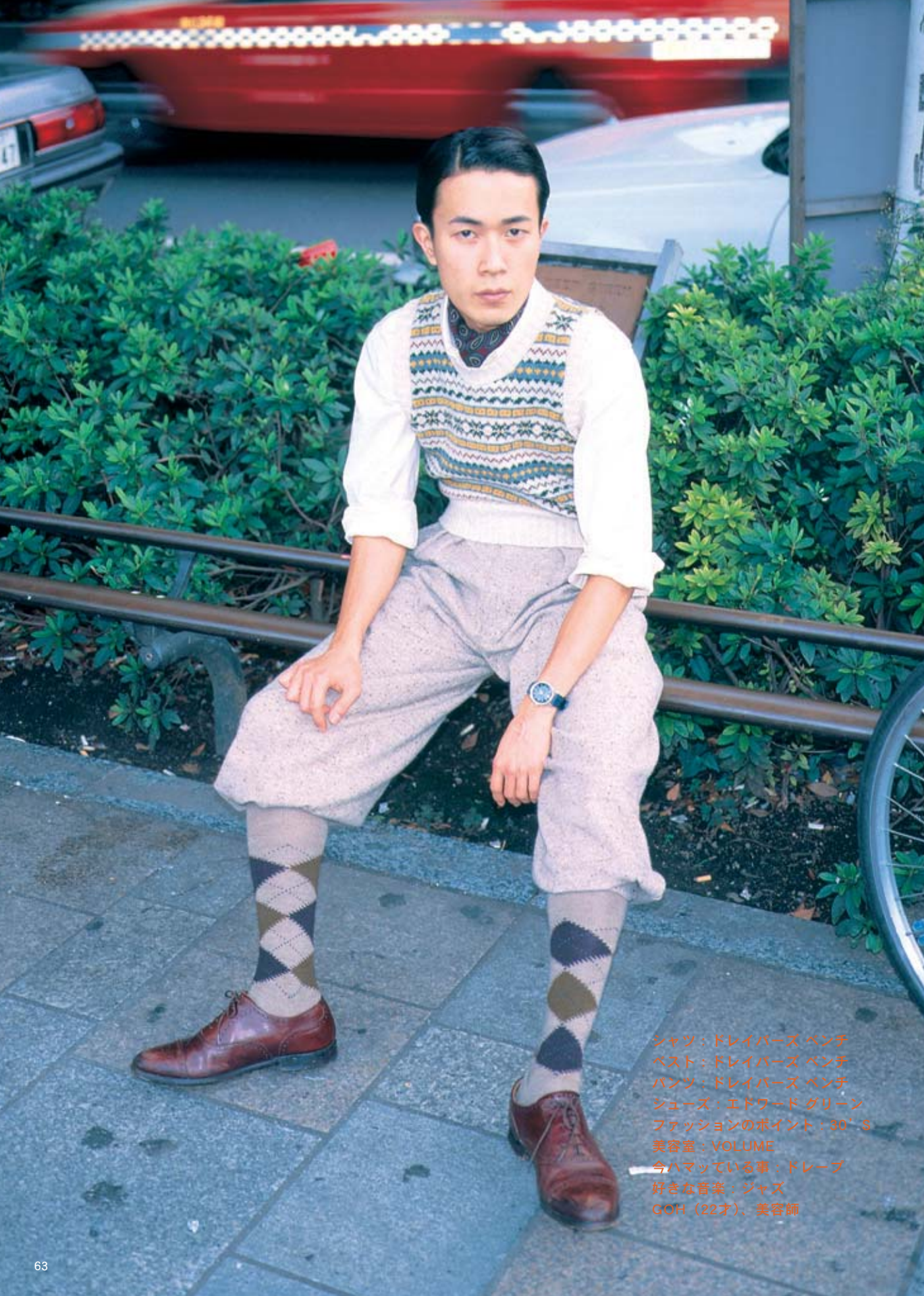
シャツ：ドレイパーズ ベンチ ベスト：ドレイパーズ ベンチ パンツ：ドレイパーズ ベンチ シューズ：エドワード グリーン ファッションのポイント：30'S 美容室：VOLUME 今ハマっている事：ドレープ 好きな音楽：ジャズ GOH (22才)、美容師