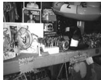
コン虫入キャンディ ¥380