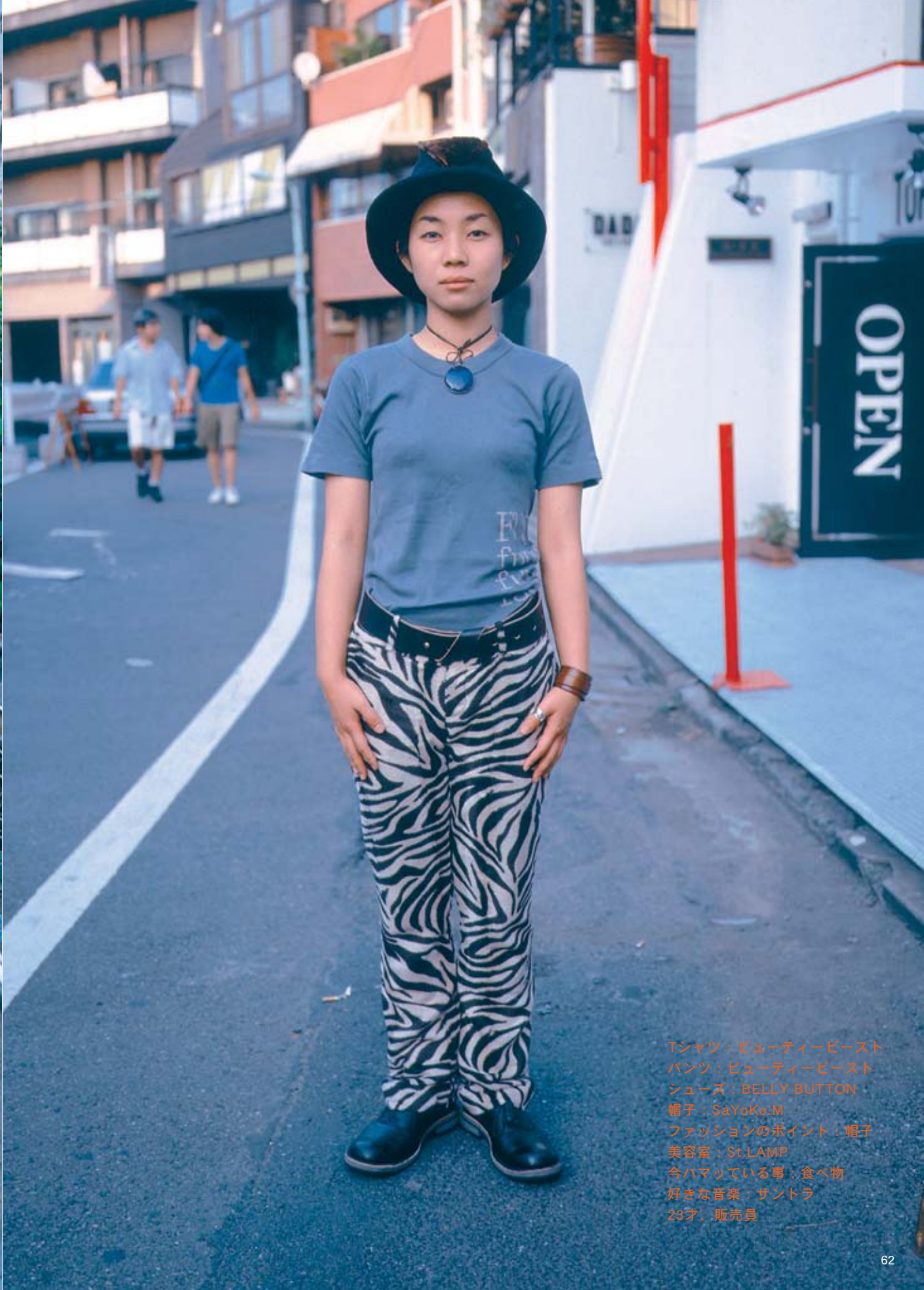
Tシャツ：ビューティービースト パンツ：ビューティービースト シューズ：BELLY BUTTON 帽子：SaYoKo.M ファッションのポイント：帽子 美容室：St.LAMP 今ハマっている事：食べ物 好きな音楽：サントラ 23才、販売員