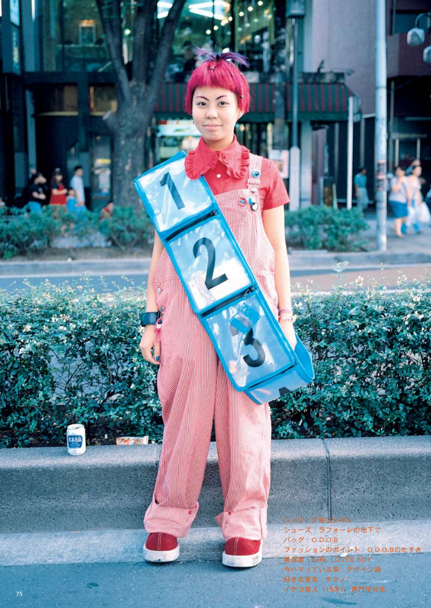
シャツ：アルゴンキン シューズ：ラフォーレの地下で バッグ：O.D.O.B ファッションのポイント：O.D.O.Bのたすき 美容室：GIRL LOVES BOY 今ハマっている事：デザイン画 好きな音楽：テクノ イチゴ星人（18才）、専門学校生