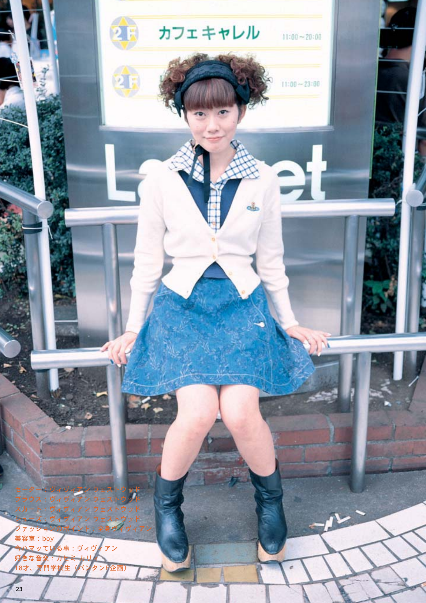
セーター：ヴィヴィアン ウェストウッド ブラウス：ヴィヴィアン ウェストウッド スカート：ヴィヴィアン ウェストウッド シューズ：ヴィヴィアン ウェストウッド ファッションのポイント：全身ヴィヴィアン 美容室：boy 今ハマっている事：ヴィヴィアン 好きな音楽：カセミ カリイ 18才、専門学校生（パンタンF企画）