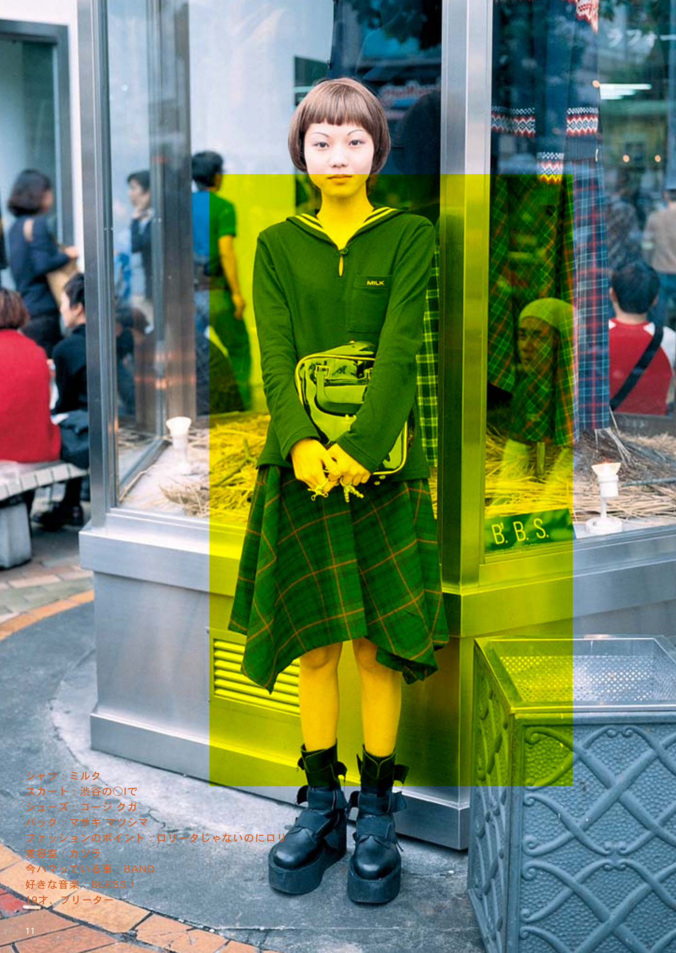
シャツ：ミルク スカート：渋谷の〇Iで シューズ：コージ クガ バッグ：マサキ マツシマ ファッションのポイント：ロリータじゃないのにロリ 美容室：カツラ 今ハマっている事：BAND 好きな音楽：BLESS！ 18才、フリーター