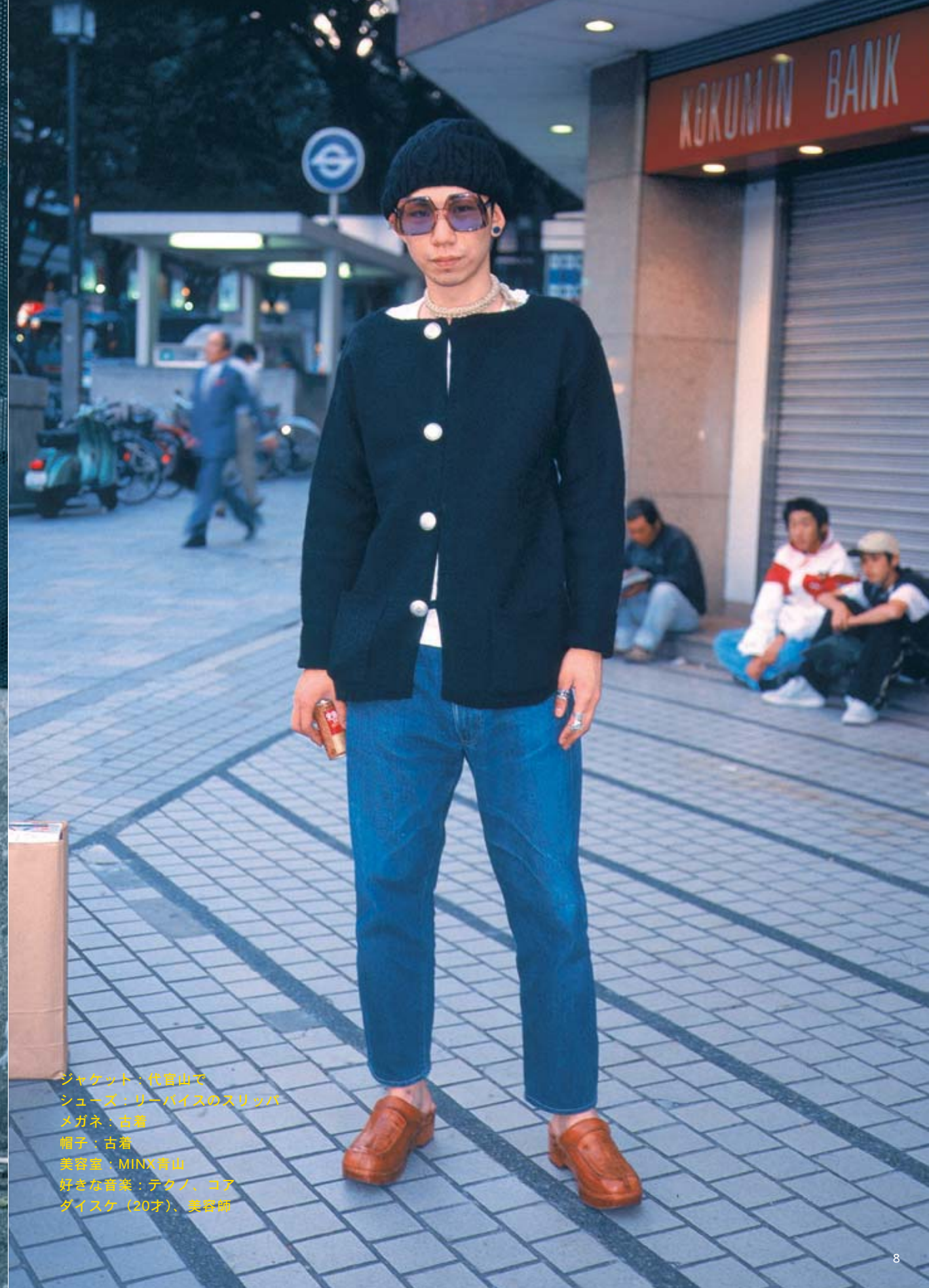
ジャケット：代官山で シューズ：リーバイスのスリッパ メガネ：古着 帽子：古着 美容室：MINX青山 好きな音楽：テクノ、コア ディスケ (20才)、美容師