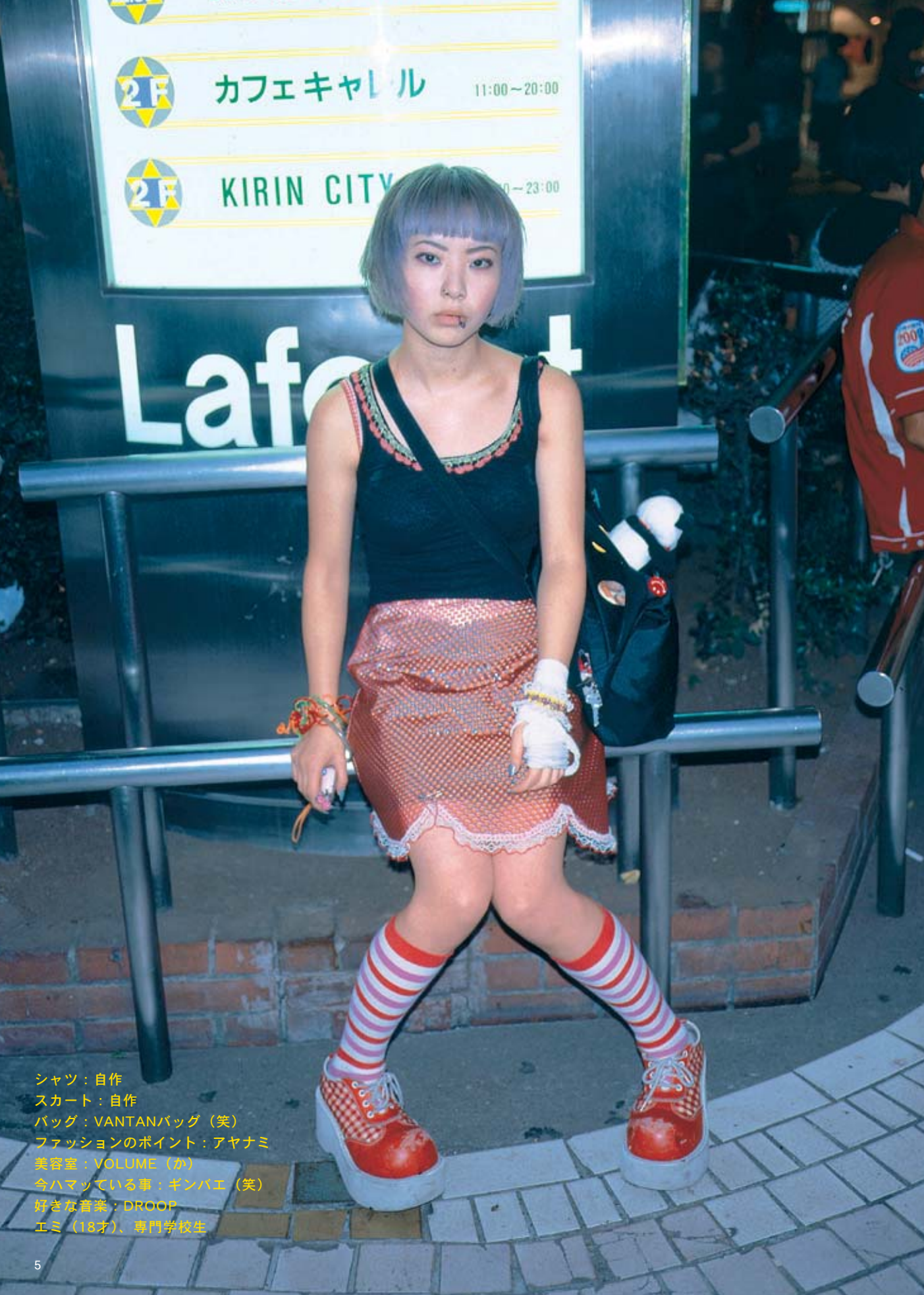
シャツ：自作 スカート：自作 バッグ：VANTANバッグ（笑） ファッションのポイント：アヤナミ 美容室：VOLUME（か） 今ハマっている事：ギンバエ（笑） 好きな音楽：DROOP エミ（18才）、専門学校生