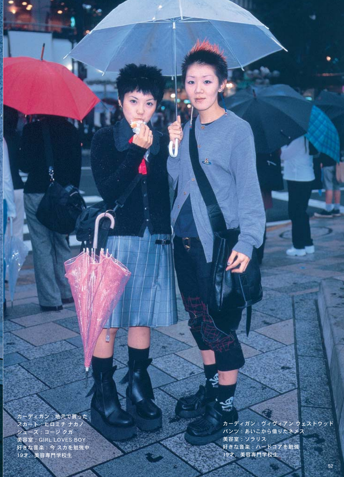
カーディガン：地元で買った スカート：ヒロミチ ナカノ シューズ：コージクガ 美容室：GIRL LOVES BOY 好きな音楽：今 スカを勉強中 19才、美容専門学校生