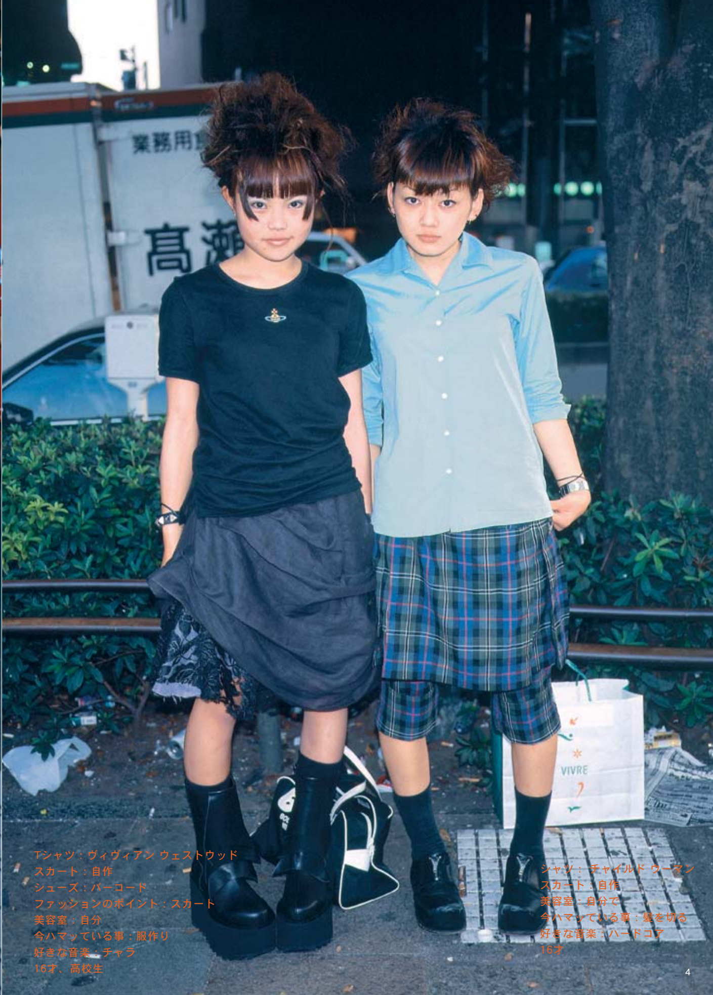
Tシャツ：ヴィヴィアン ウェストウッド スカート：自作 シューズ：バーコード ファッションのポイント：スカート 美容室：自分 今ハマっている事：服作り 好きな音楽：チャラ 16才、高校生