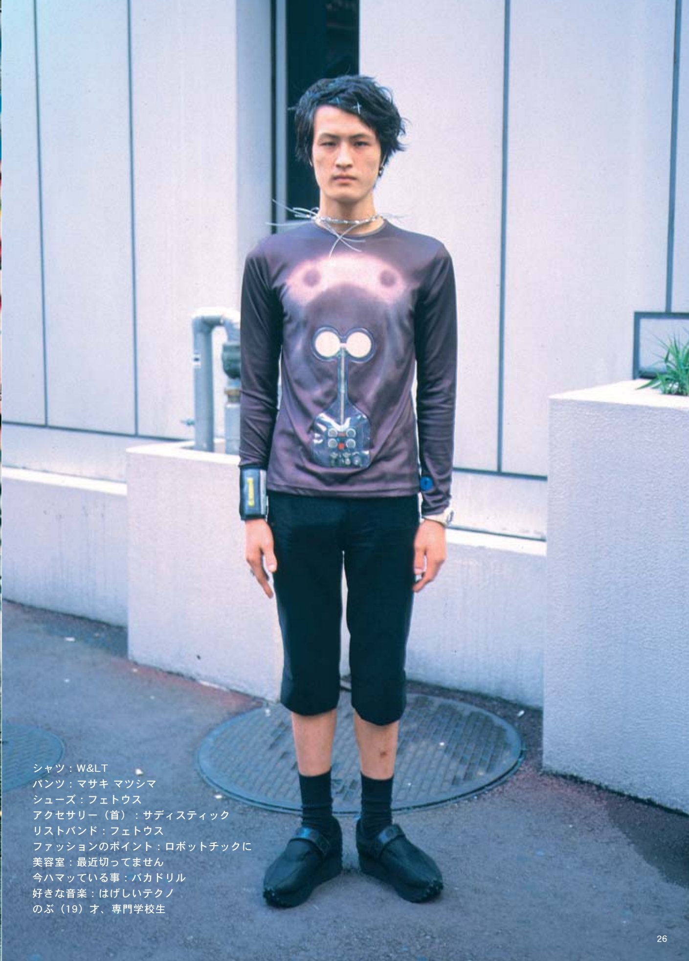
シャツ：W&LT パンツ：マサキ マツシマ シューズ：フェトウス アクセサリー（首）：サディスティック リストバンド：フェトウス ファッションのポイント：ロボットチックに 美容室：最近切ってません 今ハマっている事：バカドリル 好きな音楽：はげしいテクノ のぶ（19）才、専門学校生