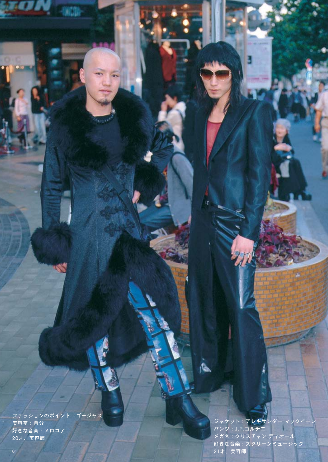
ファッションのポイント：ゴージャス 美容室：自分 好きな音楽：メロコア 20才、美容師