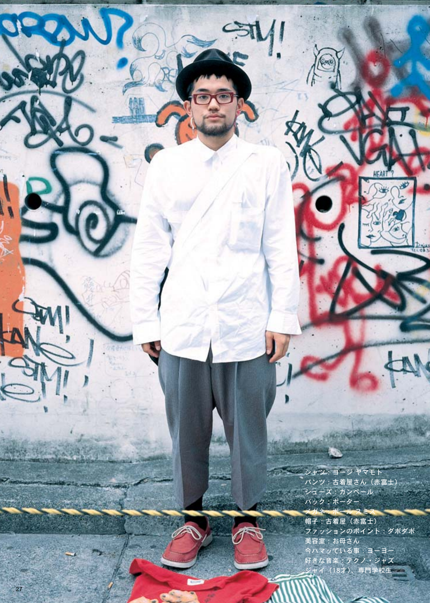
シャツ：ヨージ ヤマモト パンツ：古着屋さん（赤富士） シューズ：カンペール バック：ポーター メガネ：ポール スミス 帽子：古着屋（赤富士） ファッションのポイント：ダボダボ 美容室：お母さん 今ハマっている事：ヨーヨー 好きな音楽：テクノ・ジャズ ジャイ（18才）、専門学校生