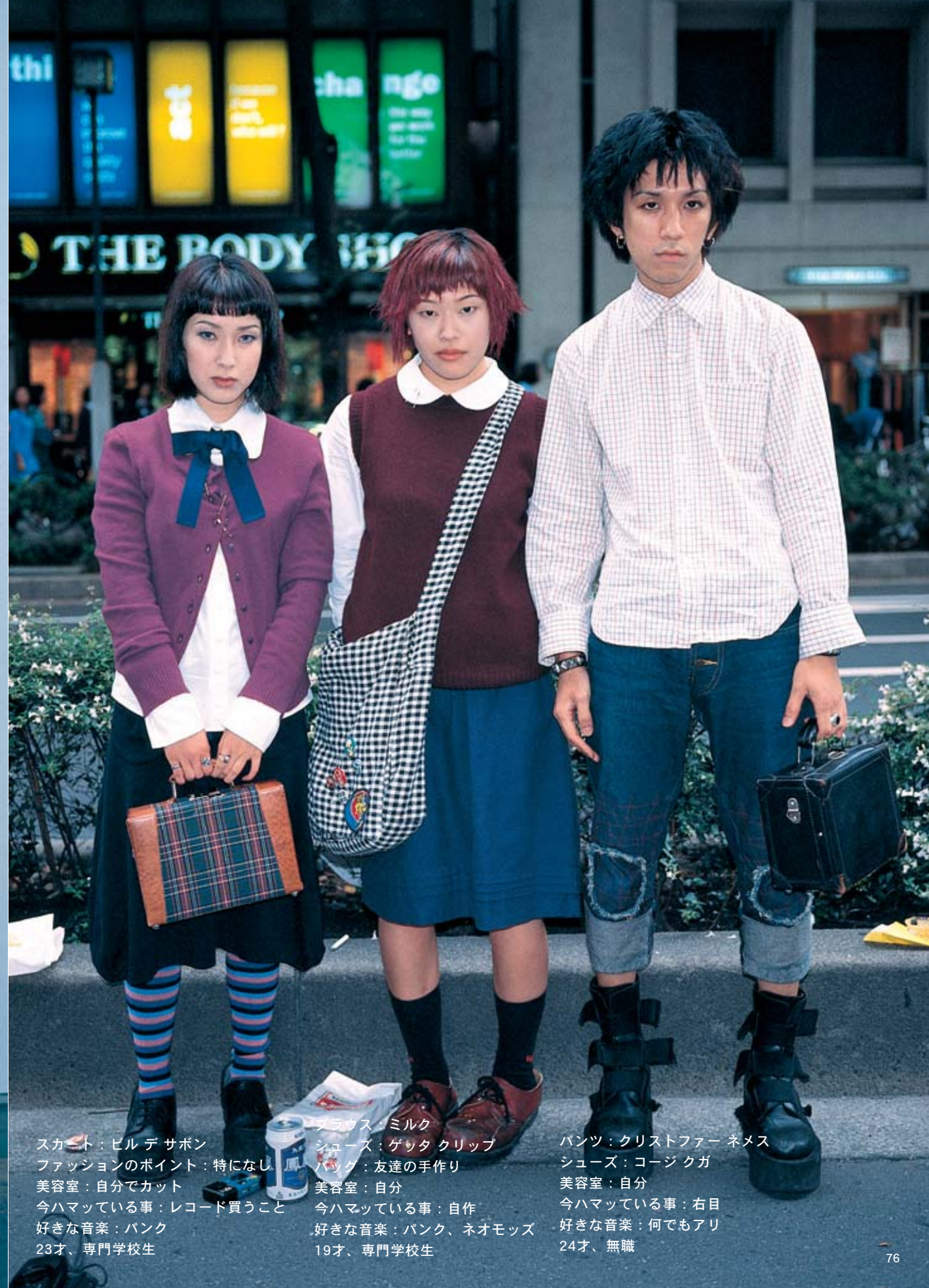
スカート：ビル デ サボン ファッションのポイント：特になし 美容室：自分でカット 今ハマっている事：レコード買うこと 好きな音楽：パンク 23才、専門学校生