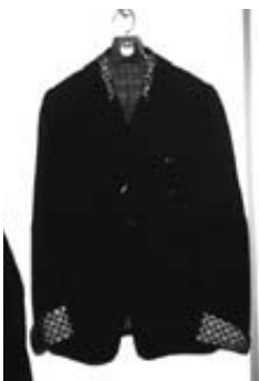
ジャケット (No Dead Artist) ¥49,000