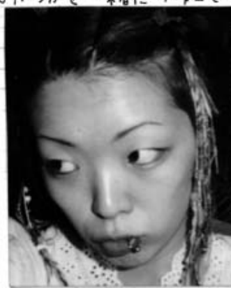
夏こそ、2030のエクステン ションがいっぱい♡

●家➡今は世田谷に1人暮らししてる。最近部屋の模様替えをした。壁には一面バトマンがいて、かわいい。テレビはピンクにぬって、冷蔵庫は青くぬった。ハンズでブラックライトを買って大奮発した。狭い家なのに、リノヴァーになって、いろいろも購入してしまったので、生体ヨウ柄で、夜にゴチよくて、気に入ってる。110kgと一糸着にリノヴァーで、なごろがってテレビみるのがスキ。夜はゴロゴロまったりが、落ちつく。