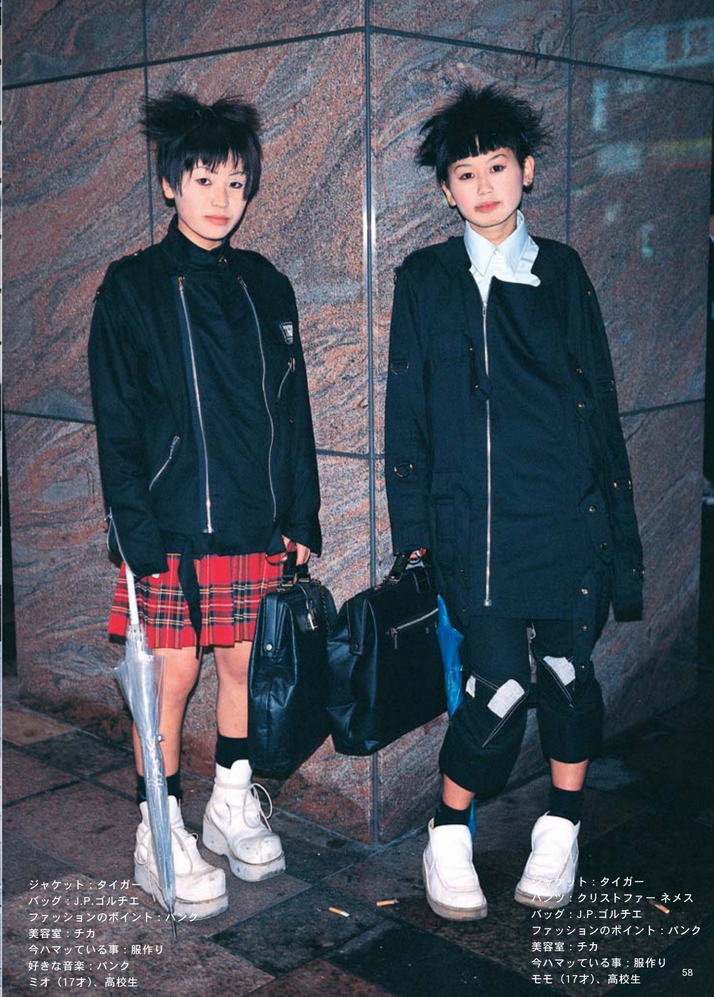
ジャケット：タイガー パンツ：クリストファー ネメス バッグ：J.P.ゴルチエ ファッションのポイント：パンク 美容室：チカ 今ハマっている事：服作り モモ（17才）、高校生