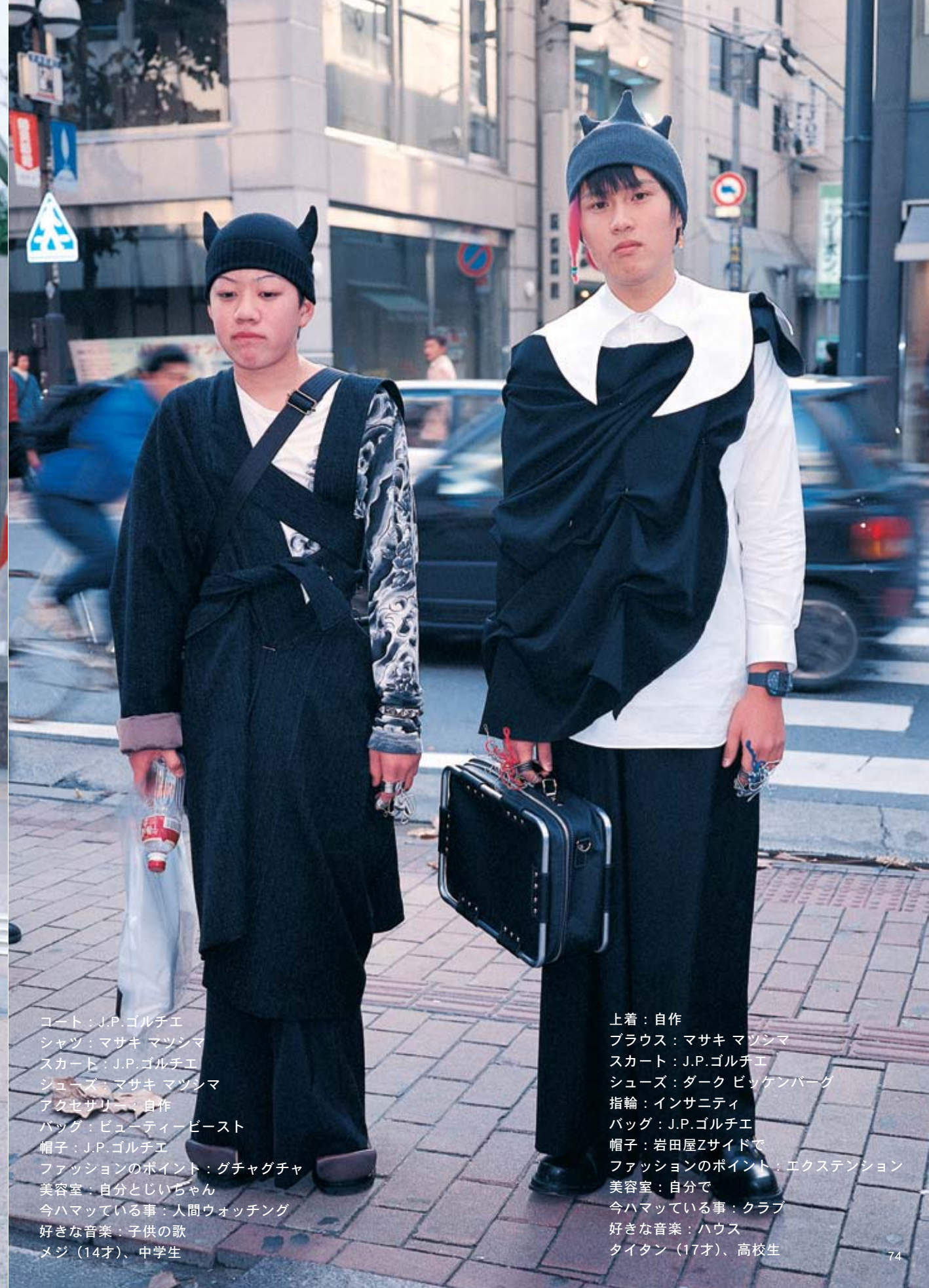
コート：J.P.ゴルチエ シャツ：マサキ マツシマ スカート：J.P.ゴルチエ シューズ：マサキ マツシマ アクセサリー：自作 バッグ：ビューティービースト 帽子：J.P.ゴルチエ ファッションのポイント：グチャグチャ 美容室：自分とじいちゃん 今ハマっている事：人間ウォッチング 好きな音楽：子供の歌 メジ（14才）、中学生