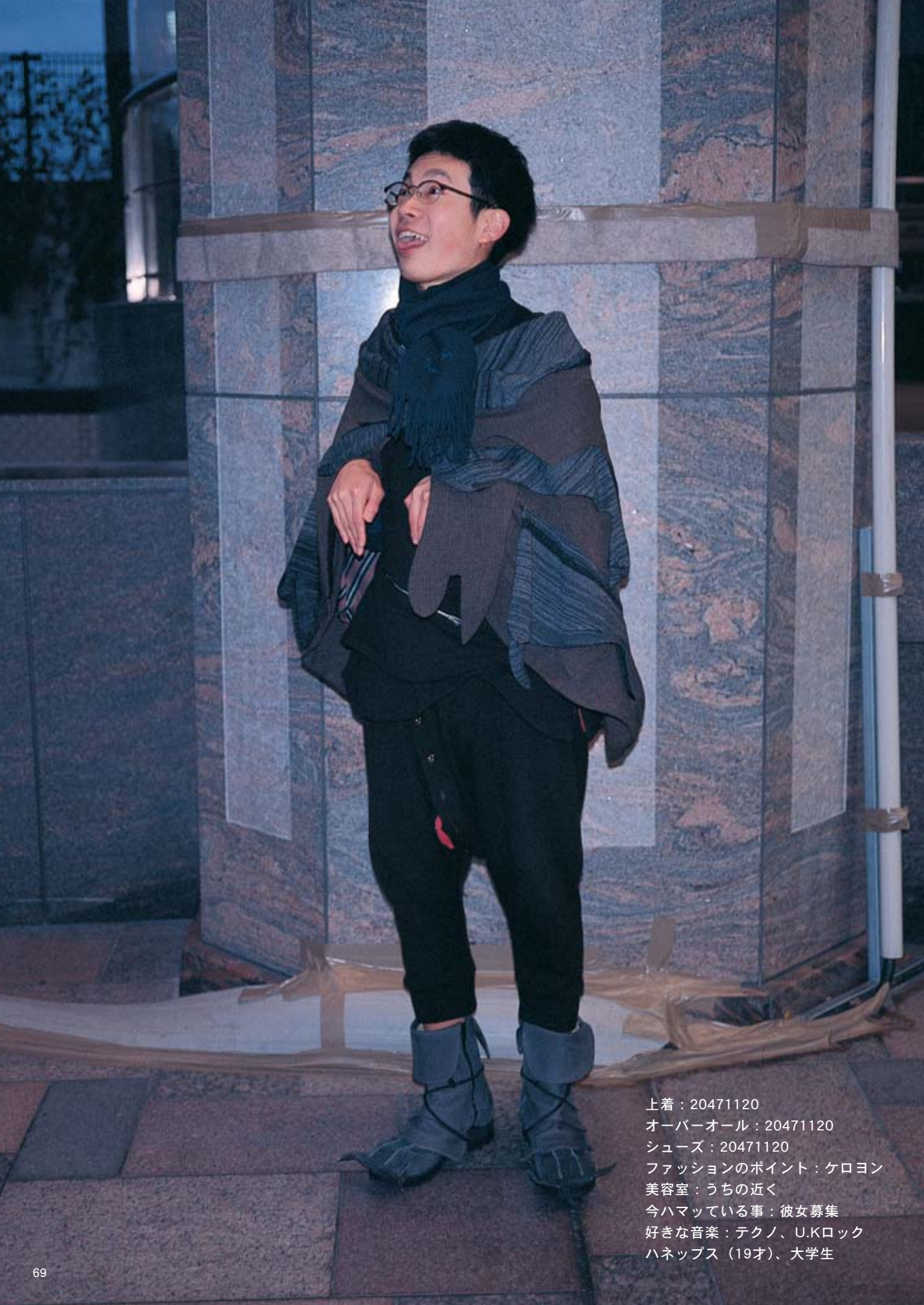
上着：20471120 オーバーオール：20471120 シューズ：20471120 ファッションのポイント：ケロヨン 美容室：うちの近く 今ハマっている事：彼女募集 好きな音楽：テクノ、U.Kロック ハネpps（19才）、大学生