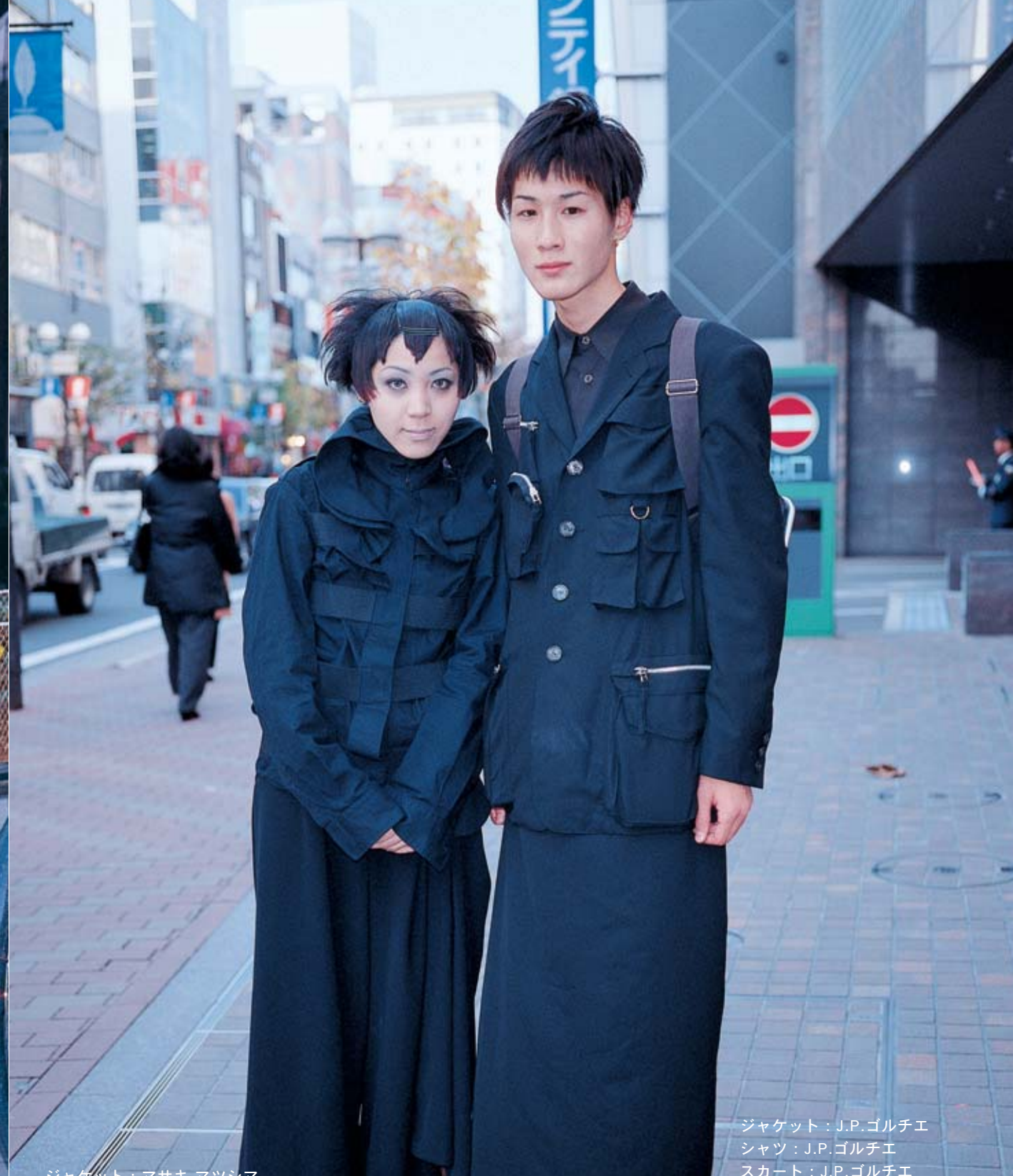
ジャケット：マサキ マツシマ ブラウス：マサキ マツシマ スカート：J.P.ゴルチエ シューズ：ベリー ボタン ファッションのポイント：ブラウスのエリのクルクル具合 美容室：自分で 今ハマっている事：フリマをするコト 好きな音楽：CHARA サオリ（19才）、専門学校生