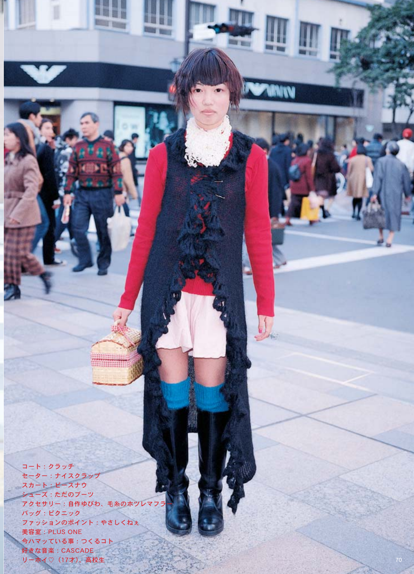
コート：クラッチ セーター：ナイスクラブ スカート：ピースナウ シューズ：ただのブーツ アクセサリー：自作ゆびわ、毛糸のホットレマフラー バッグ：ピクニック ファッションのポイント：やさしくねえ 美容室：PLUS ONE 今ハマっている事：つくるコト 好きな音楽：CASCADE リーホイ♡ (17才)、高校生