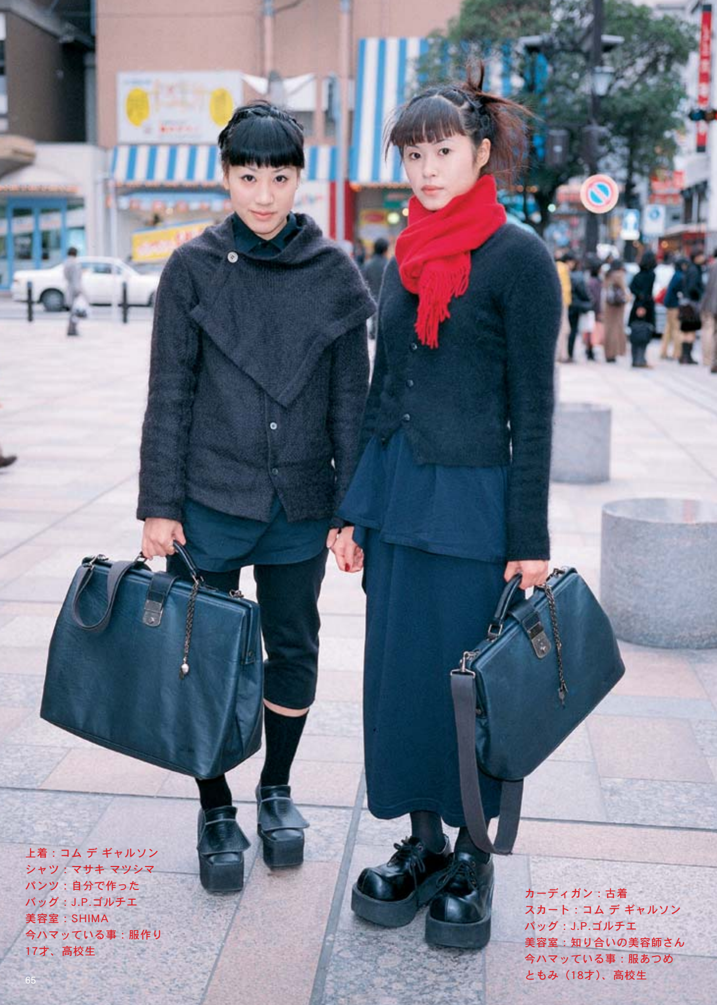
上着：コム デ ギャルソン シャツ：マサキ マツシマ パンツ：自分で作った バッグ：J.P.ゴルチエ 美容室：SHIMA 今ハマっている事：服作り 17才、高校生