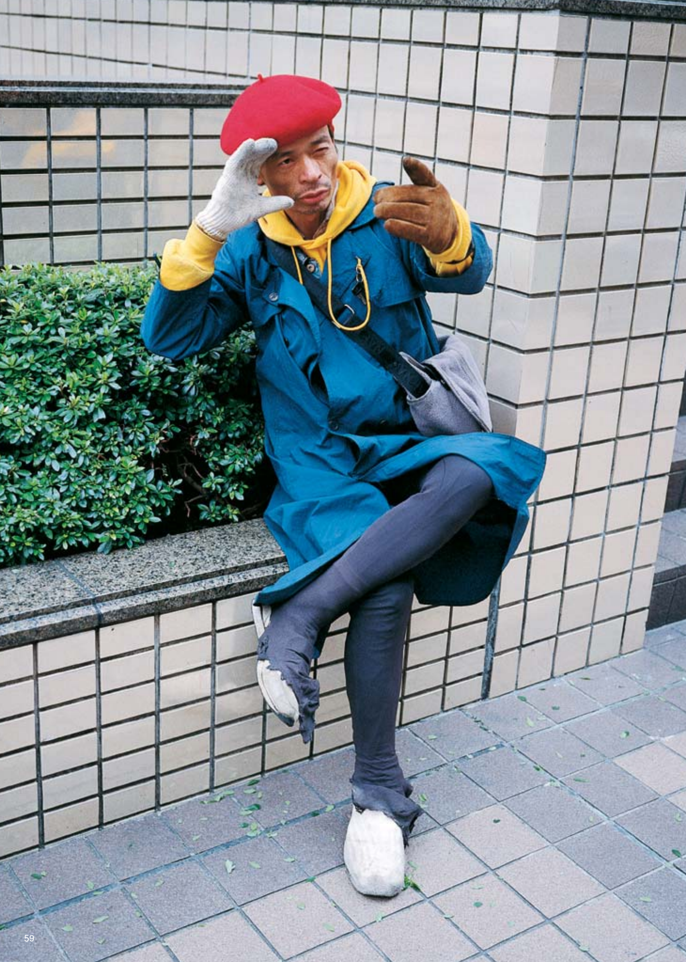
ジャケット：タイガー バッグ：J.P.ゴルチエ ファッションのポイント：パンク 美容室：チカ 今ハマっている事：服作り 好きな音楽：パンク ミオ（17才）、高校生