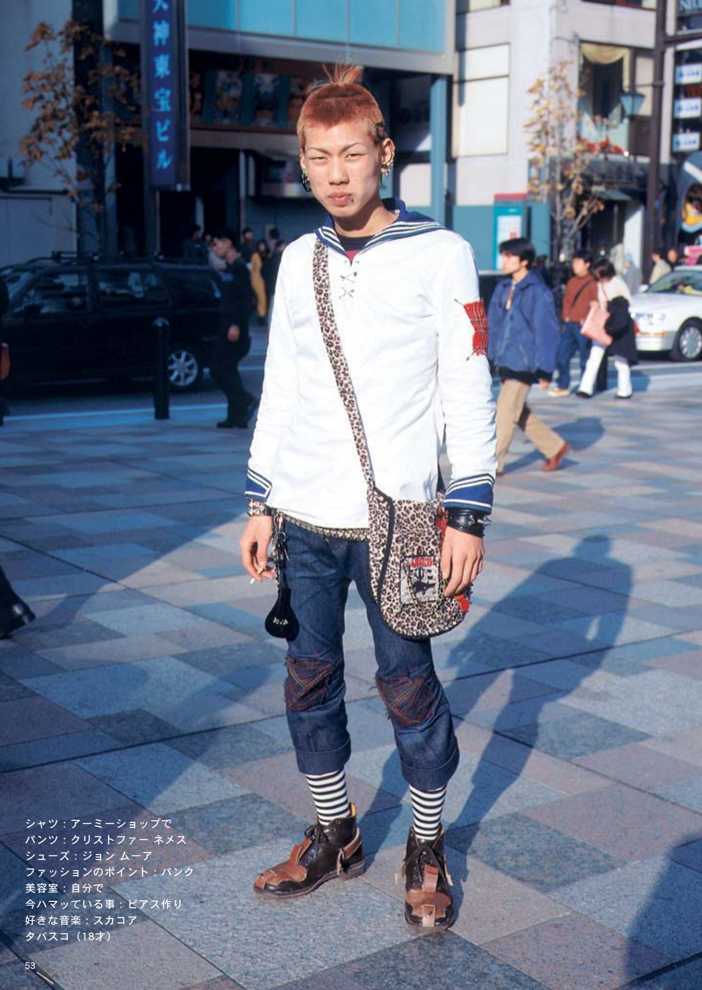
シャツ：アーミーショップで パンツ：クリストファー ネメス シューズ：ジョン ムーア ファッションのポイント：パンク 美容室：自分で 今ハマっている事：ピアス作り 好きな音楽：スカコア タバスコ（18才）