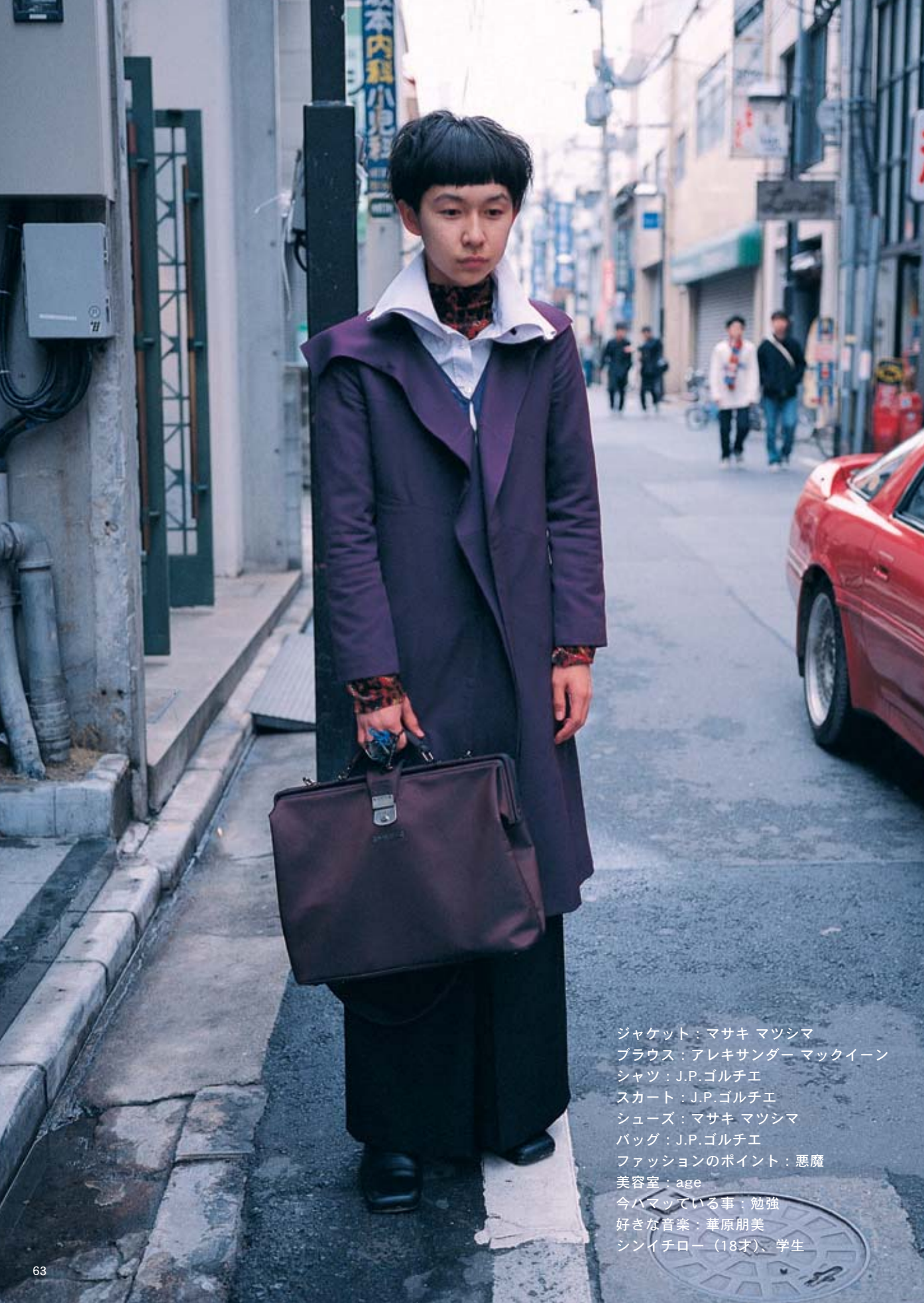
ジャケット：マサキ マツシマ ブラウス：アレキサンダー マックイーン シャツ：J.P. ゴルチエ スカート：J.P. ゴルチエ シューズ：マサキ マツシマ バッグ：J.P. ゴルチエ ファッションのポイント：悪魔 美容室：age 今ハマっている事：勉強 好きな音楽：華原朋美 シンイチロー（18才）、学生