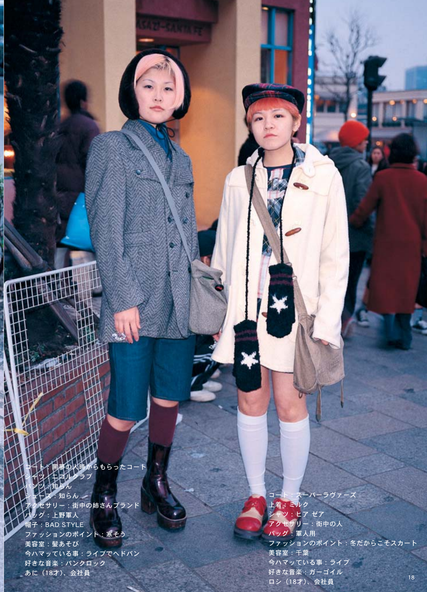
コート：黒夢の人時からもらったコート シャツ：エコルクラブ パンツ：知らん シューズ：知らん アクセサリ：街中の姉さんブランド バッグ：上野軍人 帽子：BAD STYLE ファッションのポイント：寒そう 美容室：髪あそび 今ハマっている事：ライブでヘッドバン 好きな音楽：パンクロック あに（18才）、会社員