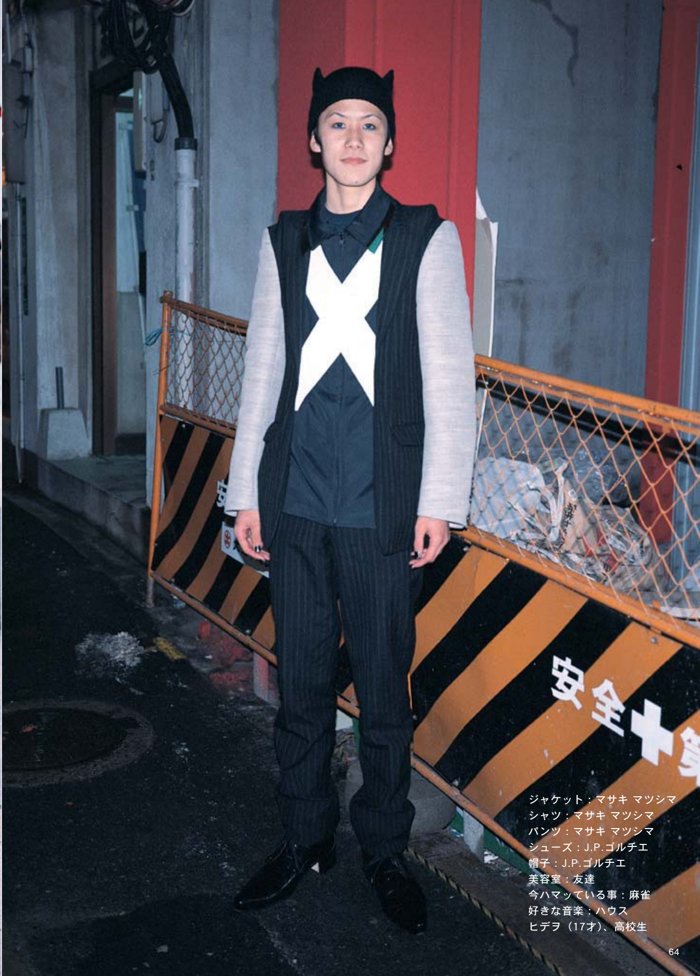
ジャケット：マサキ マツシマ シャツ：マサキ マツシマ パンツ：マサキ マツシマ シューズ：J.P.ゴルチエ 帽子：J.P.ゴルチエ 美容室：友達 今ハマっている事：麻雀 好きな音楽：ハウス ヒデヲ（17才）、高校生