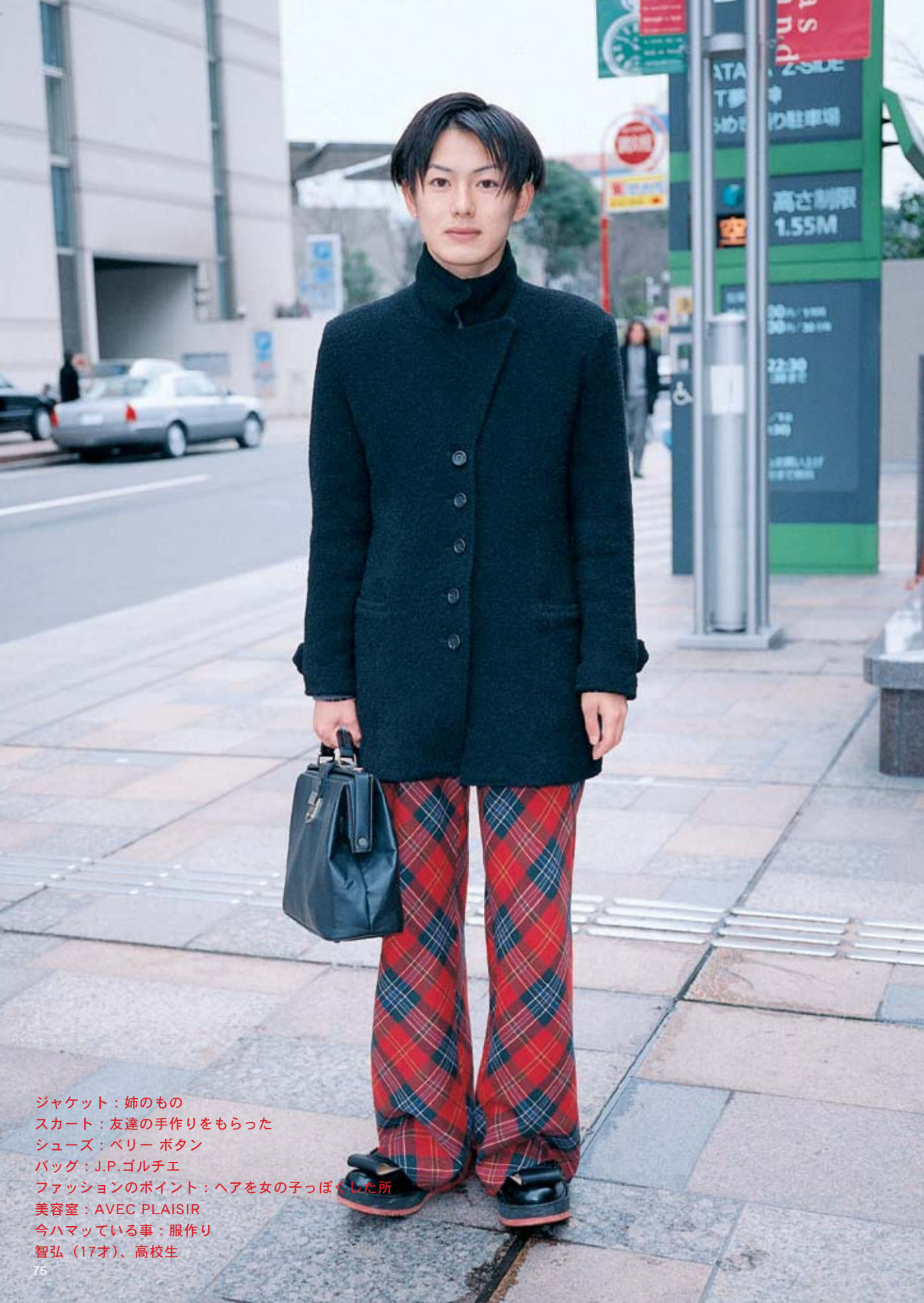
ジャケット：姉のもの スカート：友達の手作りをもらった シューズ：ベリー ボタン バッグ：J.P.ゴルチエ ファッションのポイント：ヘアを女の子っぽくした所 美容室：AVEC PLAISIR 今ハマっている事：服作り 智弘（17才）、高校生