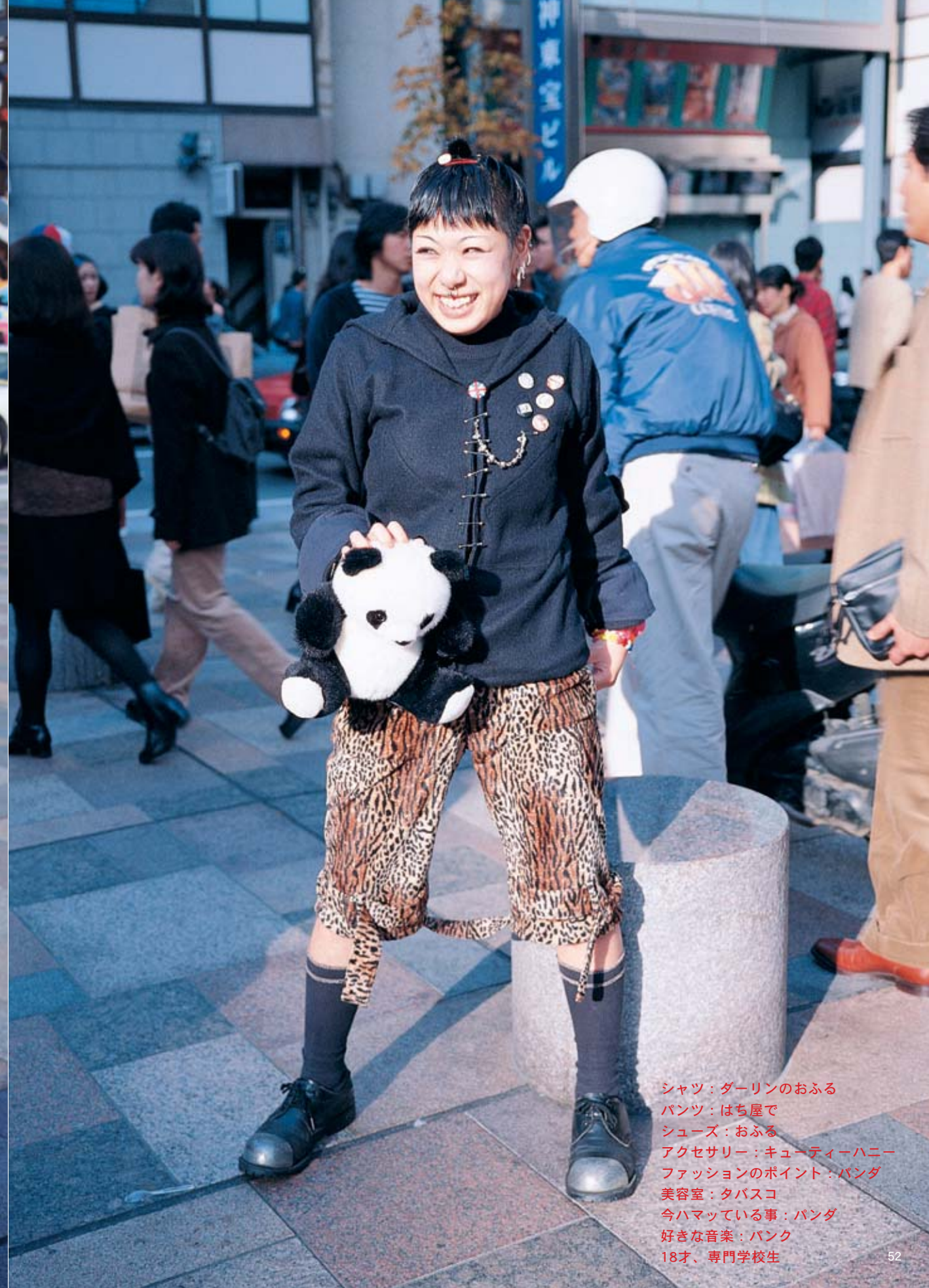
シャツ：ダーリンのおふる パンツ：はち屋で シューズ：おふる アクセサリー：キューティーハニー ファッションのポイント：パンダ 美容室：タバスコ 今ハマっている事：パンダ 好きな音楽：パンク 18才、専門学校生