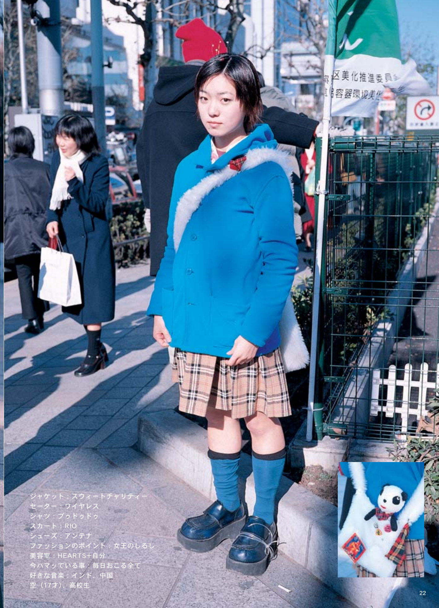
ジャケット：スウィートチャリティー セーター：ワイヤレス シャツ：ブッドゥゥ スカート：RIO シューズ：アンテナ ファッションのポイント：女王のしるし 美容室：HEARTS+自分 今ハマっている事：毎日おこる全て 好きな音楽：インド、中国 空（17才）、高校生