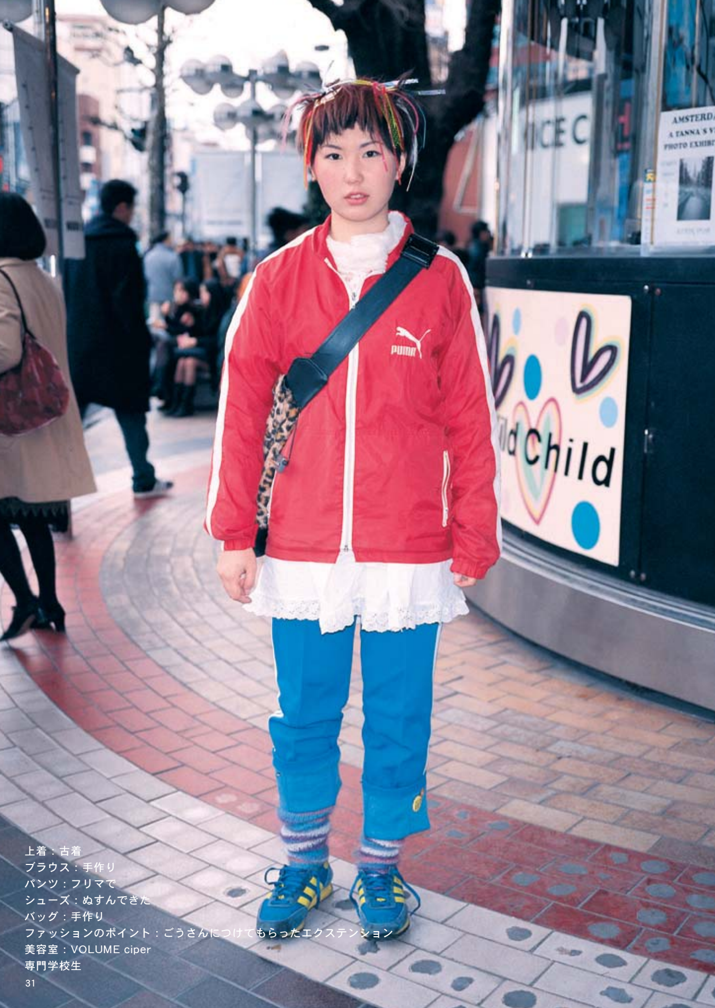
上着：古着 ブラウス：手作り パンツ：フリマで シューズ：ぬすんできた バッグ：手作り ファッションのポイント：ごうさんにつけてもらったエクステンション 美容室：VOLUME ciper 専門学校生