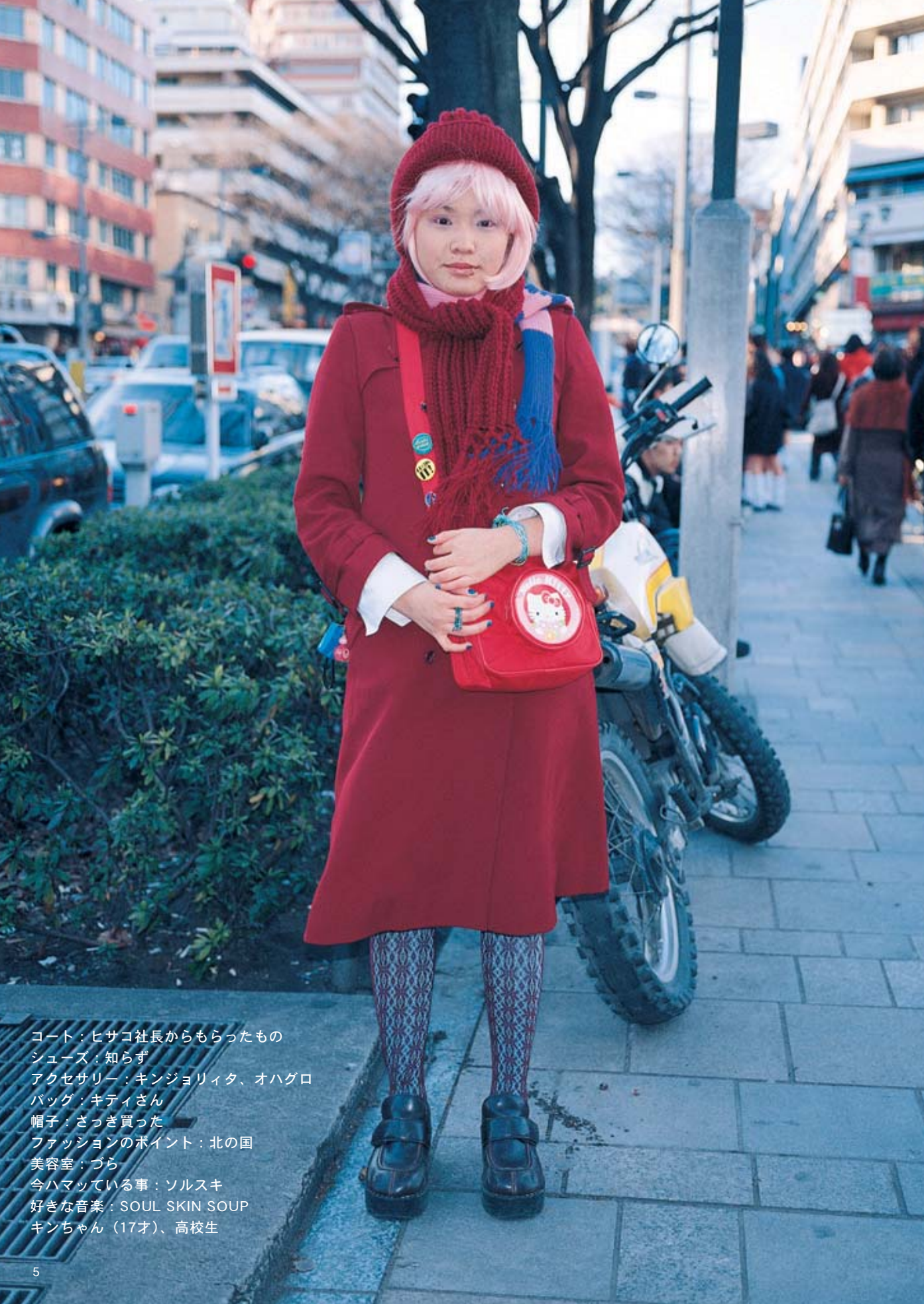
コート：ヒサコ社長からもらったもの シューズ：知らず アクセサリー：キンジョリィタ、オハグロ バッグ：キティさん 帽子：さっき買った ファッションのポイント：北の国 美容室：づら 今ハマっている事：ソルスキ 好きな音楽：SOUL SKIN SOUP キンちゃん（17才）、高校生