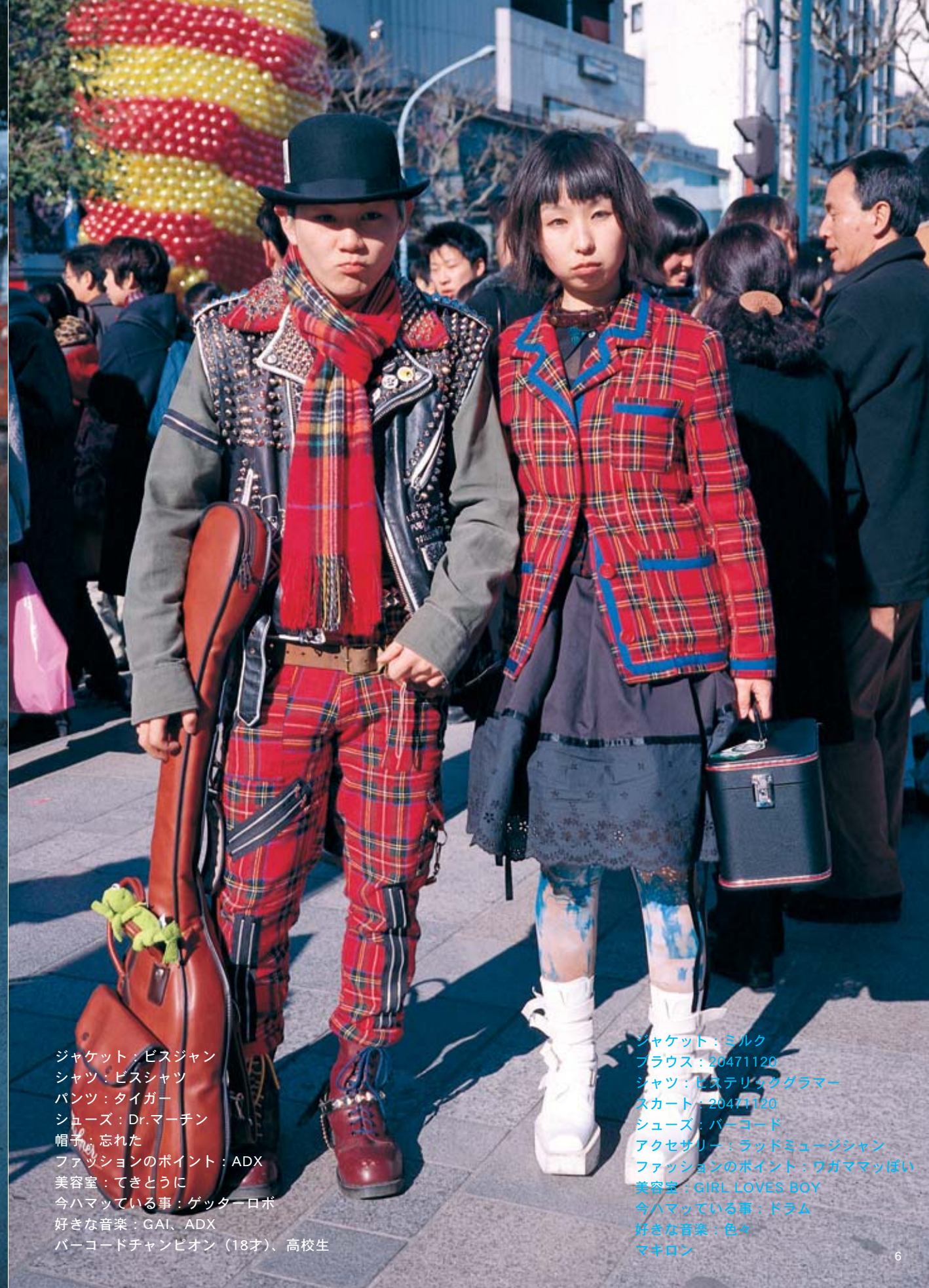
ジャケット：ビスジャン シャツ：ビスシャツ パンツ：タイガー シューズ：Dr.マーチン 帽子：忘れた ファッションのポイント：ADX 美容室：てきとうに 今ハマっている事：ゲッターロボ 好きな音楽：GAI、ADX バーコードチャンピオン（18才）、高校生