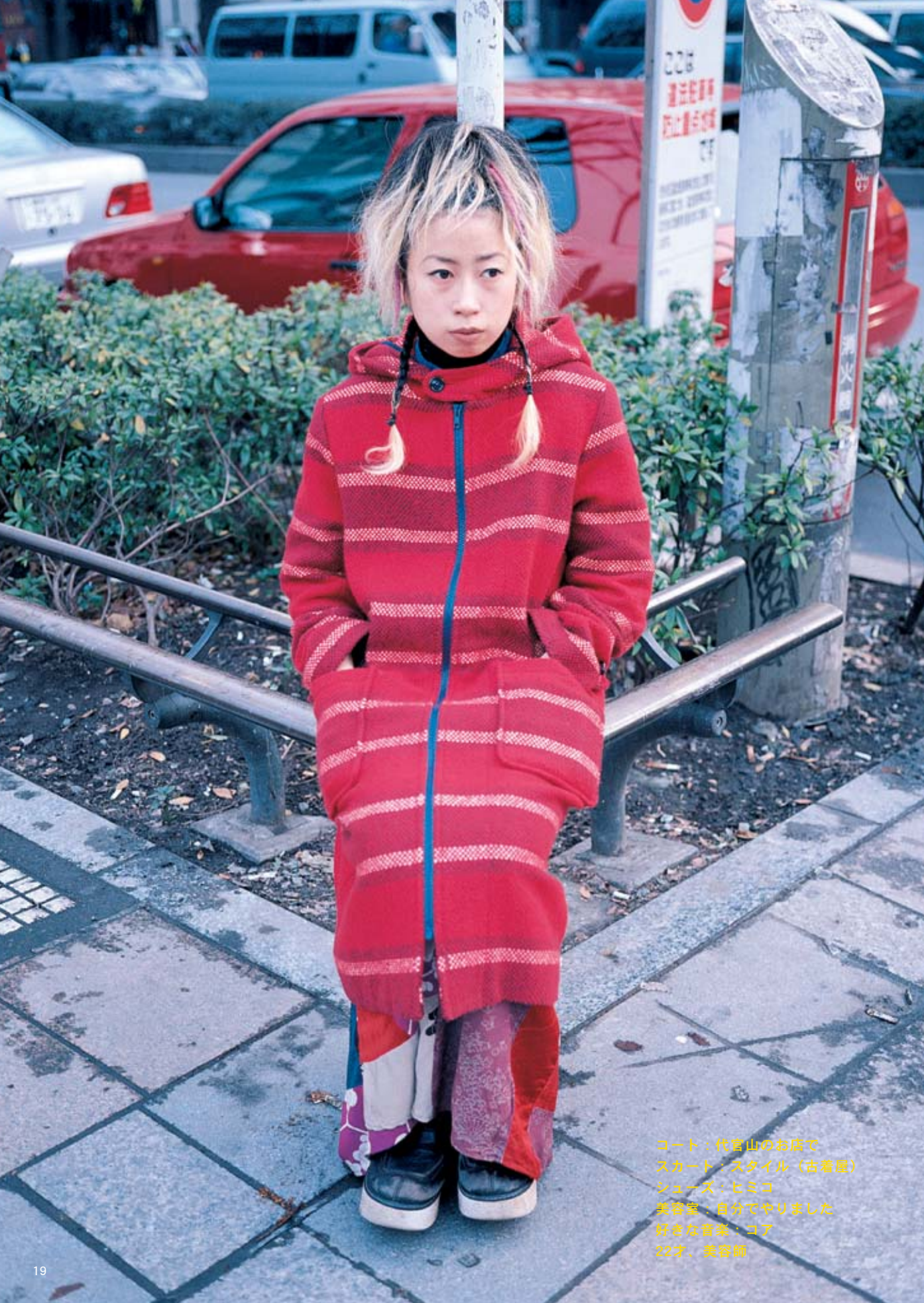
コート：代官山のお店で スカート：スタイル（古着屋） シューズ：ヒミコ 美容室：自分でやりました 好きな音楽：コア 22才、美容師