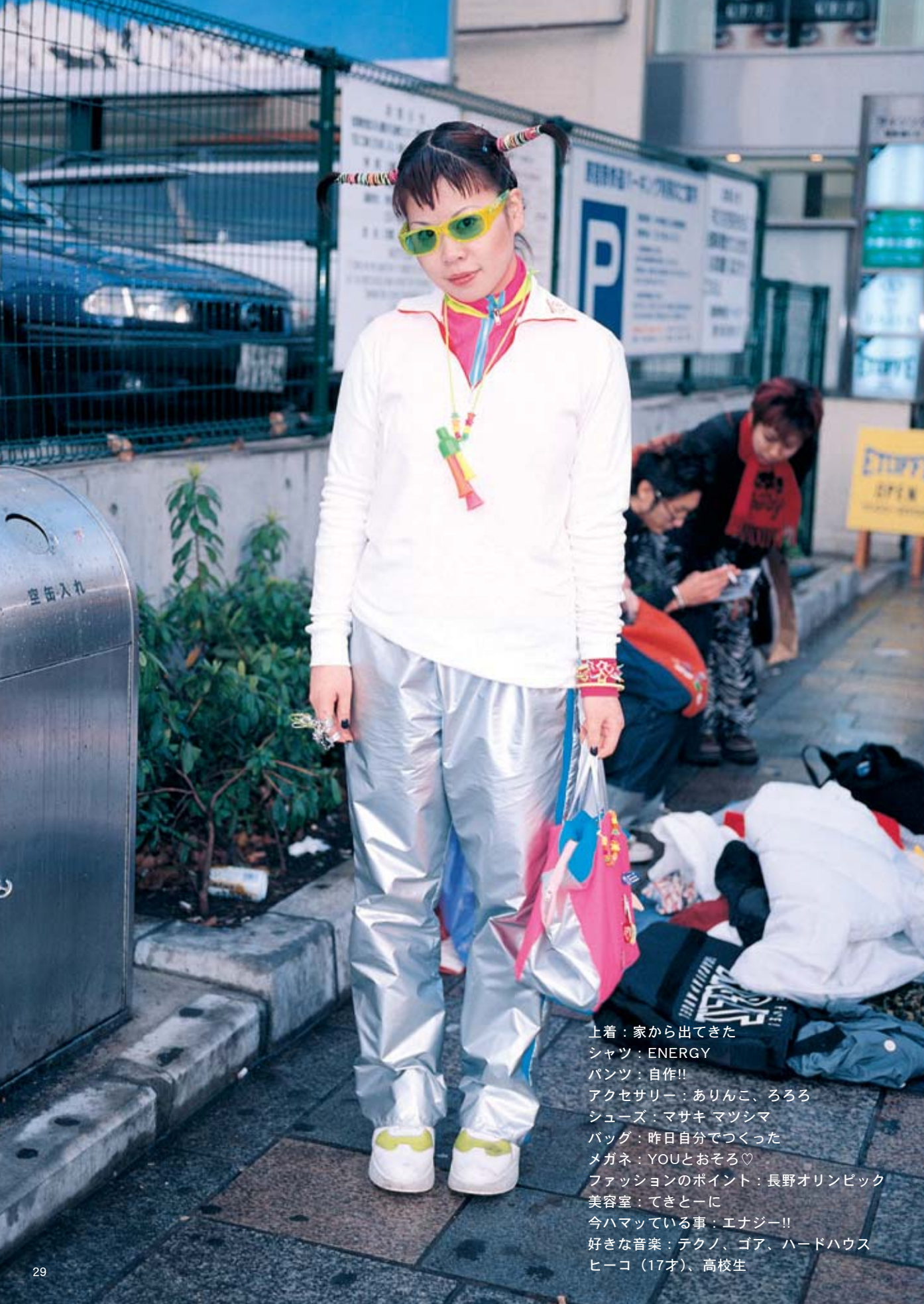
上着：家から出てきた シャツ：ENERGY パンツ：自作!! アクセサリー：ありんこ、ろろろ シューズ：マサキ マツシマ バッグ：昨日自分でつくった メガネ：YOUとおそろい♡ ファッションのポイント：長野オリンピック 美容室：てきとーに 今ハマっている事：エナジー!! 好きな音楽：テクノ、ゴア、ハードハウス ヒーコ（17才）、高校生