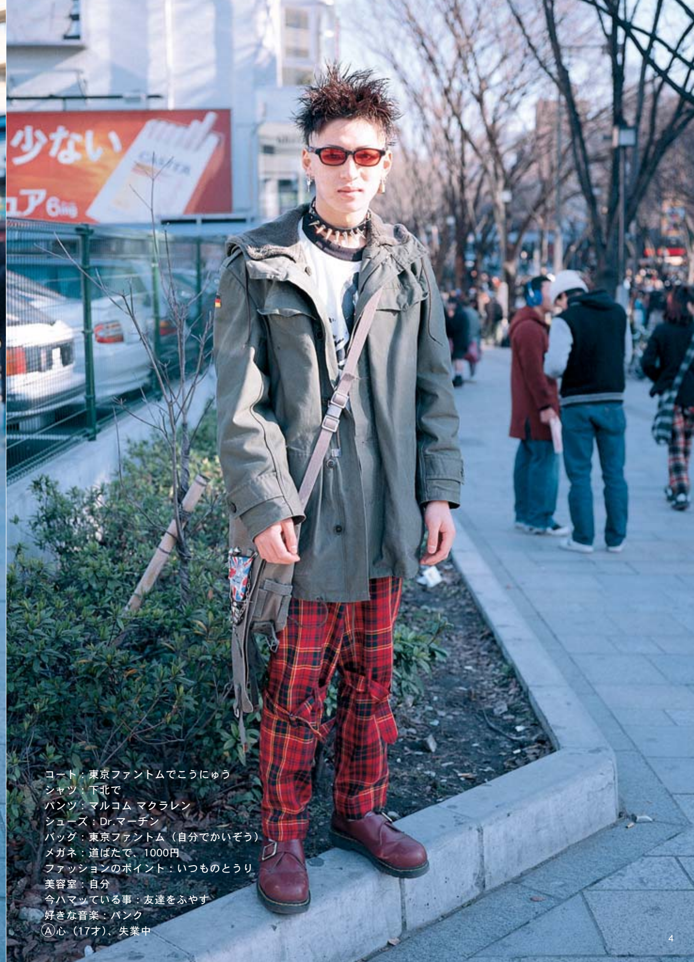
コート：東京ファントムでこうにゅう シャツ：下北で パンツ：マルコム マクラレン シューズ：Dr.マーチン バッグ：東京ファントム（自分がかいぞう） メガネ：道ばたで、1000円 ファッションのポイント：いつものとうり 美容室：自分 今ハマっている事：友達をふやす 好きな音楽：パンク ①心（17才）、失業中