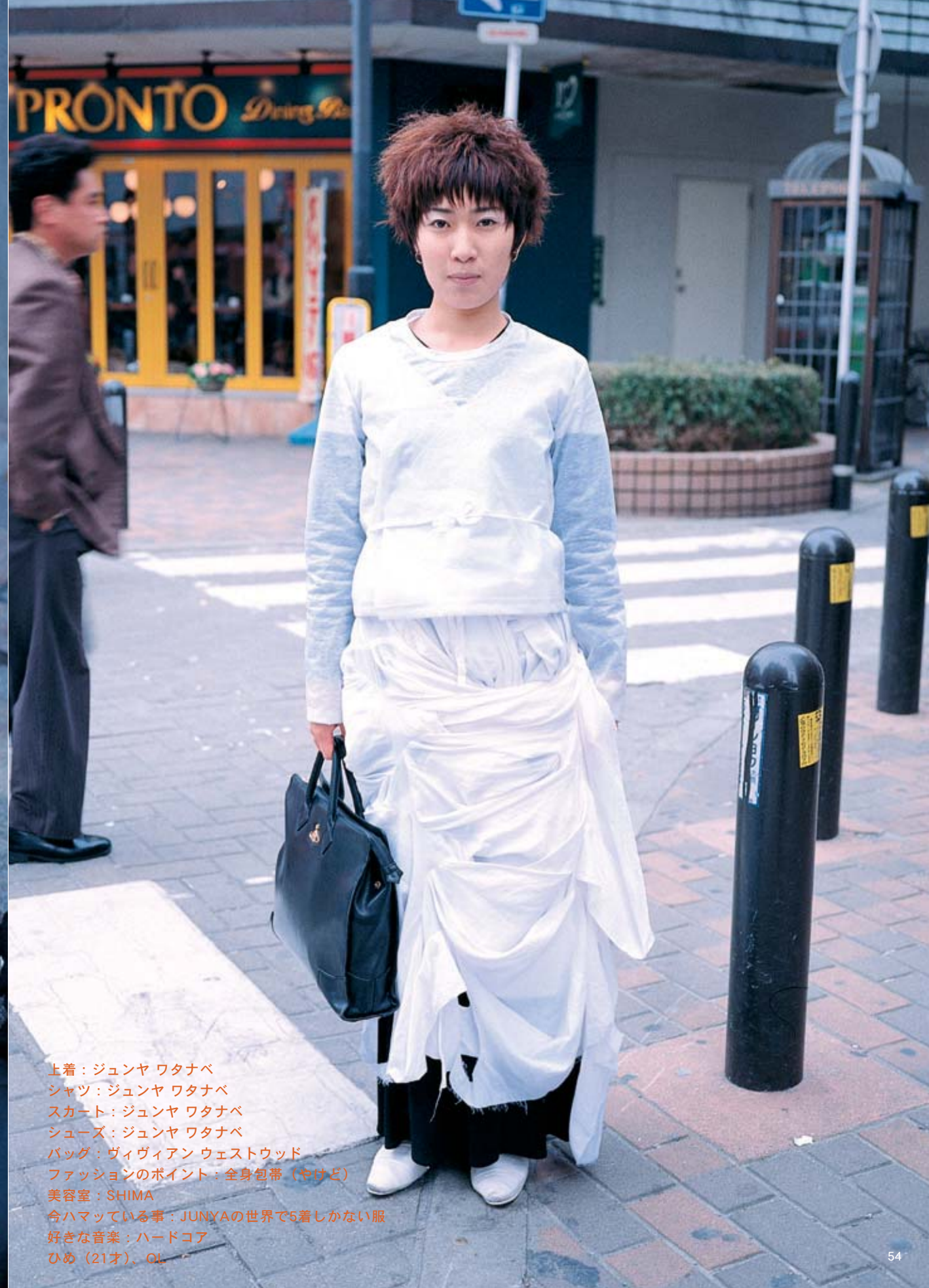
上着：ジュンヤ ワタナベ シャツ：ジュンヤ ワタナベ スカート：ジュンヤ ワタナベ シューズ：ジュンヤ ワタナベ バッグ：ヴィヴィアン ウェストウッド ファッションのポイント：全身包帯（やけど） 美容室：SHIMA 今ハマっている事：JUNYAの世界で5着しかない服 好きな音楽：ハードコア ひめ (21才)、OL