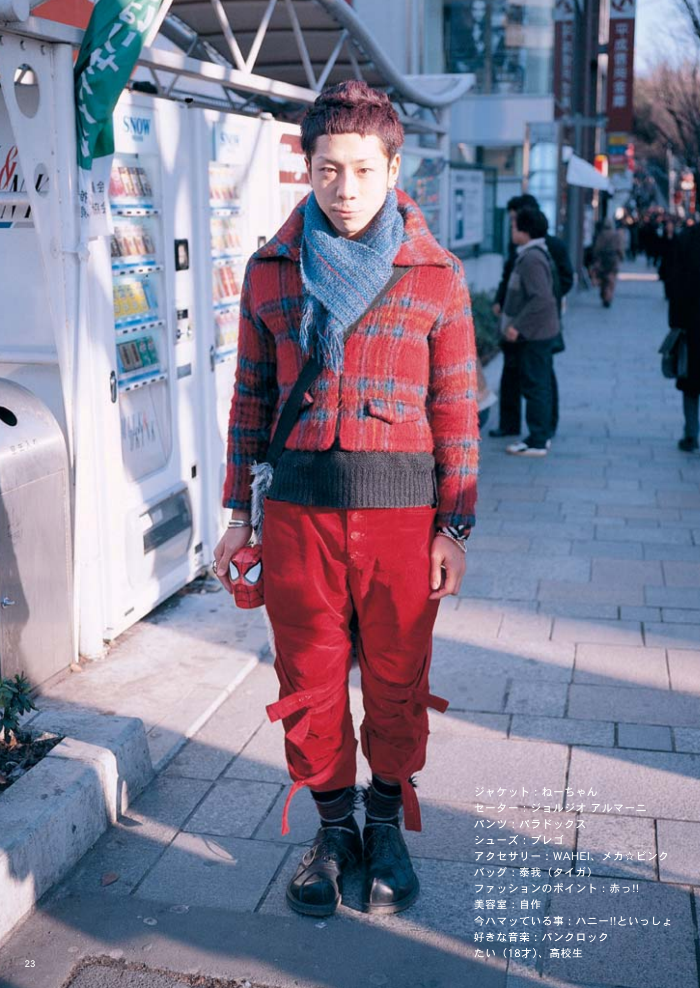
ジャケット：ねーちゃん セーター：ジョルジオ アルマーニ パンツ：パラドックス シューズ：ブレゴ アクセサリー：WAHEI、メカ☆ピンク バッグ：泰我（タイガ） ファッションのポイント：赤っ!! 美容室：自作 今ハマっている事：ハニー!!といっしょ 好きな音楽：パンクロック たい（18才）、高校生