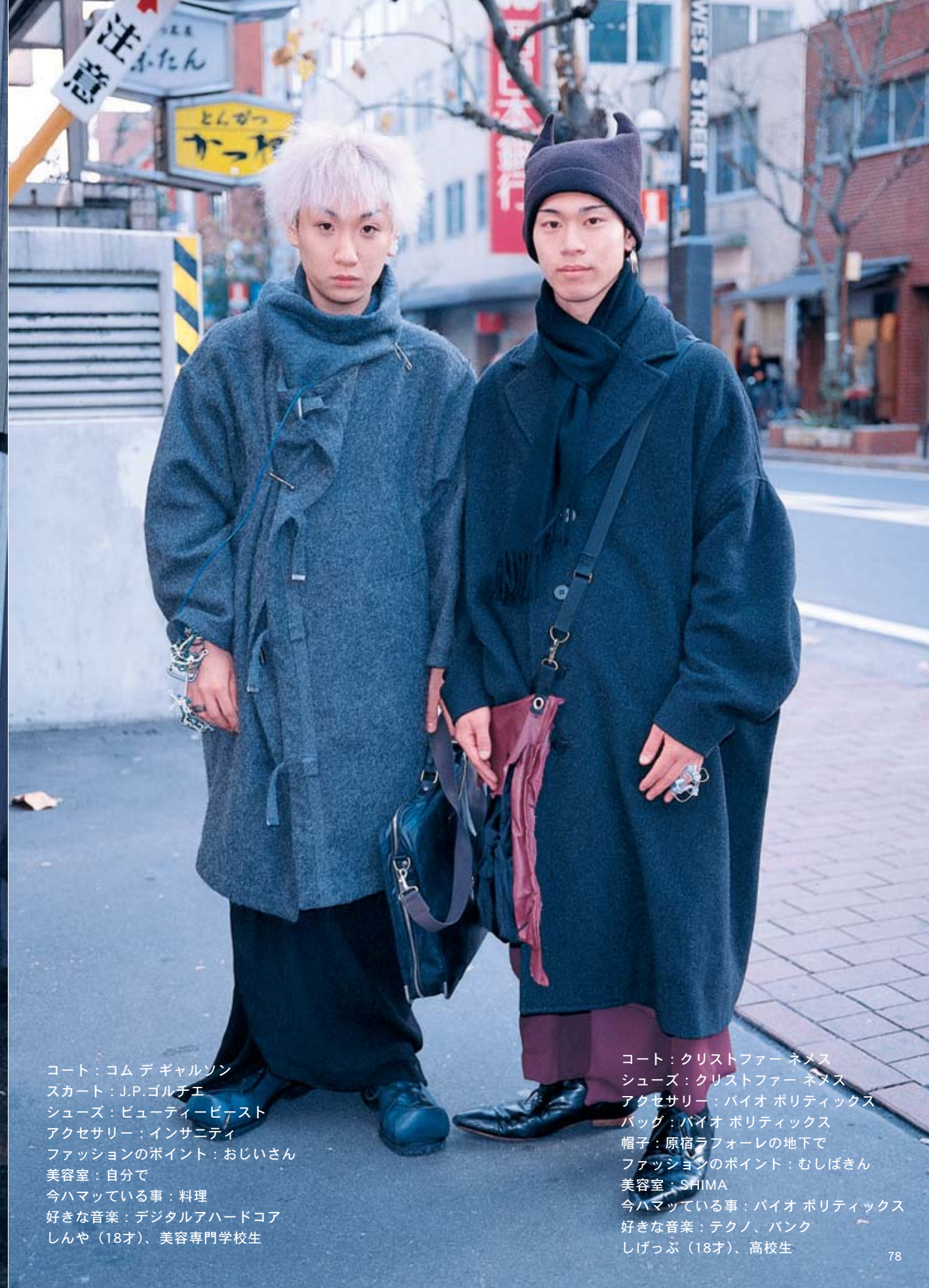
コート：コム デ ギャルソン スカート：J.P. ゴルチエ シューズ：ビューティービースト アクセサリー：インサニティ ファッションのポイント：おじいさん 美容室：自分で 今ハマっている事：料理 好きな音楽：デジタルアハードコア しんや（18才）、美容専門学校生