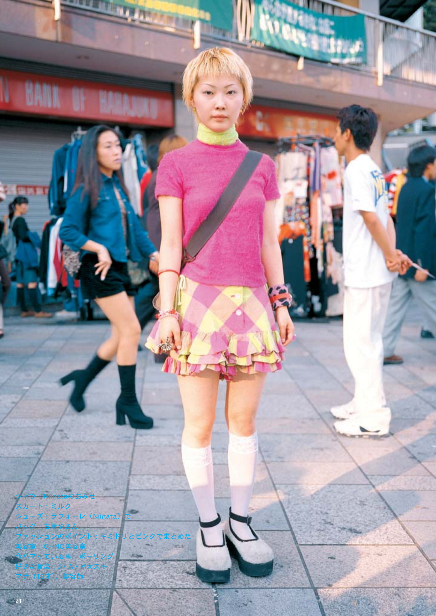
シャツ：Niigataのおみせ スカート：ミルク シューズ：ラフォーレ（Niigata）で バッグ：古着屋さん ファッションのポイント：キミドリとピンクでまとめた 美容室：OHNO美容室 今ハマっている事：ボーリング 好きな音楽：J・A・M大スキ マナ（19才）、美容師