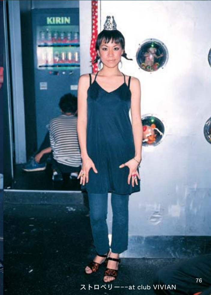
ストロベリー---at club VIVIAN