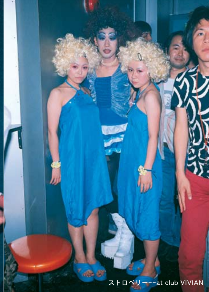
ストロベリー---at club VIVIAN