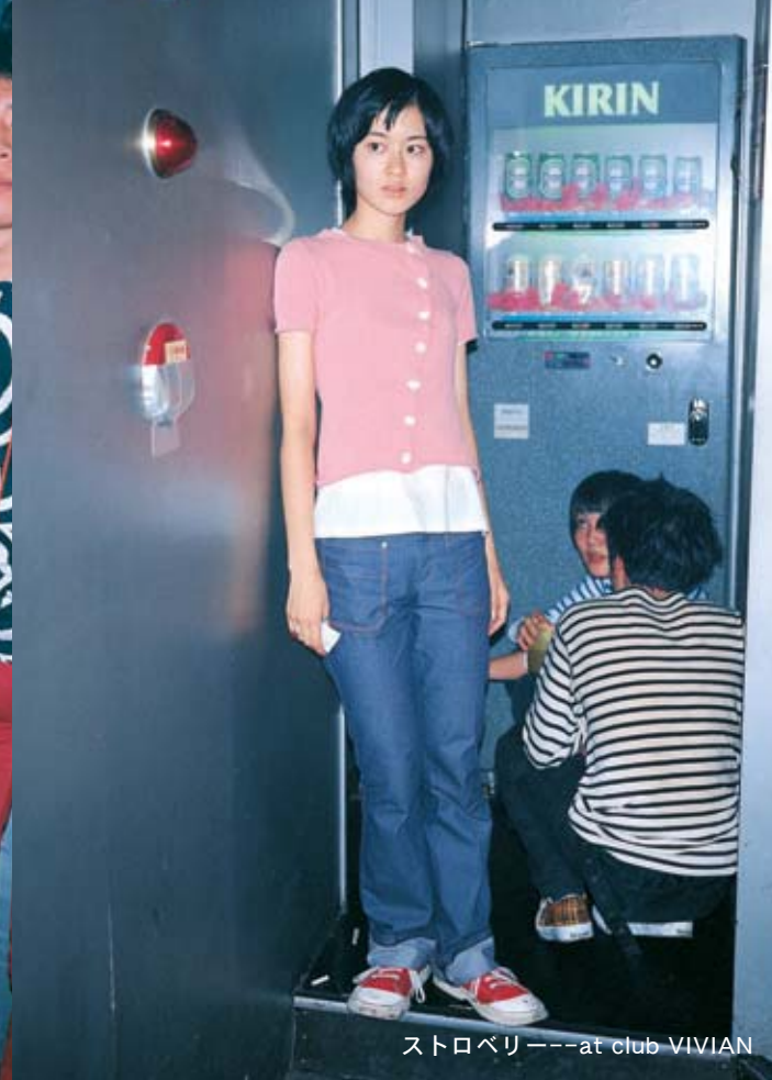
ストロベリー---at club VIVIAN