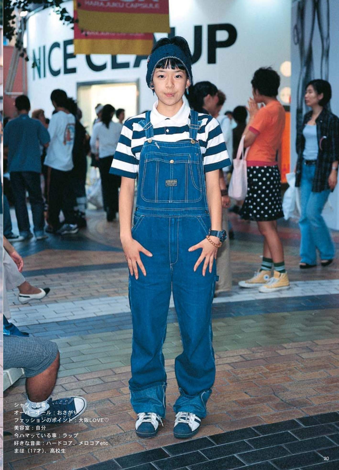
シャツ：古着 オーバーオール：おさがり ファッションのポイント：大阪LOVE♡ 美容室：自分 今ハマっている事：ラップ 好きな音楽：ハードコア、メロコアetc まほ（17才）、高校生