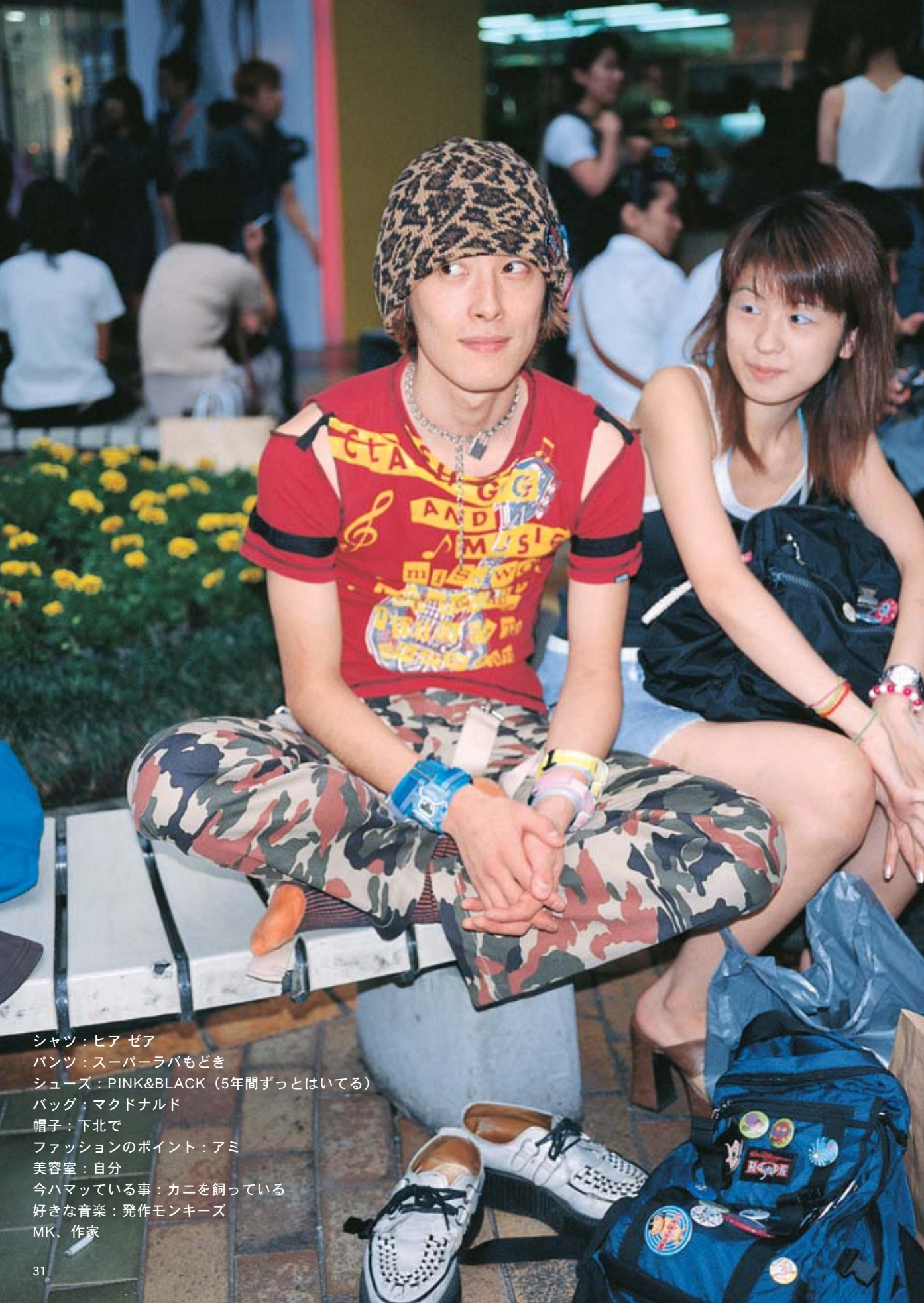
シャツ：ヒア ゼア パンツ：スーパーラバもどき シューズ：PINK&BLACK（5年間ずっとはいてる） バッグ：マクドナルド 帽子：下北で ファッションのポイント：アミ 美容室：自分 今ハマっている事：カニを飼っている 好きな音楽：発作モンキーズ MK、作家