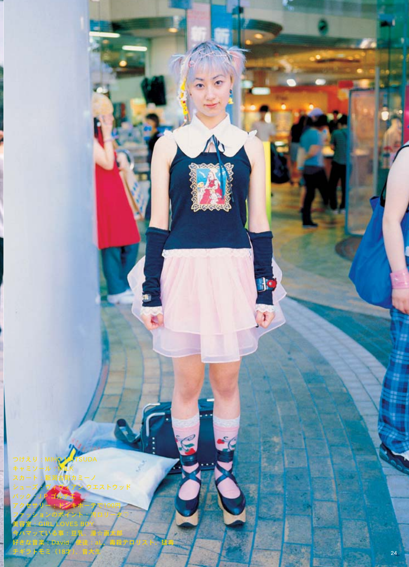
つけえり：MIHO MATSUDA キャミソール：MILK スカート：新潟古町カミーノ シューズ：ヴィヴィアン ウェストウッド バッグ：J.P. ゴルデエ アクセサリー：ドンキホーテで100円 ファッションのポイント：汚いリータワ 美容室：GIRL LOVES BOY 今ハマっている事：豆乳、漫画 面太郎 好きな音楽：David 使徒、al、島殺テロリスト、猛毒 チギラトモミ（18才）、盲大生