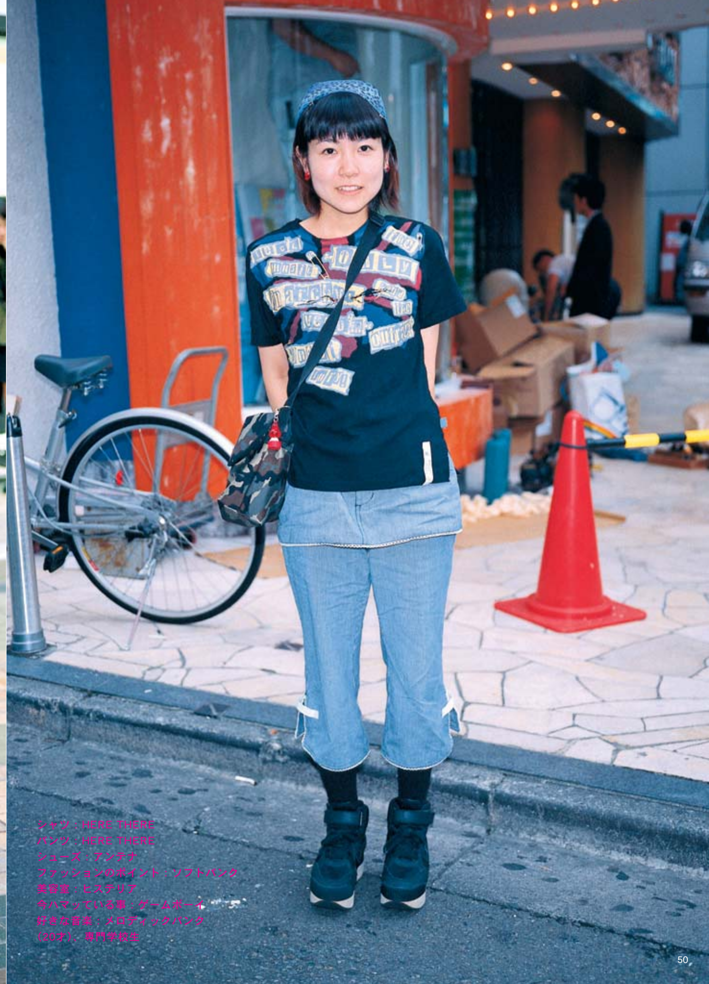
シャツ：HERE THERE パンツ：HERE THERE シューズ：アンテナ ファッションのポイント：ソフトバンク 美容室：ヒステリア 今ハマっている事：ゲームボーイ 好きな音楽：メロディックパンク （20才）、専門学校生