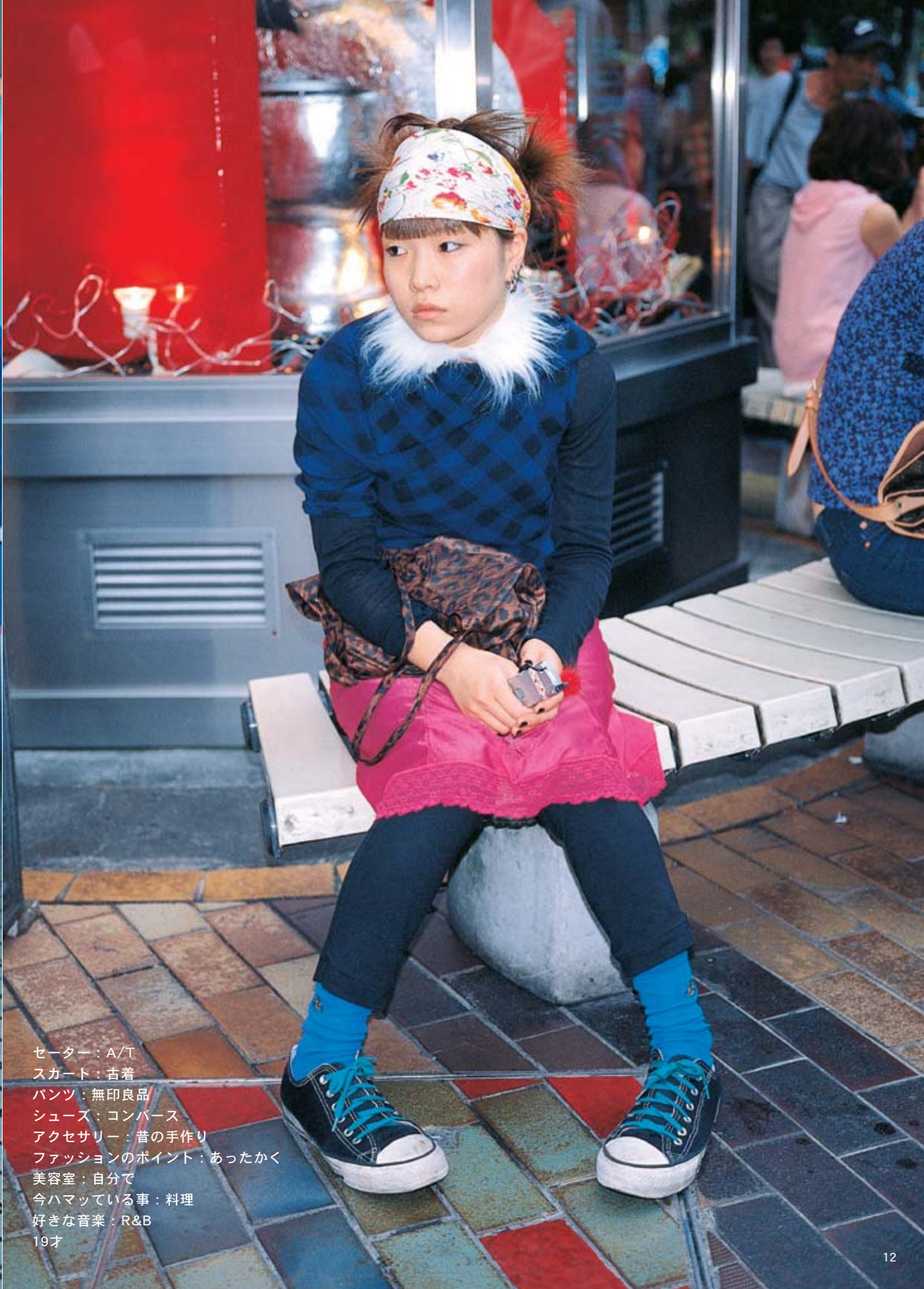
セーター：A/T スカート：古着 パンツ：無印良品 シューズ：コンバース アクセサリ：昔の手作り ファッションのポイント：あったかく 美容室：自分で 今ハマっている事：料理 好きな音楽：R&B 19才