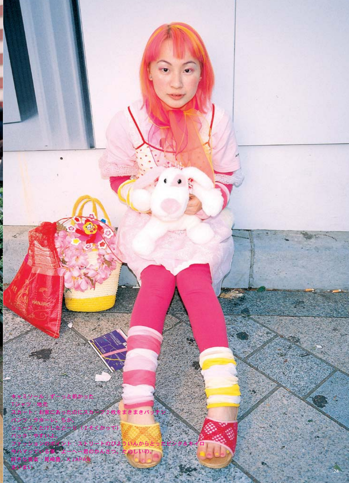
キャミソール：ずっと前から Tシャツ：地元 スカート：お家にあったのにスカート2枚をまきまきパッチン パンツ：ラホール。ちか シューズ：たけしたどー（2そくかっ） バック：やすいよ。 ファッションのポイント：ストリートの子ういんからとったピンタ&キイロ 今ハマっている事：よーへー君のかんざつ。たのしいの。 好きな音楽：尾崎豊、X JAPAN まいまい