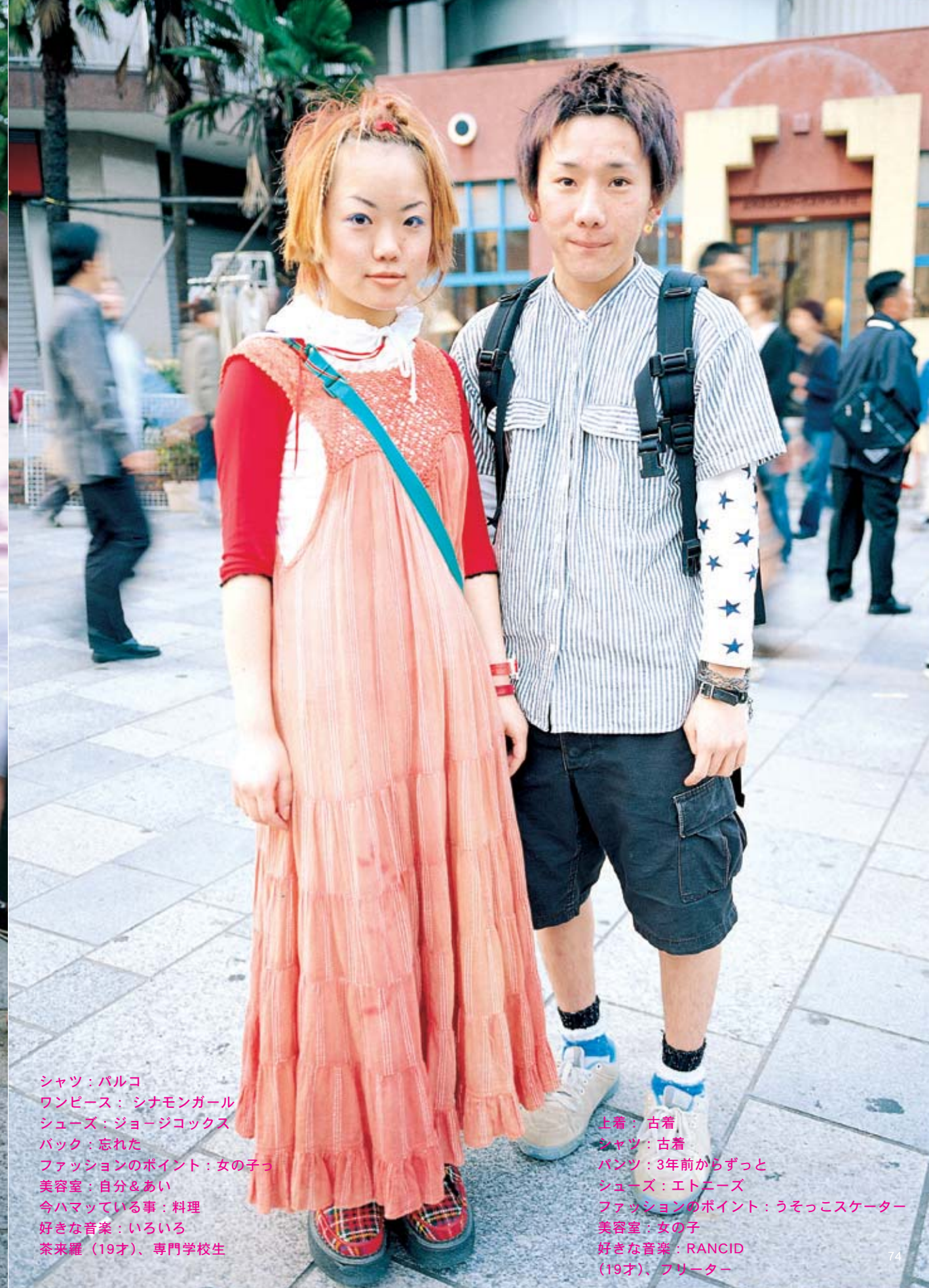
シャツ：バルコ ワンピース：シナモンガール シューズ：ジョージコックス バック：忘れた ファッションのポイント：女の子 美容室：自分&あい 今ハマっている事：料理 好きな音楽：いろいろ 茶来羅（19才）、専門学校生