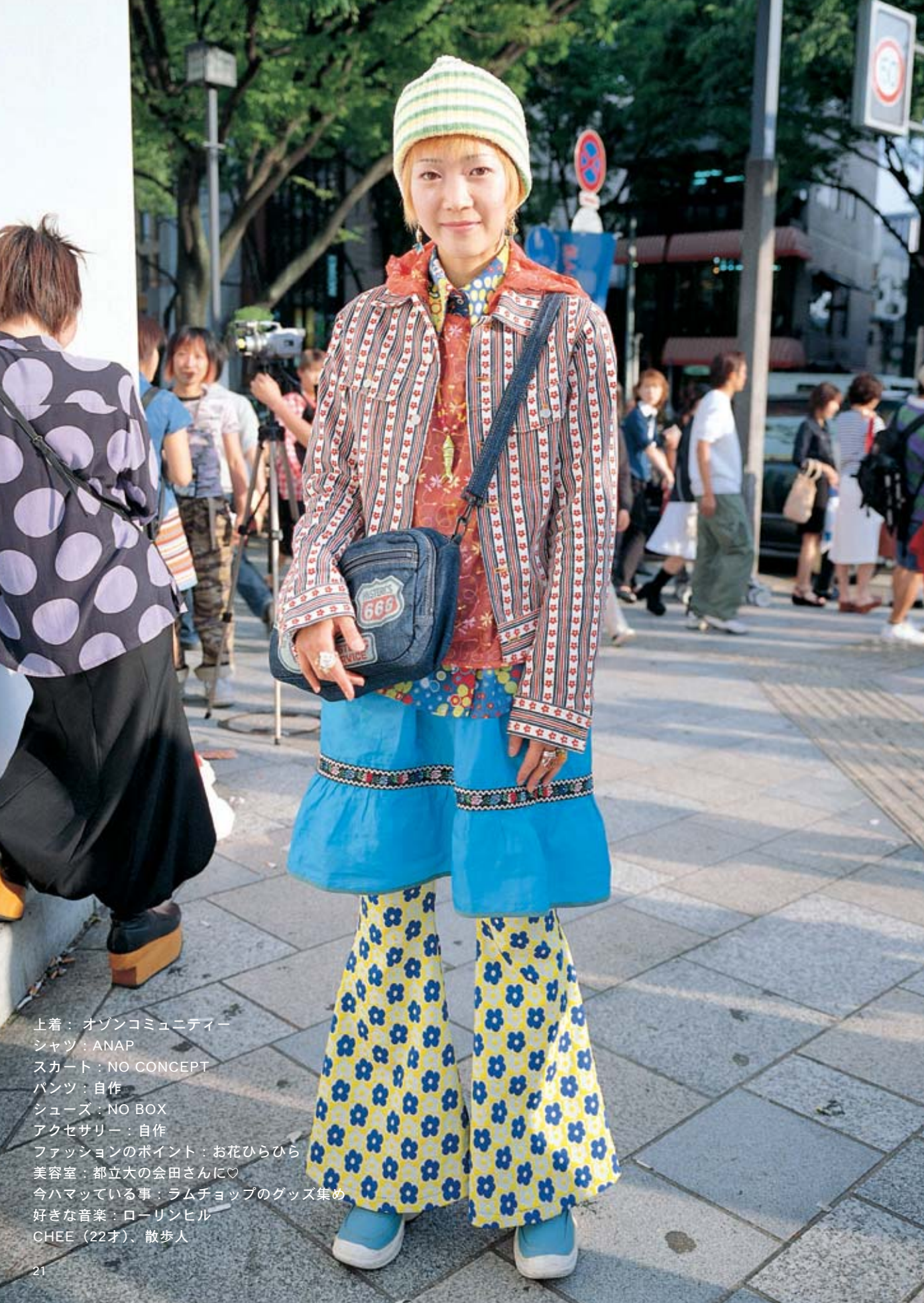
上着：オゾンコミュニティー シャツ：ANAP スカート：NO CONCEPT パンツ：自作 シューズ：NO BOX アクセサリー：自作 ファッションのポイント：お花ひらひら 美容室：都立大の会田さんに♡ 今ハマっている事：ラムチョップのグッズ集め 好きな音楽：ローリンヒル CHEE（22才）、散歩人