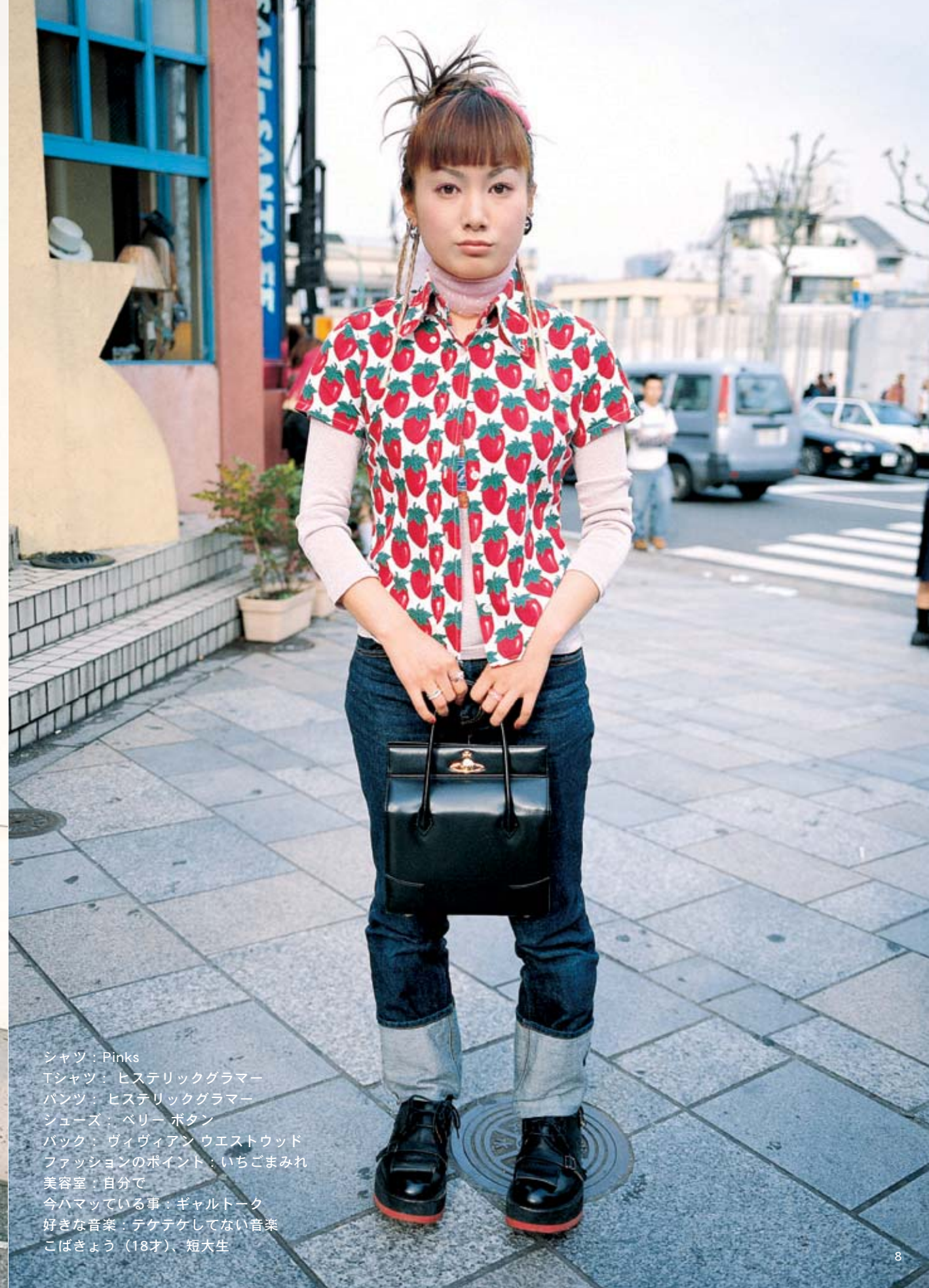
シャツ：Pinks Tシャツ：ヒステリックグラマー パンツ：ヒステリックグラマー シューズ：ベリー ボタン バック：ヴィヴィアン ウェストウッド ファッションのポイント：いちごまみれ 美容室：自分で 今ハマっている事：ギャルトーク 好きな音楽：テケテケしてない音楽 こばきょう（18才）、短大生