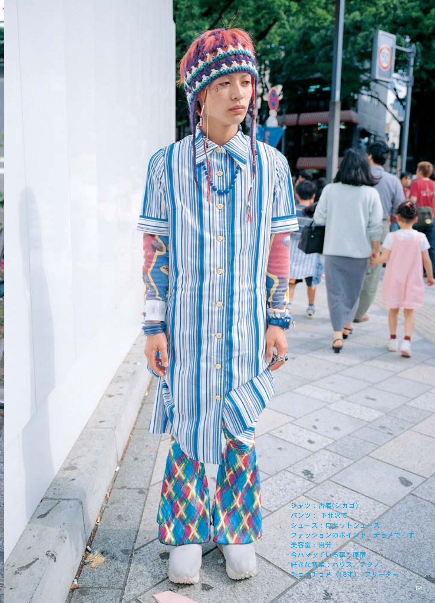
シャツ：古着(シカゴ) パンツ：下北沢で シューズ：ロケットシューズ ファッションのポイント：チョメでーす 美容室：自分 今ハマっている事：原宿 好きな音楽：ハウス、テクノ チョメチョメ (18才)、フリーター