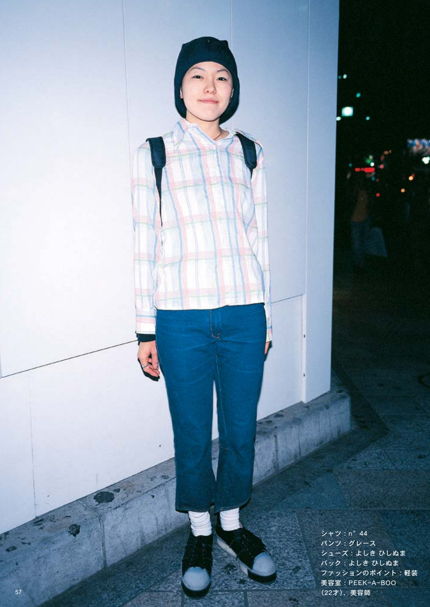
シャツ：n° 44 パンツ：グレース シューズ：よしき ひしめま バック：よしき ひしめま ファッションのポイント：軽装 美容室：PEEK-A-BOO (22才)、美容師