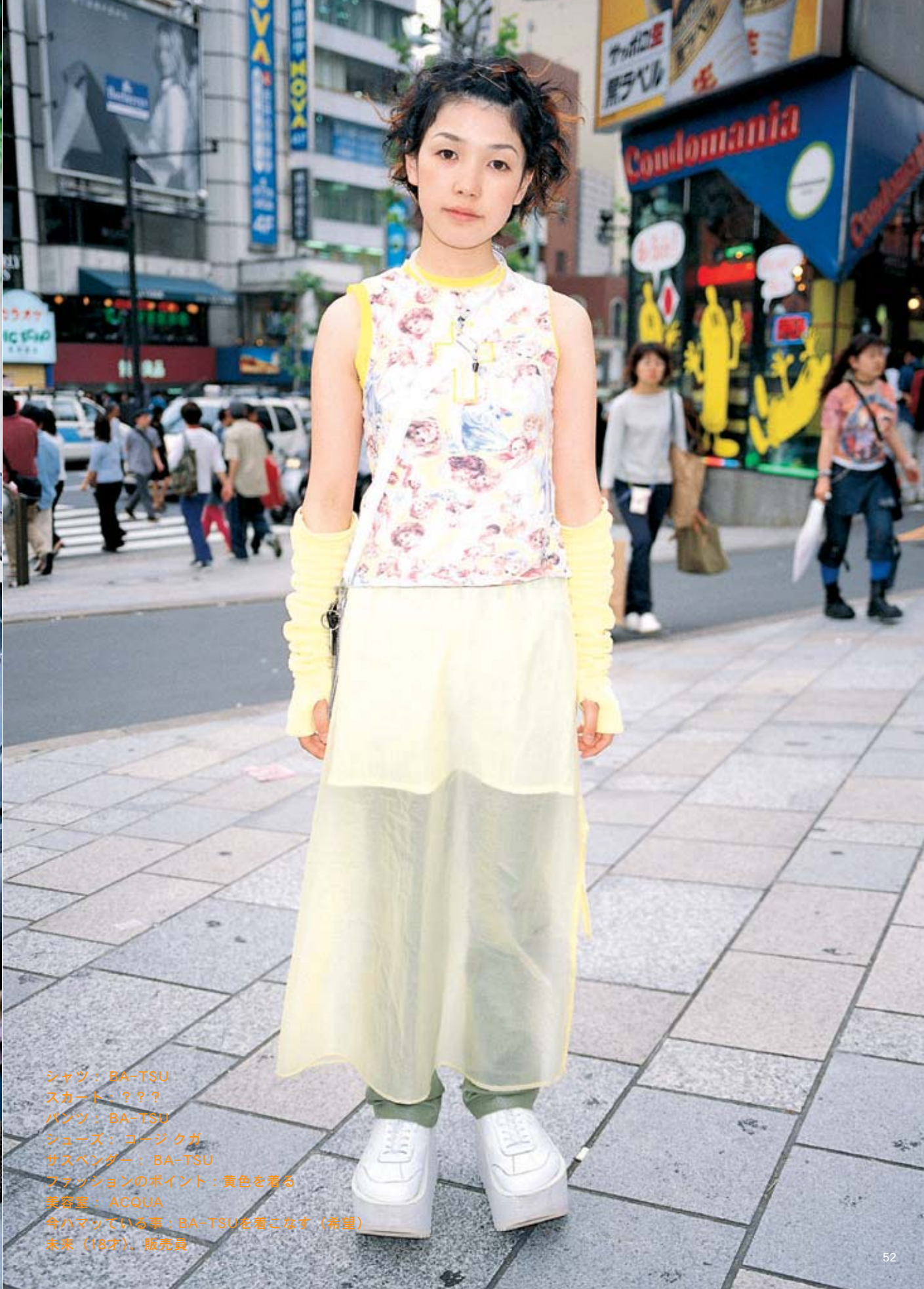
シャツ：BA-TSU スカート：？？？ パンツ：BA-TSU シューズ：コージクガ サスペンダー：BA-TSU ファッションのポイント：黄色を着る 美容室：ACQUA 今ハマっている事：BA-TSUを着こなす（希望） 未来（18才）、販売員