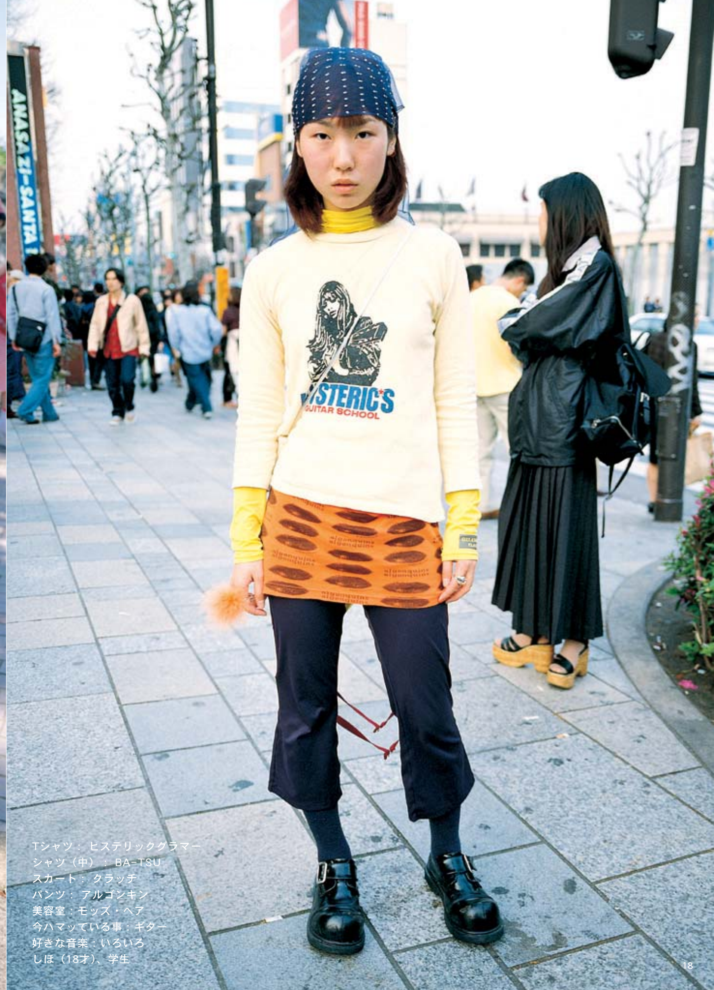
Tシャツ：ヒステリックグラマー シャツ（中）：BA-TSU スカート：クラッチ パンツ：アルゴンキン 美容室：モッズ・ヘア 今ハマっている事：ギター 好きな音楽：いろいろ しほ（18才）、学生