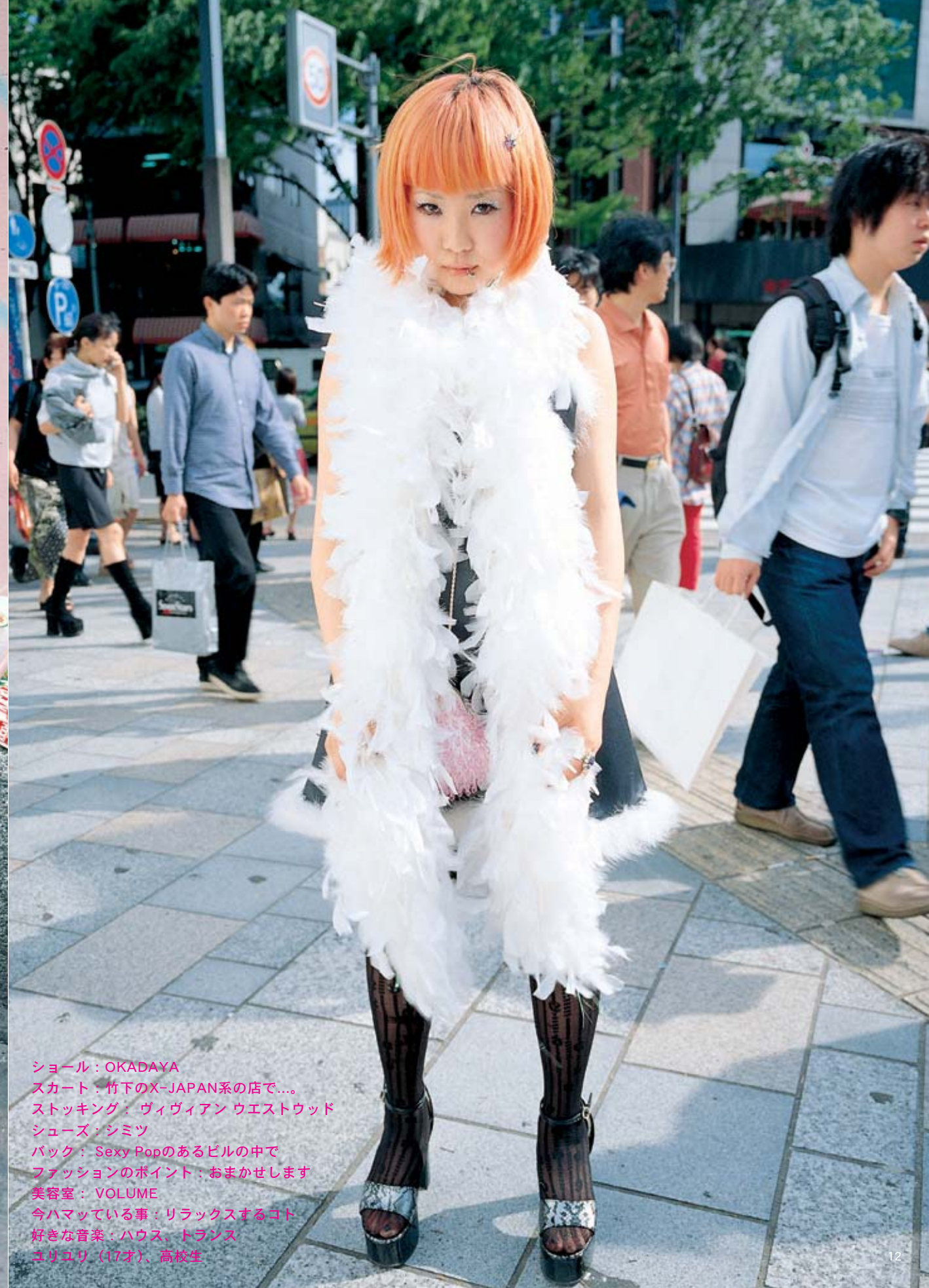
ショール：OKADAYA スカート：竹下のX-JAPAN系の店で... ストッキング：ヴィヴィアン ウェストウッド シューズ：シミツ バック：Sexy Popのあるビルの中で ファッションのポイント：おまかせします 美容室：VOLUME 今ハマっている事：リラックスするコト 好きな音楽：ハウス、トランス コリコリ（17才）、高校生