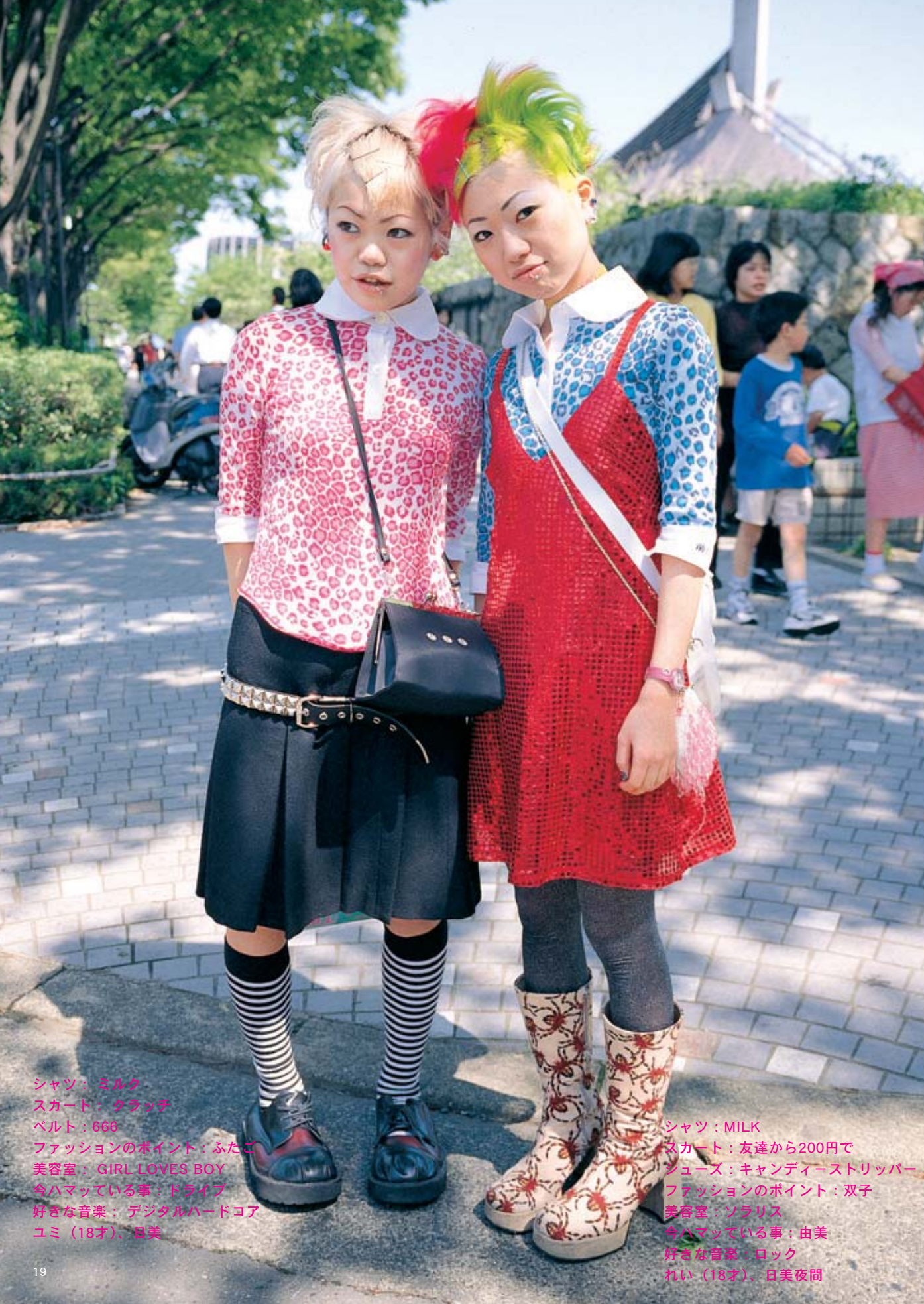
シャツ：ミルク スカート：クラッチ ベルト：666 ファッションのポイント：ふたご 美容室：GIRL LOVES BOY 今ハマっている事：ドライブ 好きな音楽：デジタルハードコア ユミ（18才）、日美