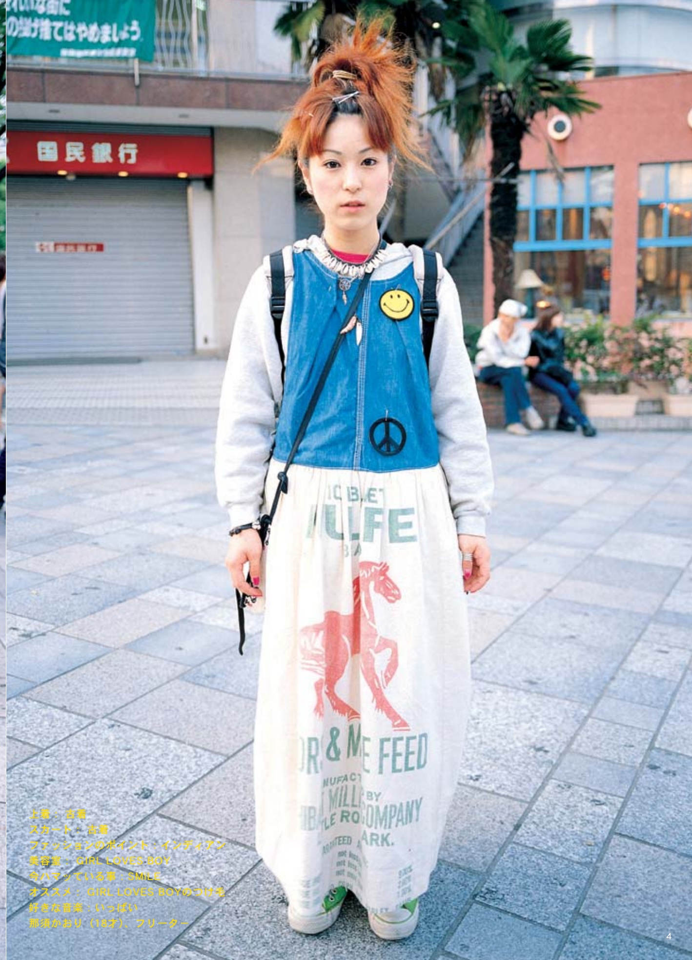
上着：吉着 スカート：吉着 ファッションのポイント：インディアン 美容室：GIRL LOVES BOY 今ハマっている事：SMILE オススメ：GIRL LOVES BOYのつげ宅 好きな音楽：いっぱい 麗道がおり（18才）、フリーター