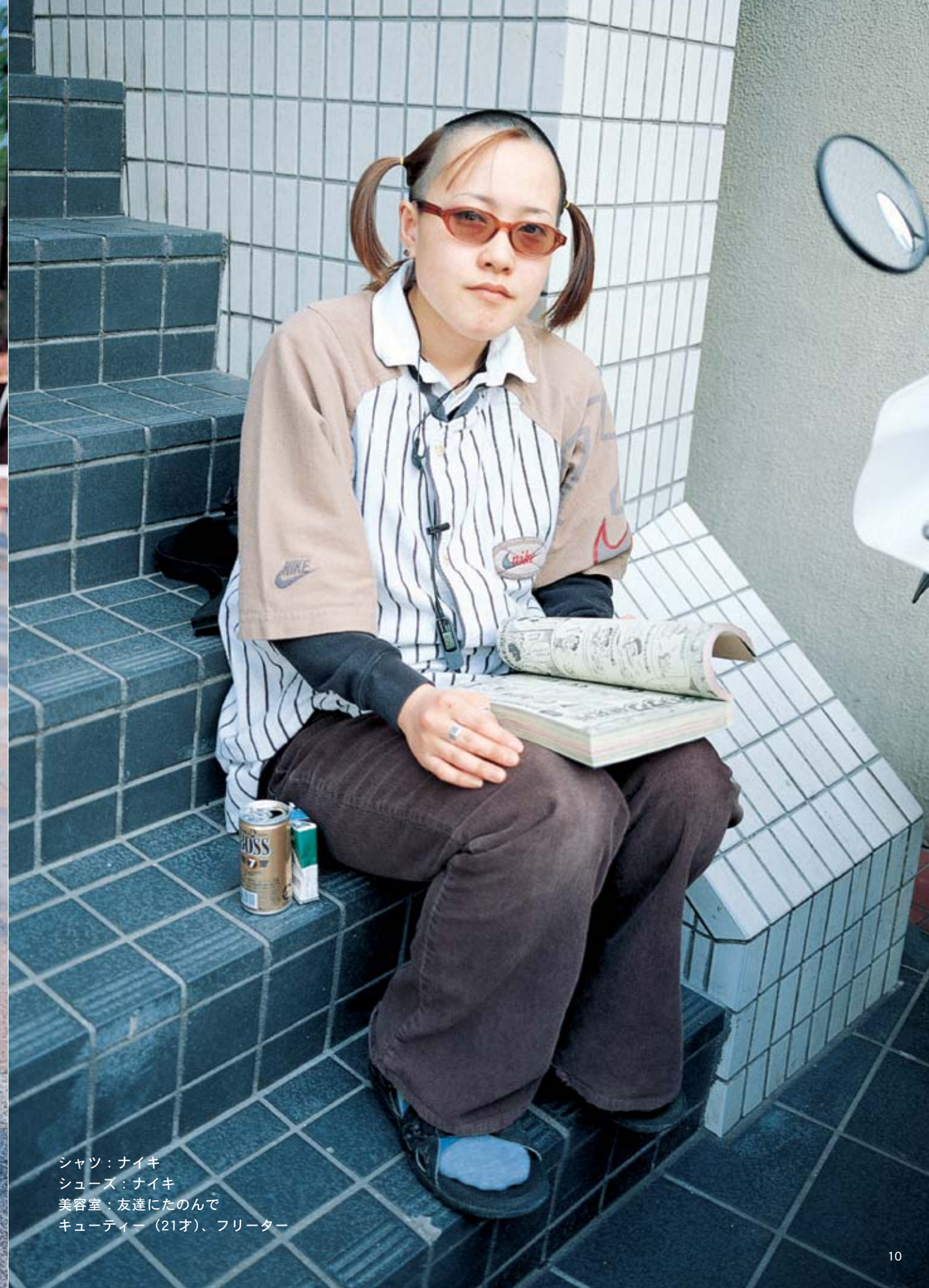
シャツ：ナイキ シューズ：ナイキ 美容室：友達にたのんで キューティー（21才）、フリーター