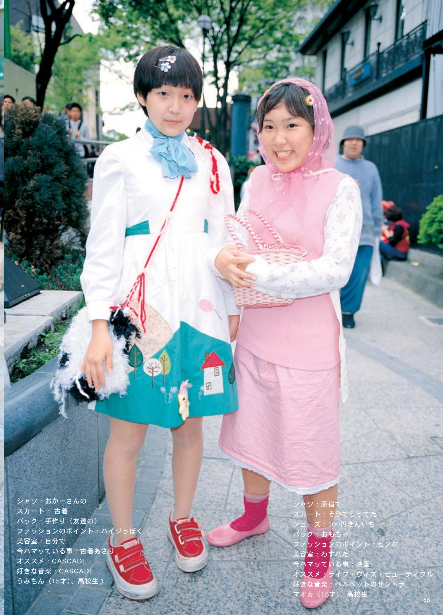
シャツ：おかーさんの スカート：古着 バック：手作り（友達の） ファッションのポイント：ハイジっぽく 美容室：自分で 今ハマっている事：古着あさり オススメ：CASCADE 好きな音楽：CASCADE うみちん（15才）、高校生1