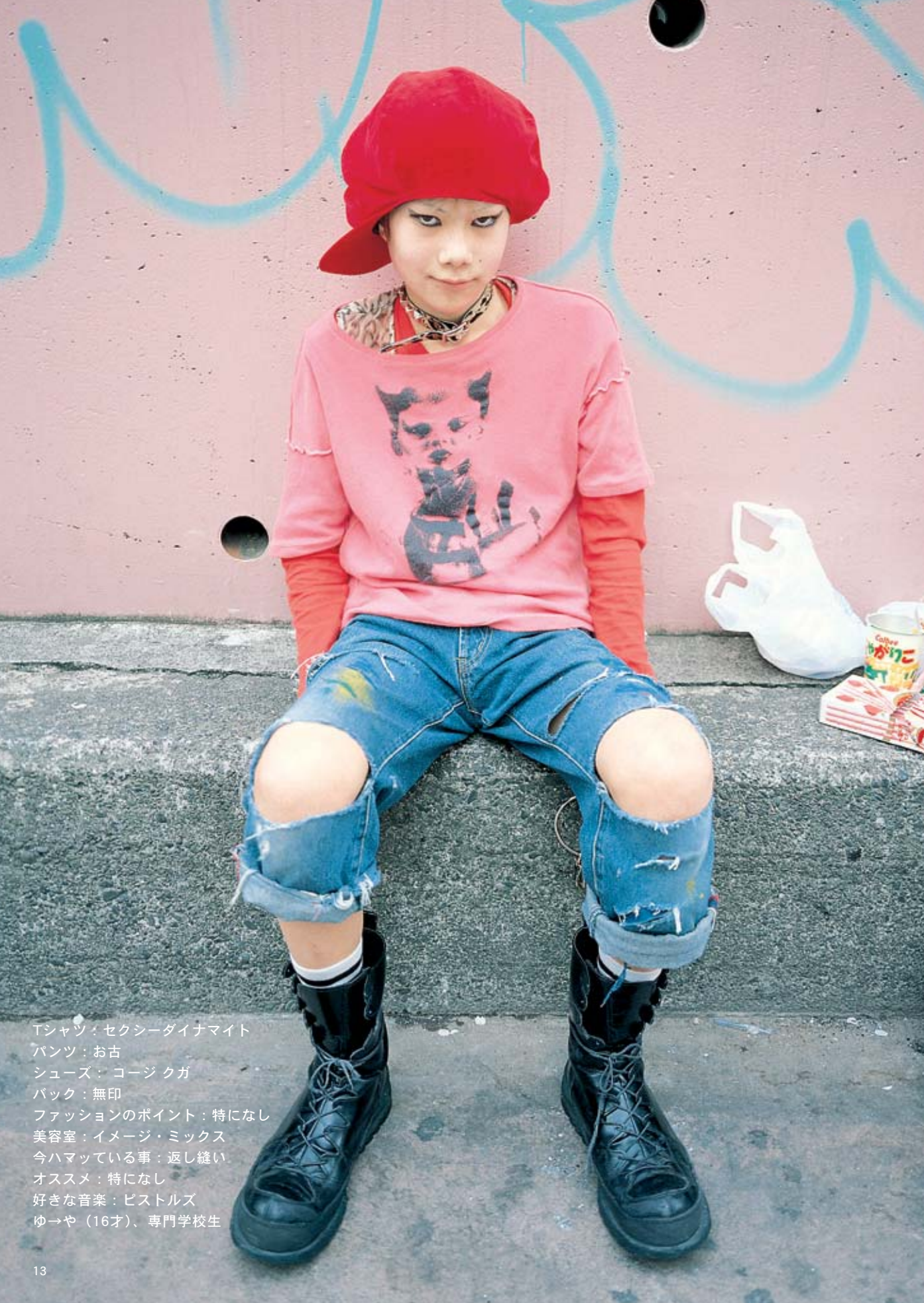
Tシャツ：セクシーダイナマイト パンツ：お古 シューズ：コージクガ バック：無印 ファッションのポイント：特になし 美容室：イメージ・ミックス 今ハマっている事：返し縫い オススメ：特になし 好きな音楽：ピストルズ ゆ→や（16才）、専門学校生