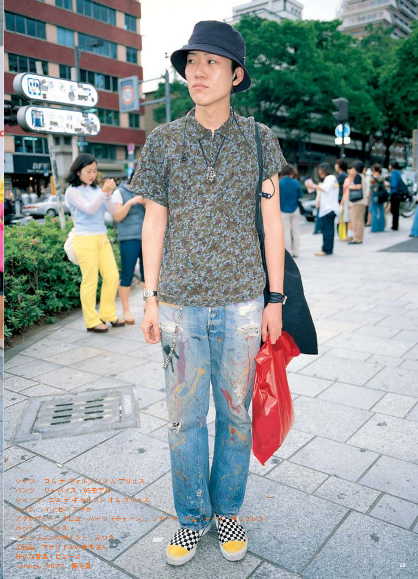
シャツ：コム デ ギャルソン オム プリュス パンツ：リーバイス・66モデル シューズ：コム デ ギャルソン オム プリュス バッグ：イッセイ ミヤケ アクセサリー：クロム・ハーツ（チェーン）、レナード・ガムフォード（ネックレス） ハット：エルメス ファッションのポイント：ふつう 美容室：マテリアルの赤木さん 好きな音楽：ビョーク Tomoya（20才）、販売員