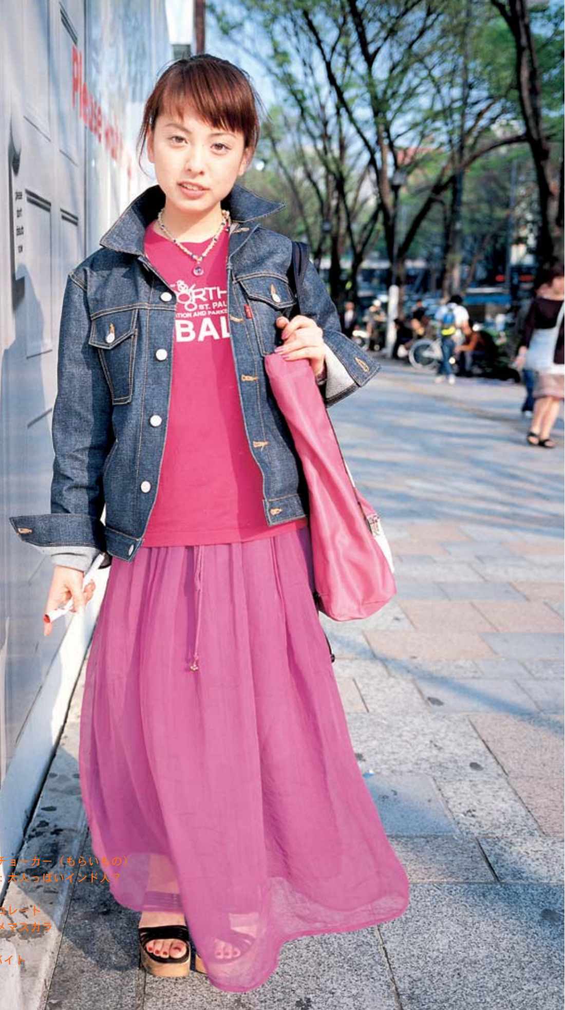
上着：X girl Tシャツ：古着 スカート：古着 シューズ：モードカオリ アクセサリー：ヘンプのチョーカー（もらいもの） ファッションのポイント：太っぴいインド人？ 美容室：369 今ハマっている事：チョコレート オススメ：アナスイのラメマスカラ 好きな音楽：ハウス ゆきん子（19才）、アルバイト