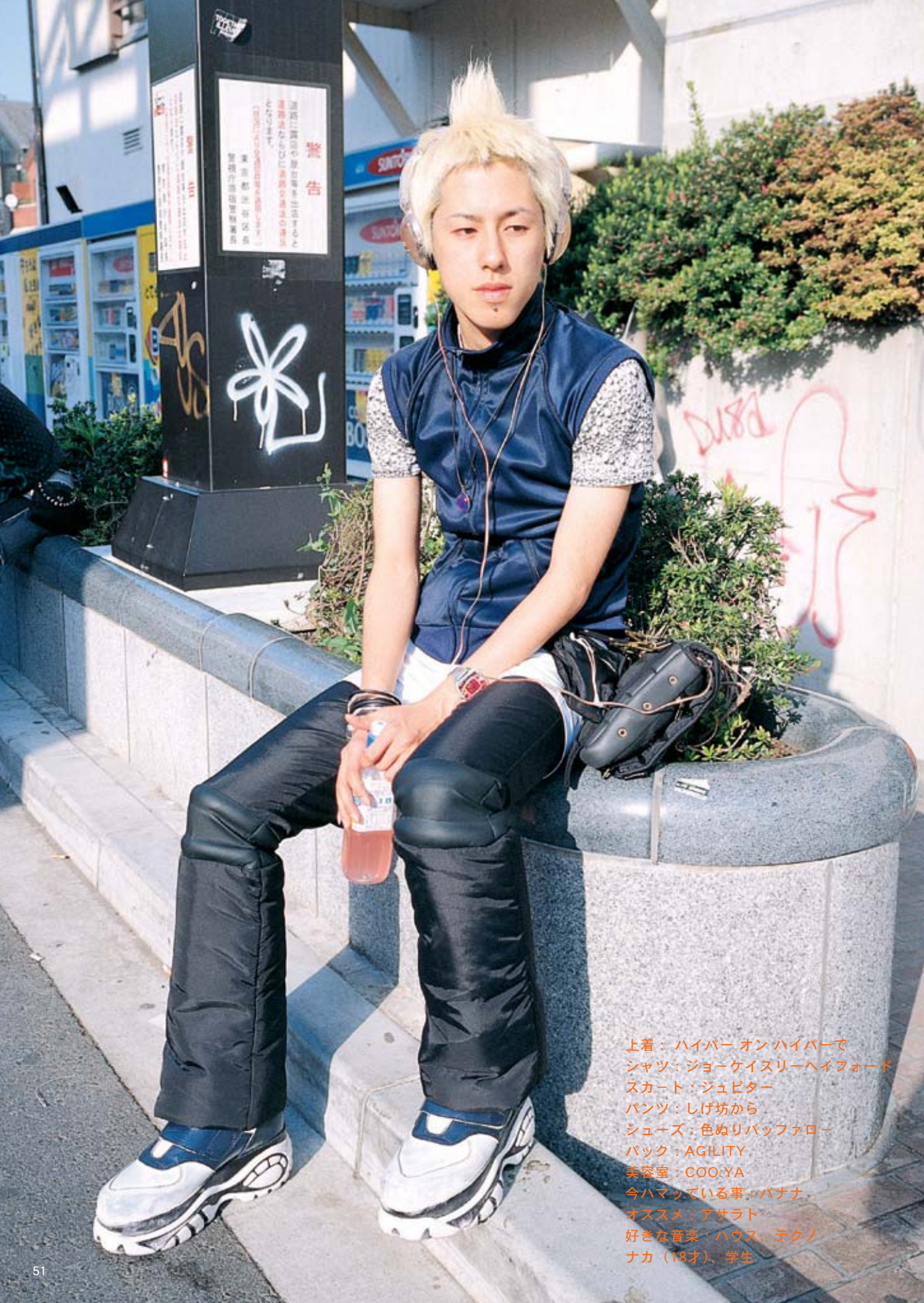
上着：ハイパー オン ハイパーで シャツ：ジョーゲイスリーヘイフォード スカート：ジュビター パンツ：しげ坊から シューズ：色ぬりパッファロー バック：AGILITY 美容室：COO.YA 今ハマっている事：バナナ オススメ：アサルト 好きな音楽：ハウス、テクノ ナカ（18才）、学生