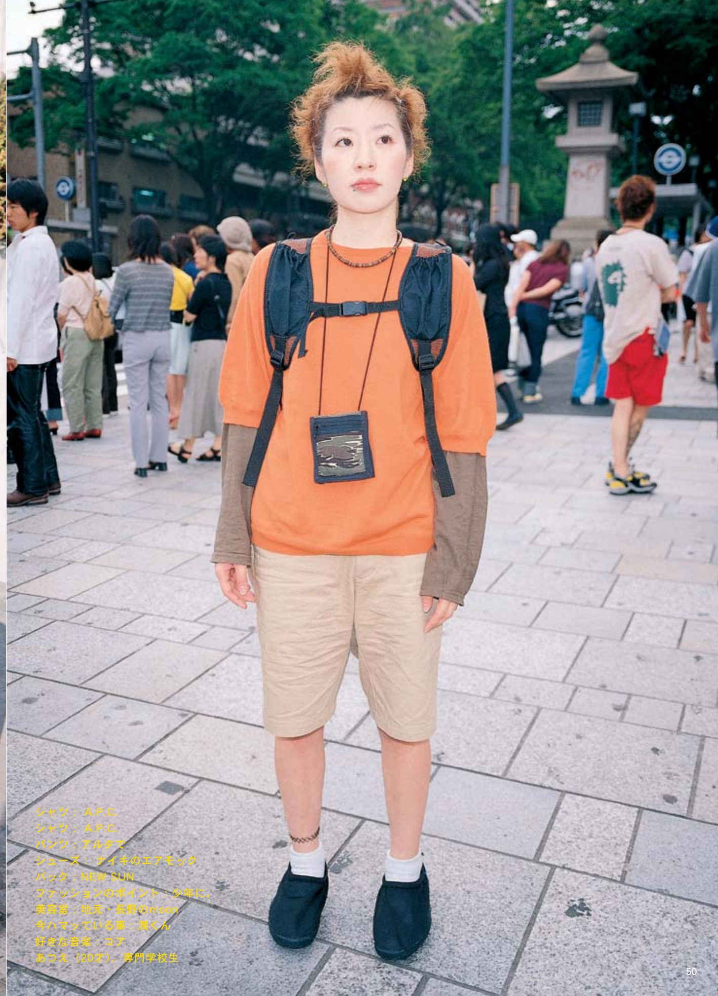
シャツ：A.P.C. シャツ：A.P.C. パンツ：アルタ シューズ：オイキのエアモック バック：NEW SUN ファッションのポイント：少年に 美容室：地元・長野のmoon 今ハマっている事：遊くん 好きな音楽：コア あこえ（20才）、専門学校生