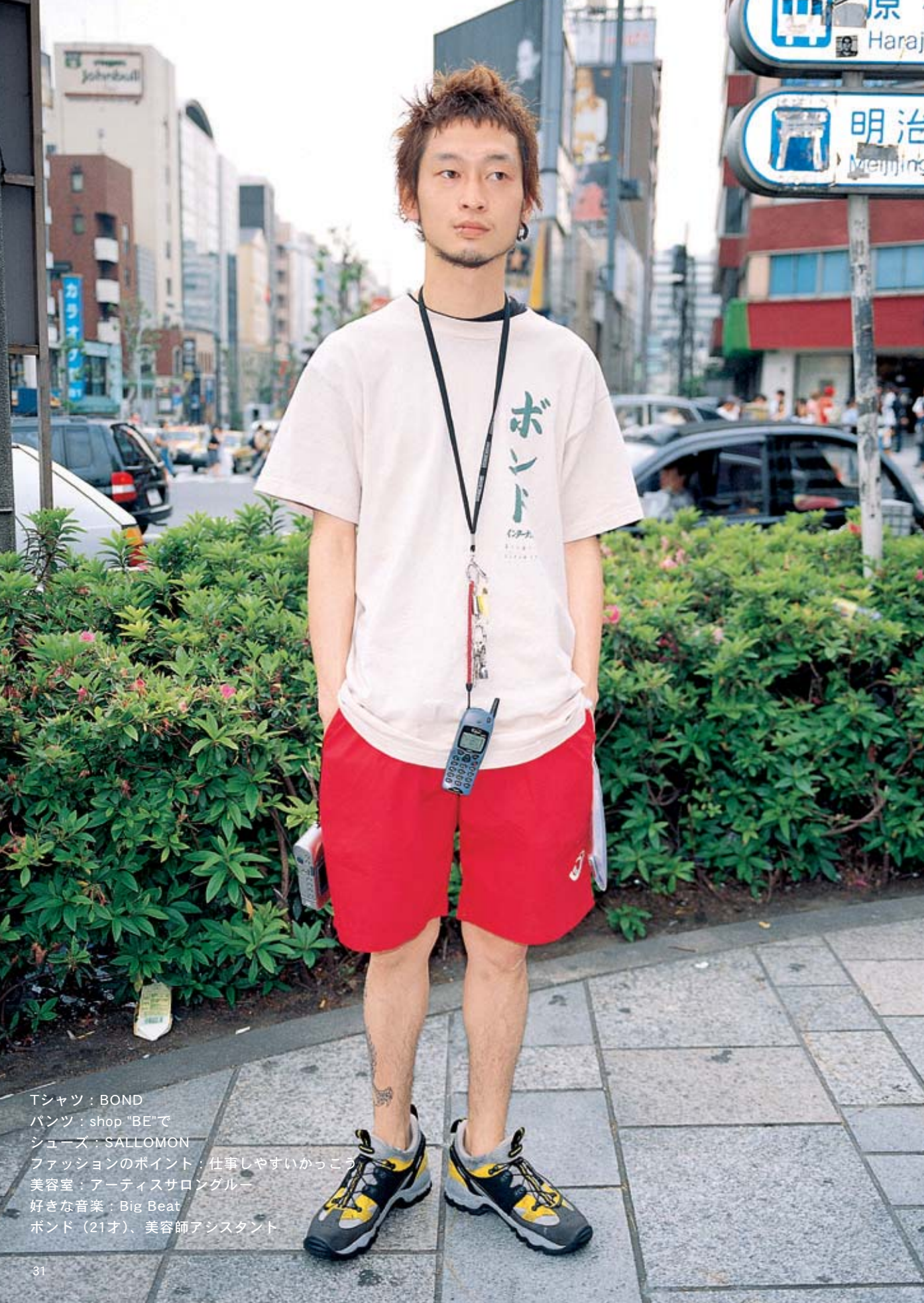
Tシャツ：BOND パンツ：shop "BE"で シューズ：SALLOMON ファッションのポイント：仕事しやすいからこ 美容室：アーティストサロングル 好きな音楽：Big Beat ボンド（21才）、美容師アシスタント