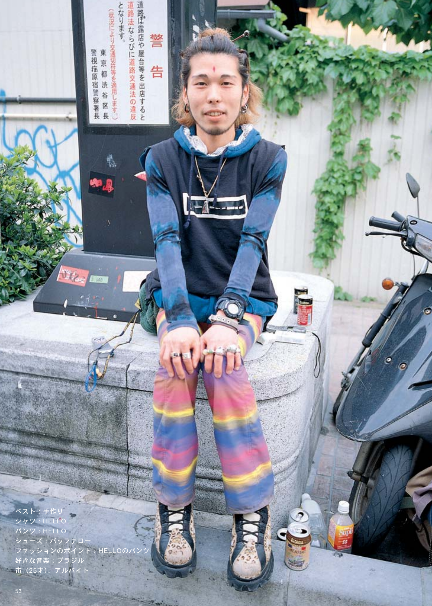
ベスト：手作り シャツ：HELLO パンツ：HELLO シューズ：パッファロー ファッションのポイント：HELLOのパンツ 好きな音楽：ブラジル 市（25才）、アルバイト