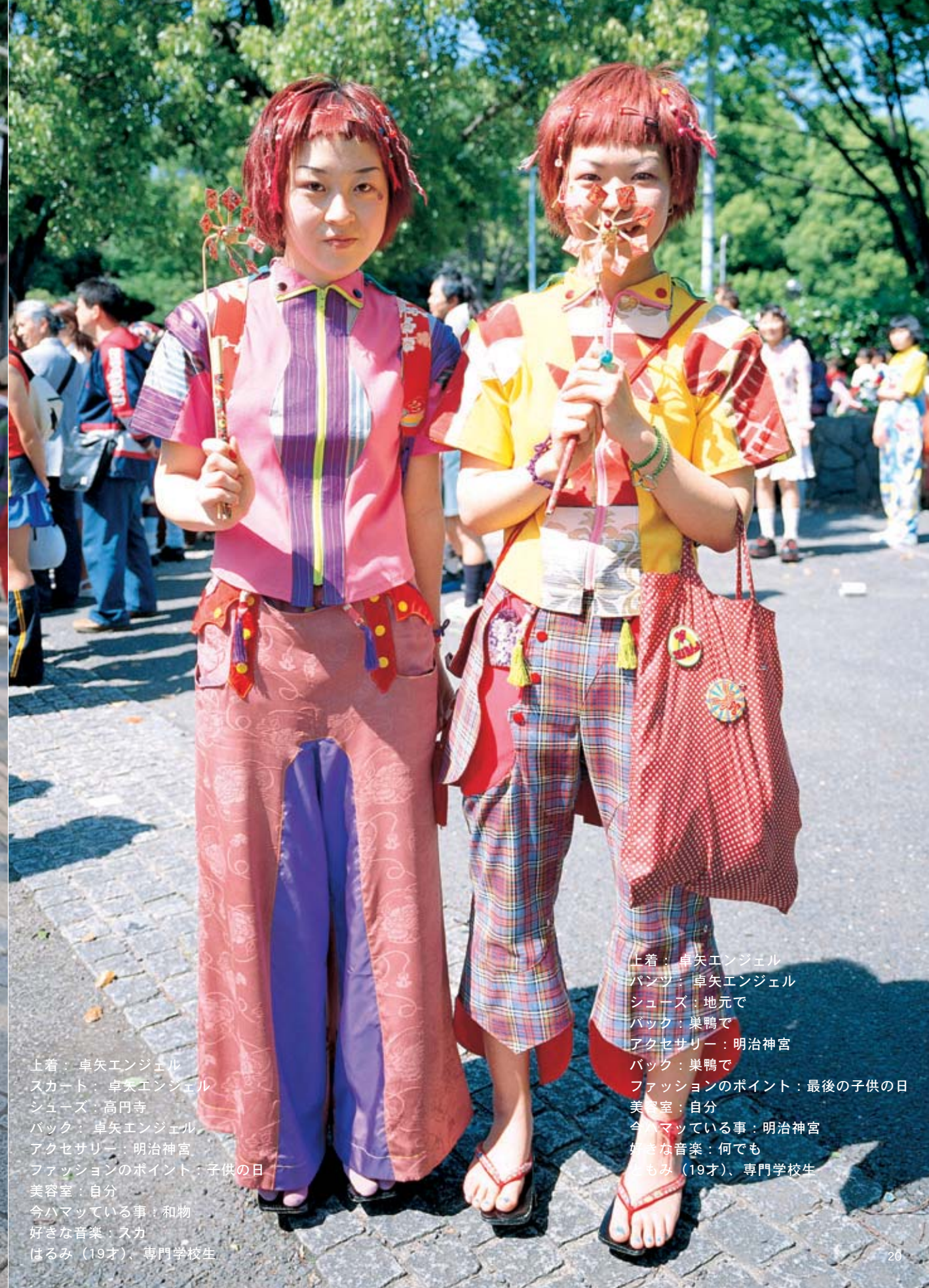
上着：卓矢エンジェル スカート：卓矢エンジェル シューズ：高円寺 バック：卓矢エンジェル アクセサリー：明治神宮 ファッションのポイント：子供の日 美容室：自分 今ハマっている事：和物 好きな音楽：スカ はるみ（19才）、専門学校生