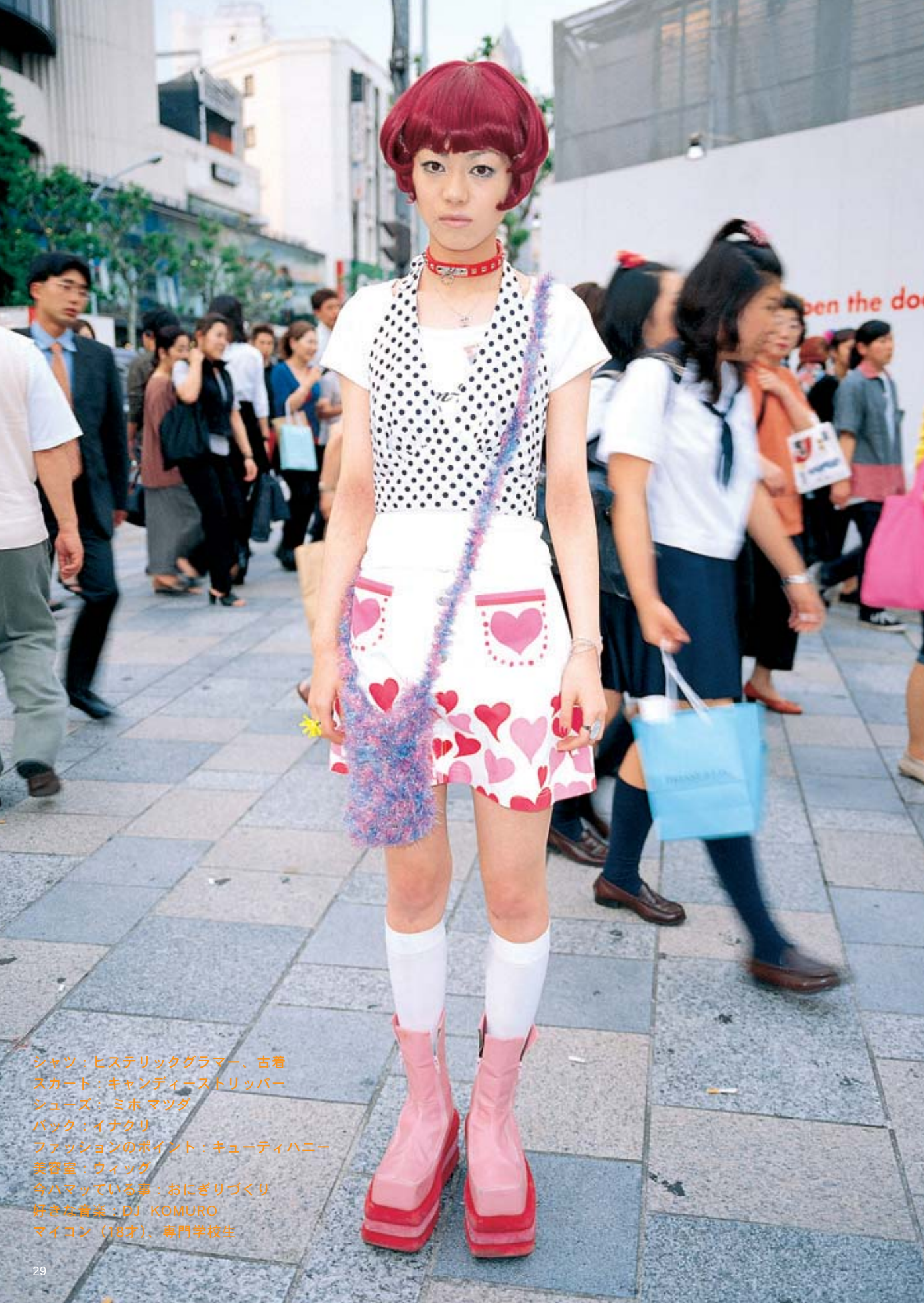
シャツ：ヒステリックグラマー、古着 スカート：キャンディーストリッパー シューズ：ミホ マツダ バッグ：イナクリ ファッションのポイント：キューティハニー 美容室：ウィッグ 今ハマっている事：おにぎりづくり 好きな音楽：DJ KOMURO マイコン（18才）、専門学校生