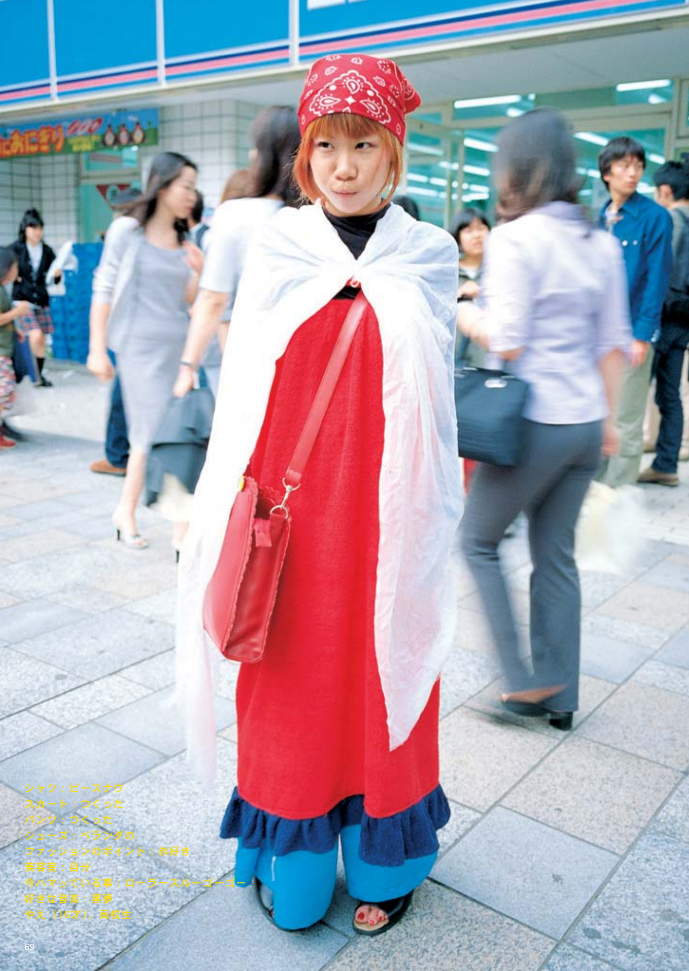
シャツ：ピースナウ スカート：つくった パンツ：つくった シューズ：ペランダの ファッションのポイント：赤好き 美容室：自分 今ハマっている事：ローラースルーゴーゴー 好きな音楽：黒夢 やえ（16才）、高校生