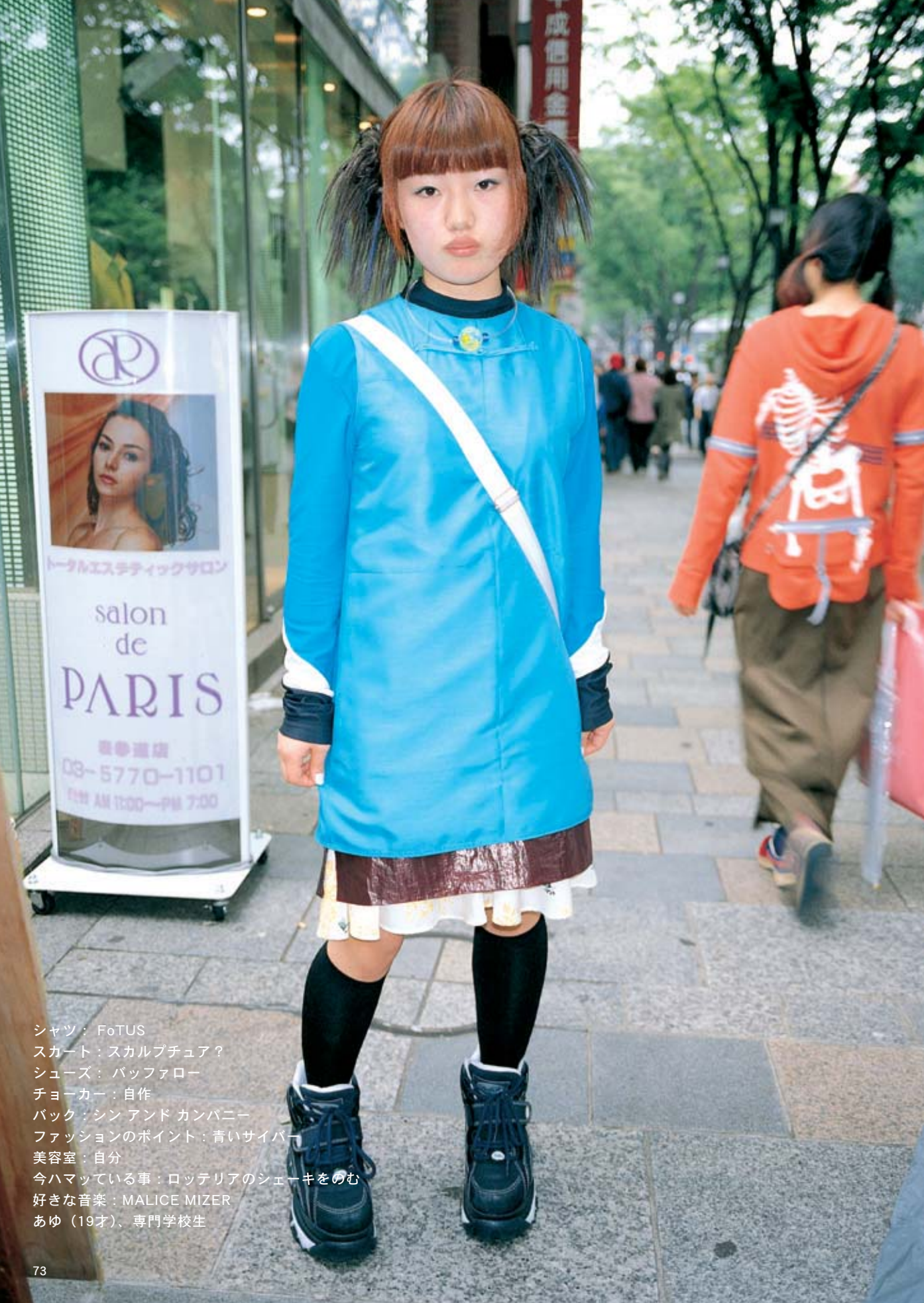
シャツ：FoTUS スカート：スカルプチュア？ シューズ：バツファロー チョーカー：自作 バック：シン アンド カンパニー ファッションのポイント：青いサイバー 美容室：自分 今ハマっている事：ロッテリアのシェーキをのむ 好きな音楽：MALICE MIZER あゆ（19才）、専門学校生