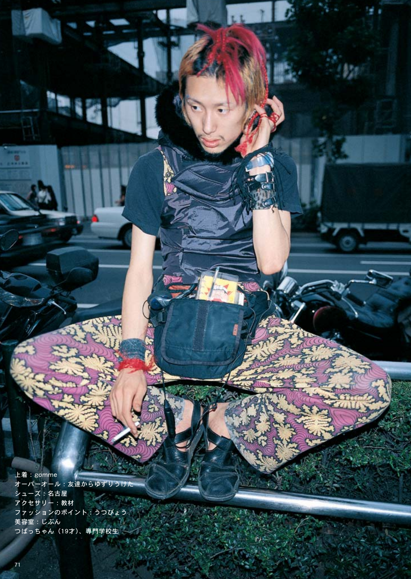
上着：gomme オーバーオール：友達からゆずりうけた シューズ：名古屋 アクセサリー：教材 ファッションのポイント：うつびょう 美容室：じぶん つばっちゃん（19才）、専門学校生