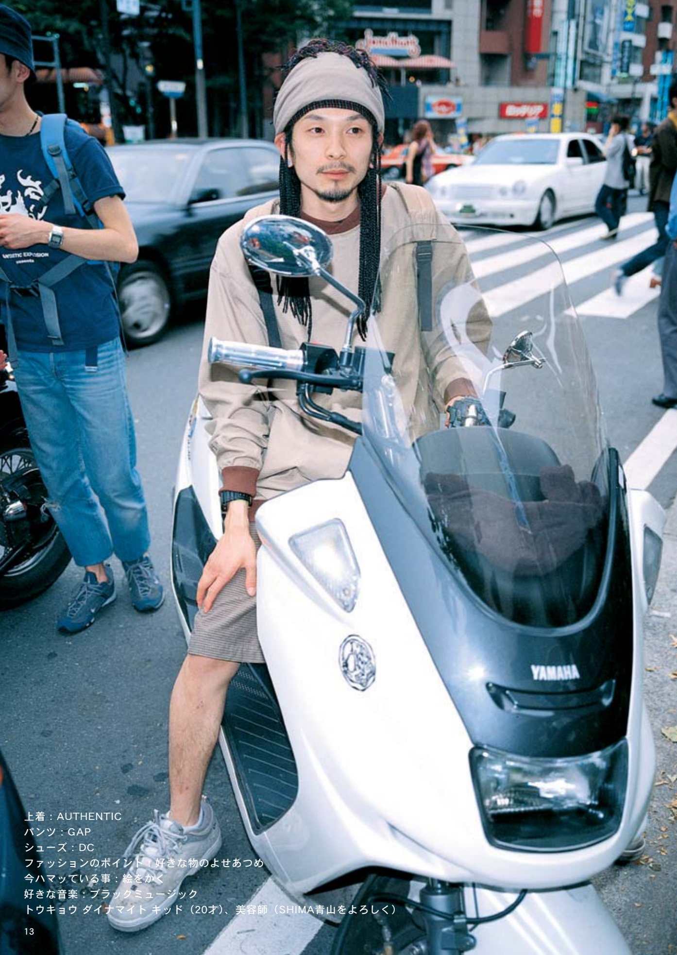
上着：AUTHENTIC パンツ：GAP シューズ：DC ファッションのポイント：好きな物のよせあつめ 今ハマっている事：絵をかく 好きな音楽：ブラックミュージック トウキョウ ダイナマイト キッド（20才）、美容師（SHIMA青山をよろしく）