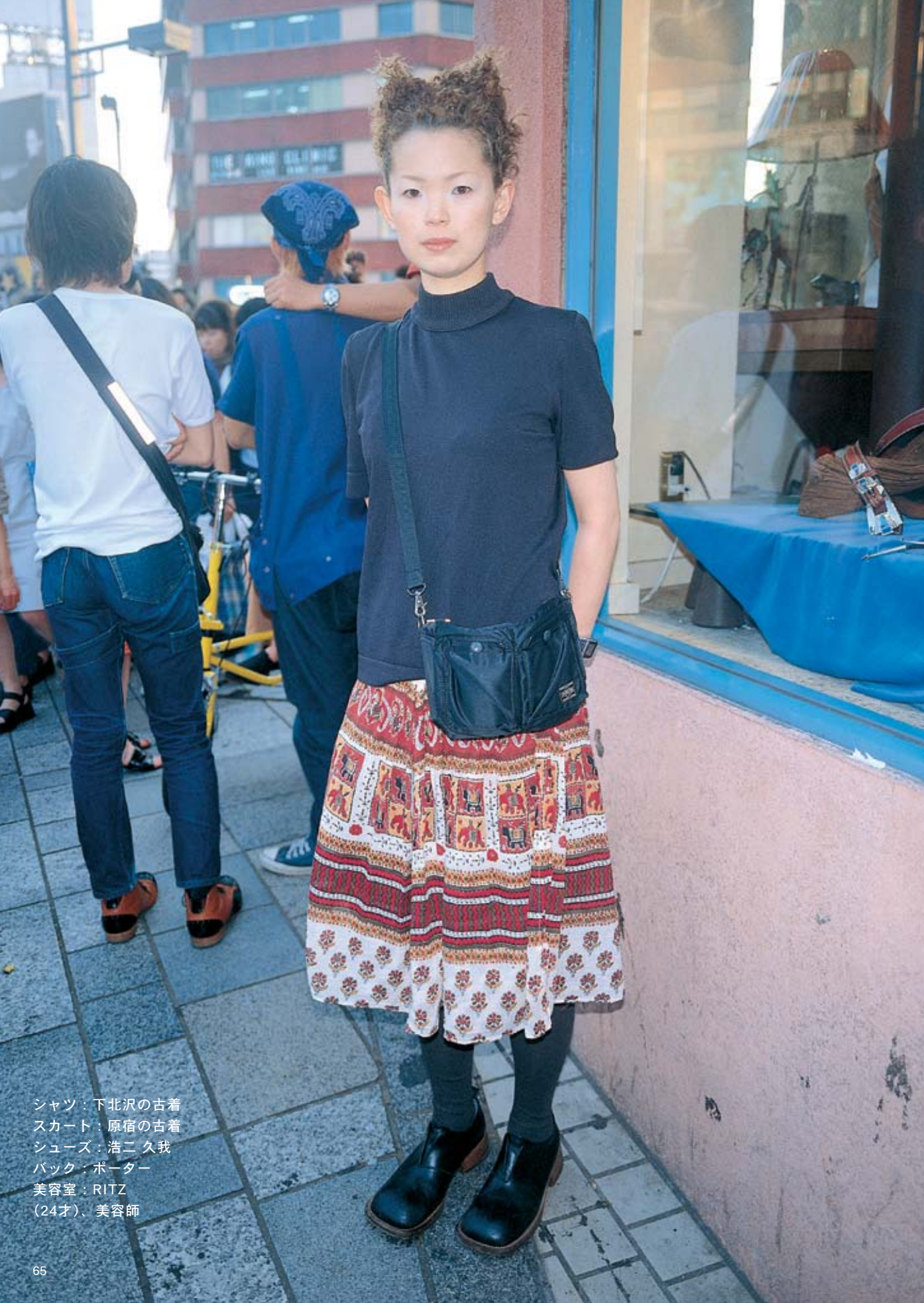
シャツ：下北沢の古着 スカート：原宿の古着 シューズ：浩二 久我 バック：ポーター 美容室：RITZ (24才)、美容師