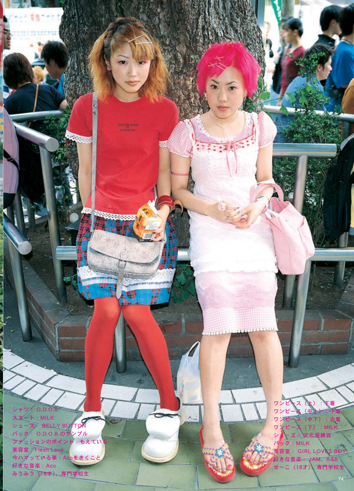
シャツ：O.D.O.B. スカート：MILK シューズ：BELLY BUTTON バック：O.D.O.B.のサンプル ファッションのポイント：もえている 美容室：Flesh Love 今ハマっている事：Acoをきくこと 好きな音楽：Aco みうみう（18才）、専門学校生