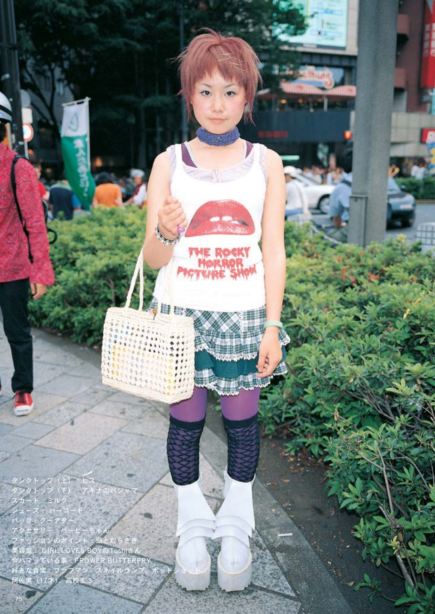
タンクトップ（上）：ヒス タンクトップ（下）：アキナのバジャマ スカート：ミルク シューズ：バーコード バック：クーデター アクセサリー：バービーちゃん ファッションのポイント：頭とむらさき 美容室：GIRL LOVES BOYのToshiさん 今ハマっている事：FLOWER BUTTERFLY 好きな音楽：ブラフマン、スネイルランプ、ポットショット 阿佐実（17才）、高校生3