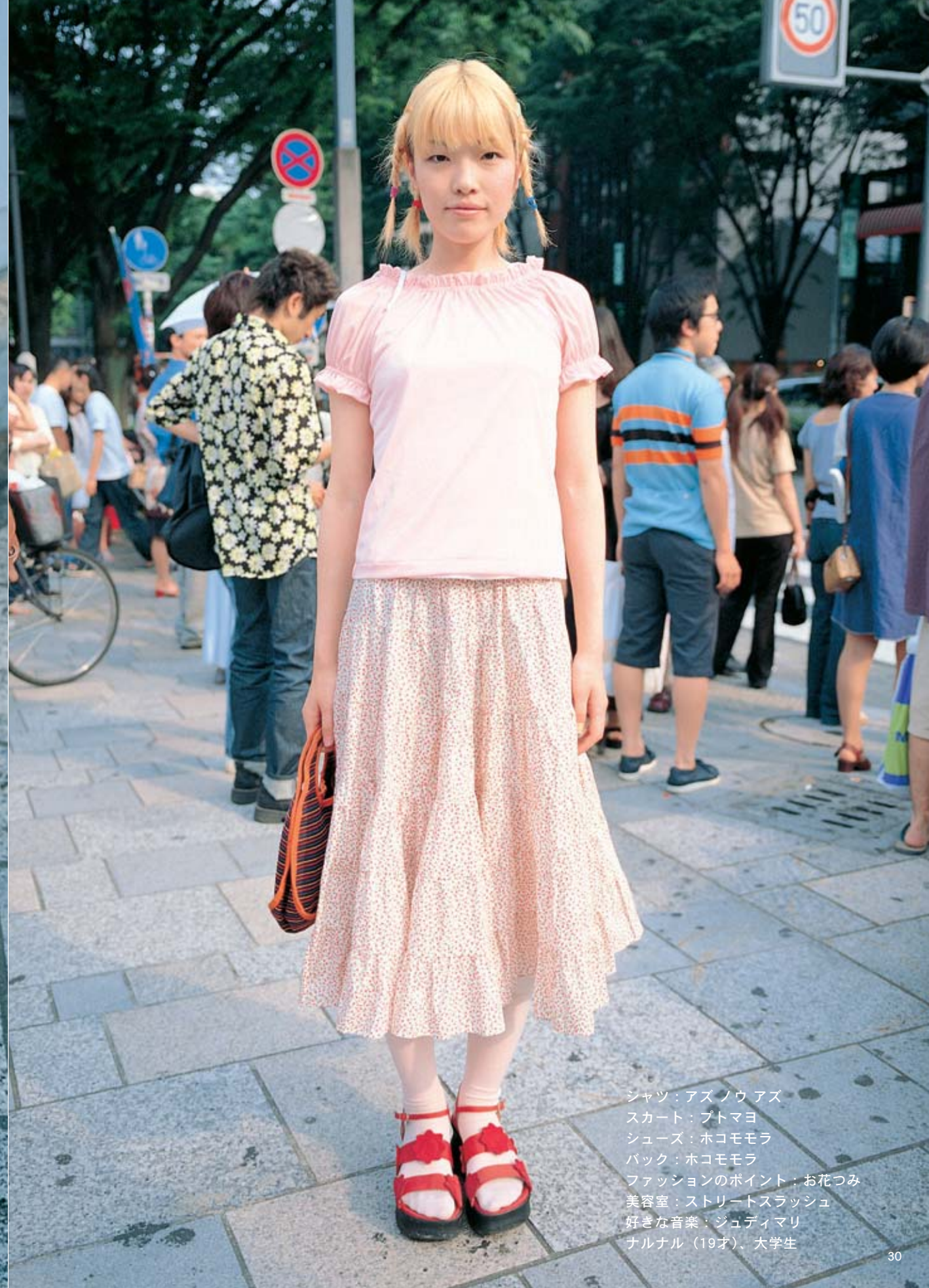
シャツ：アズノウアズ スカート：プトマヨ シューズ：ホコモモラ バック：ホコモモラ ファッションのポイント：お花つき 美容室：ストリートスラッシュ 好きな音楽：ジュディマリ ナルナル（19才）、大学生