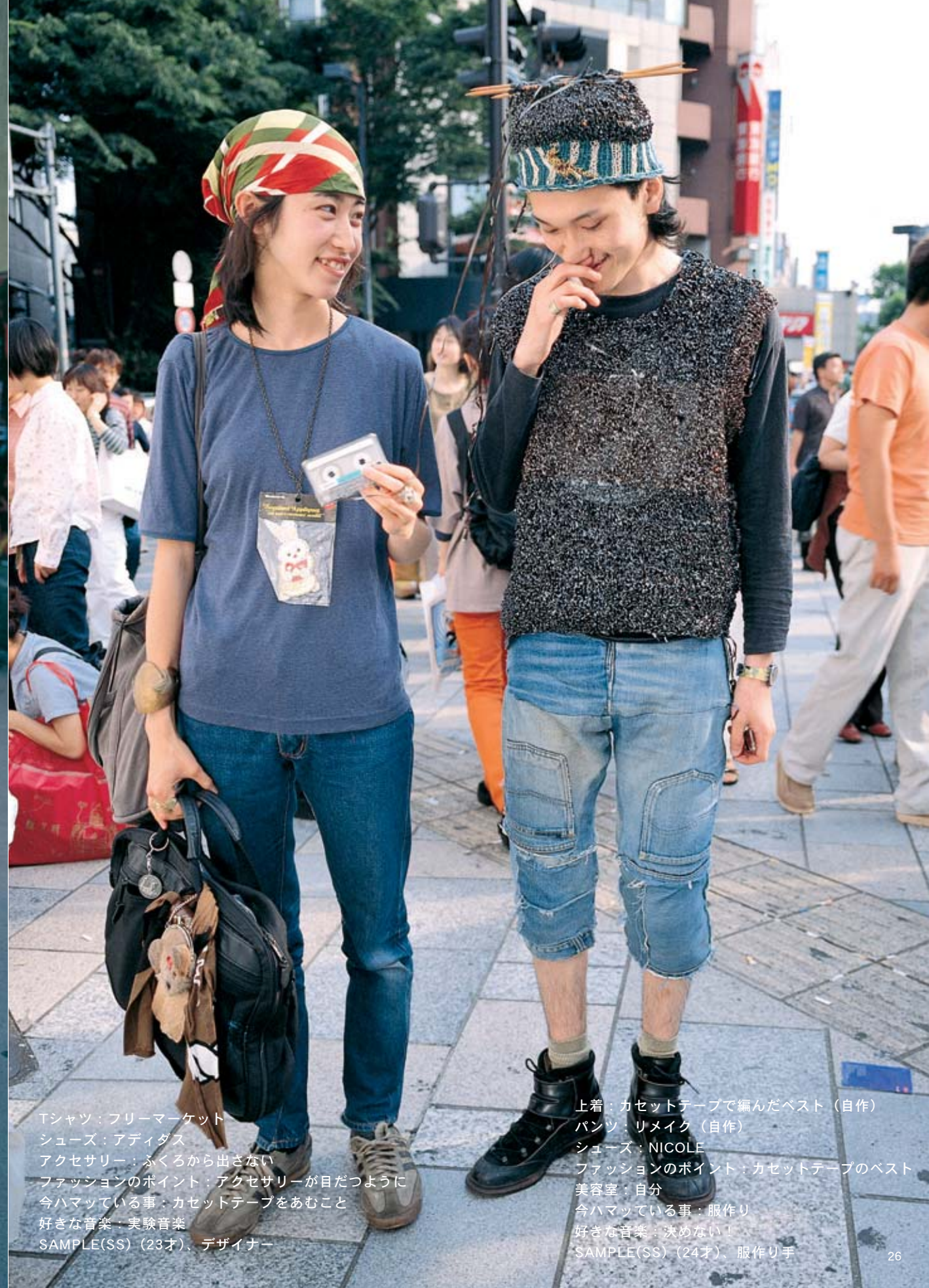
Tシャツ：フリーマーケット シューズ：アディダス アクセサリー：ふくろから出さない ファッションのポイント：アクセサリーが目立つように 今ハマっている事：カセットテープをあむこと 好きな音楽：実験音楽 SAMPLE(SS)（23才）、デザイナー