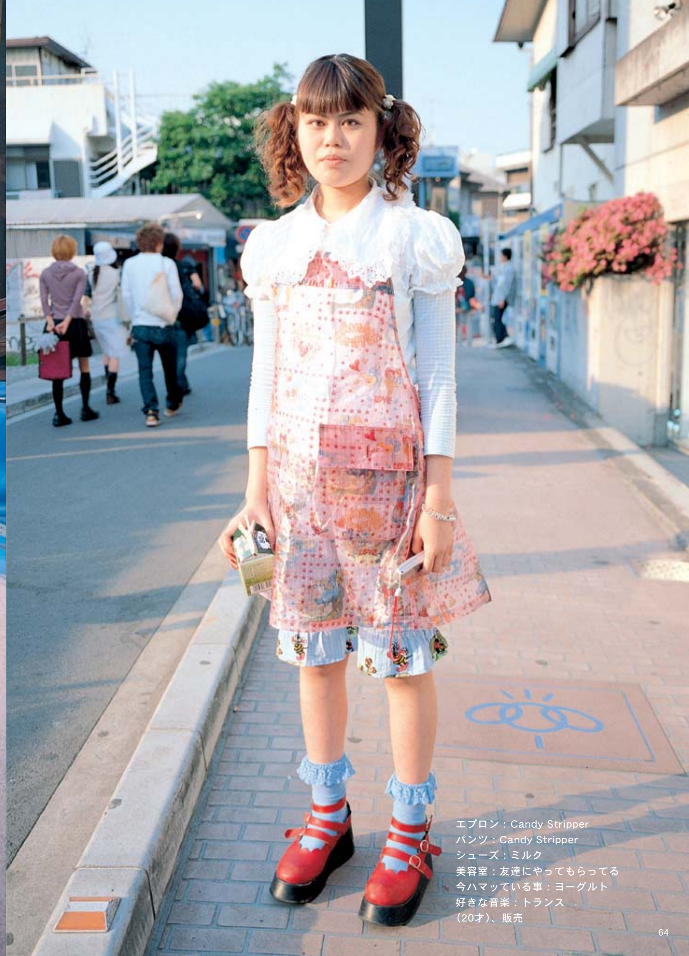
エプロン：Candy Stripper パンツ：Candy Stripper シューズ：ミルク 美容室：友達にやってもらってる 今ハマっている事：ヨーグルト 好きな音楽：トランス (20才)、販売