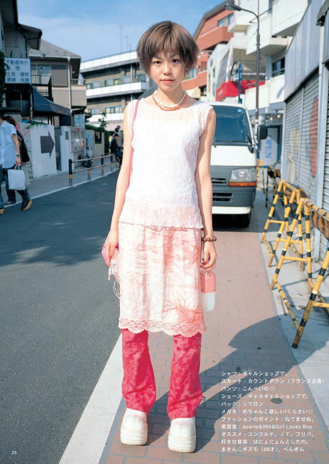
シャツ：ギャルショップで。 スカート：カウントダウン（フランス古着） パンツ：こんぺいの♡ シューズ：ギャルギャルショップで。 バック：シマロン メガネ：めちゃんこ欲しい!くらしい♡ ファッションのポイント：ねてませぬ。 美容室：aparie&369&Girl Loves Boy オススメ：コンコルド。J.T. フリパ。 好きな音楽：ほにょんとしたの。 まきんこギズモ（88才）、ぺんぎん