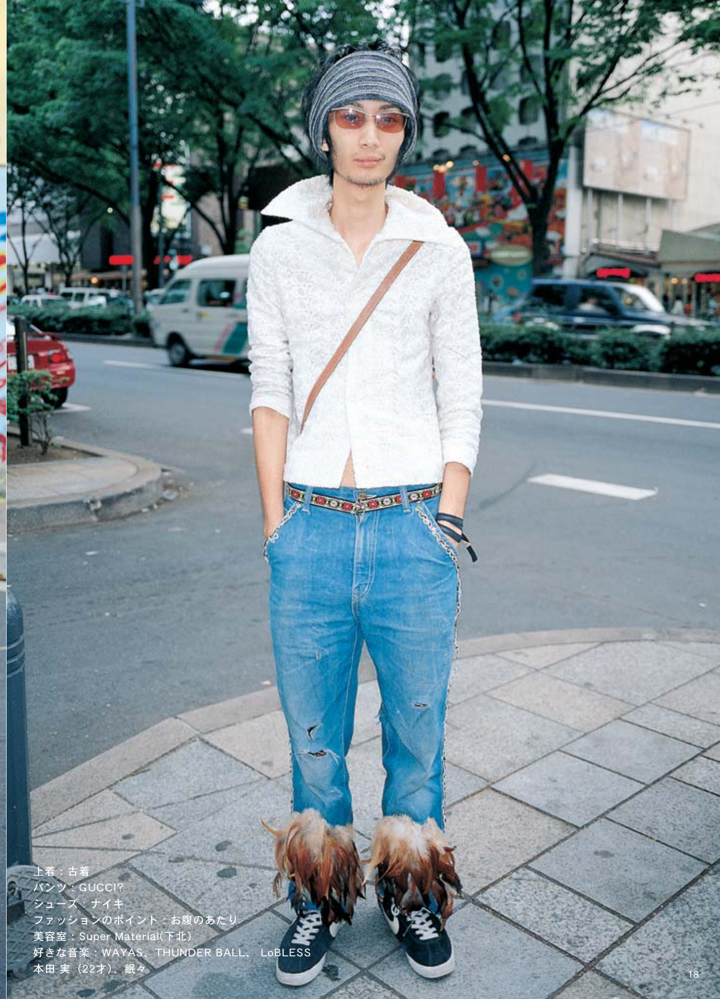
上着：古着 パンツ：GUCCI? シューズ：ナイキ ファッションのポイント：お腹のあたり 美容室：Super Material(下北) 好きな音楽：WAYAS、THUNDER BALL、LoBLESS 本田 実（22才）、眠々