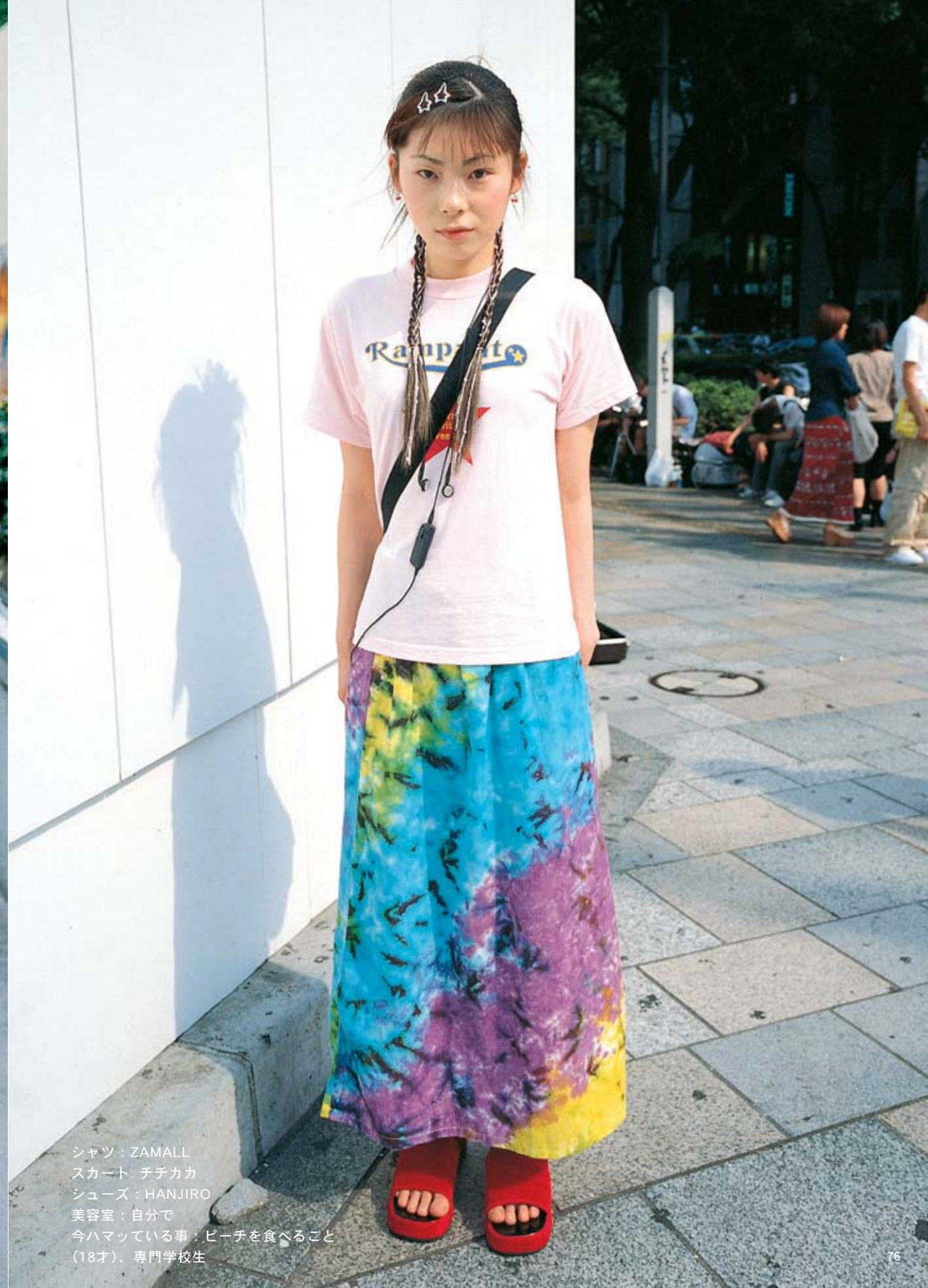
シャツ：ZAMALL スカート：チチカカ シューズ：HANJIRO 美容室：自分で 今ハマっている事：ビーチを食べること (18才)、専門学校生