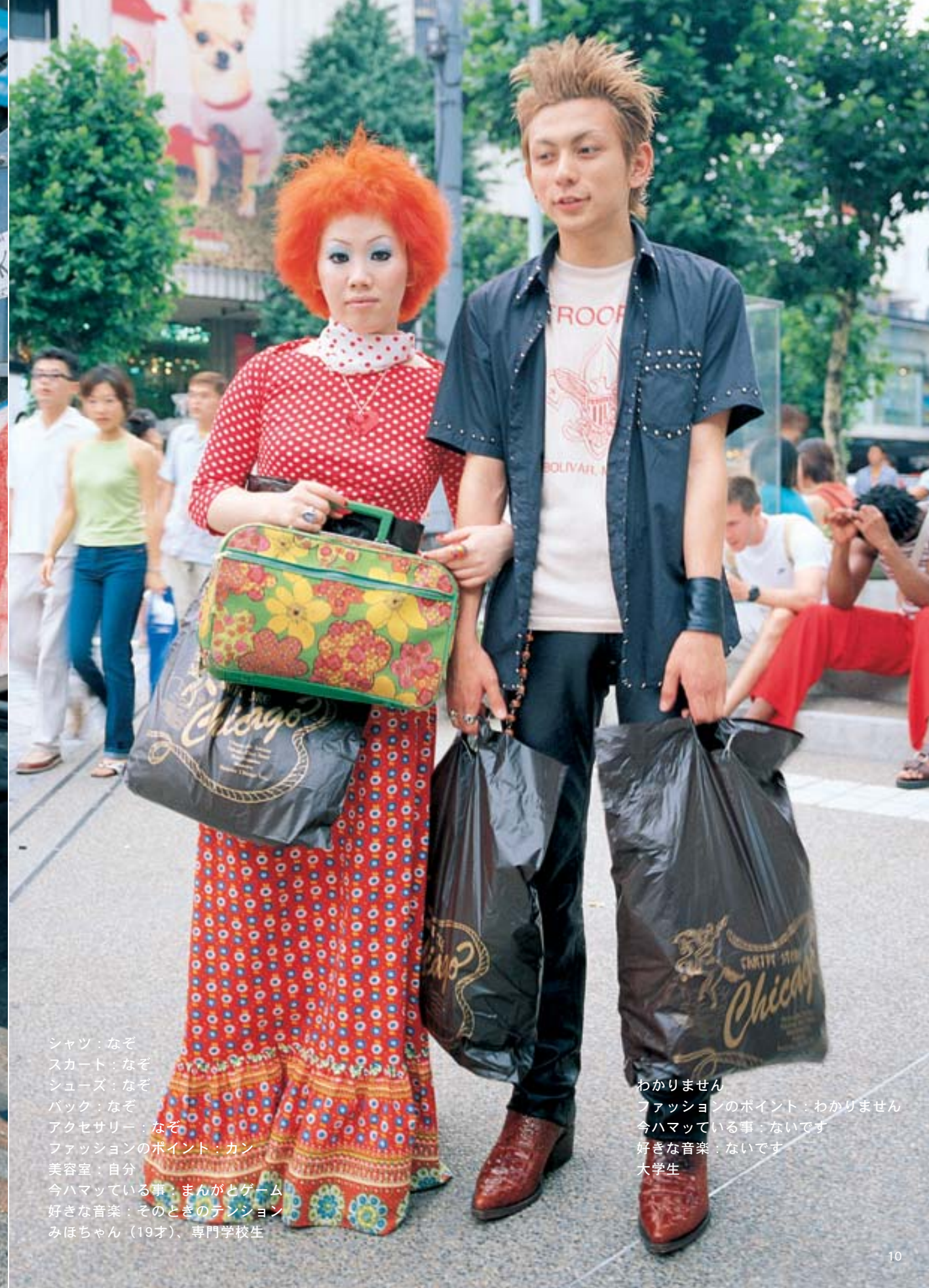
シャツ：なぞ スカート：なぞ シューズ：なぞ バック：なぞ アクセサリー：なぞ ファッションのポイント：カン 美容室：自分 今ハマっている事：まんがとゲーム 好きな音楽：そのときのテンション みほちゃん（19才）、専門学校生