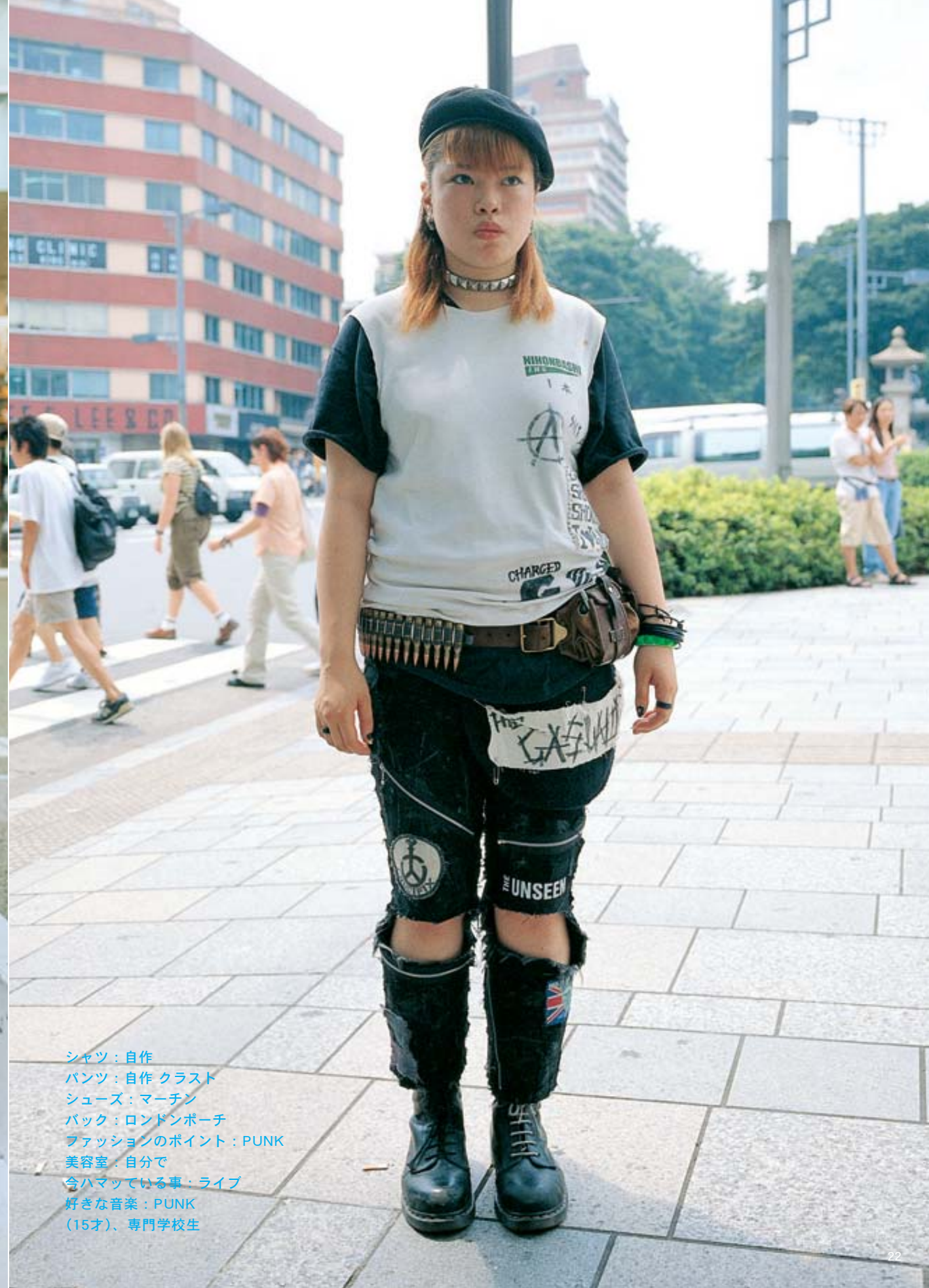
シャツ：自作 パンツ：自作 クラスト シューズ：マーチン バック：ロンドンポーチ ファッションのポイント：PUNK 美容室：自分で 今ハマっている事：ライブ 好きな音楽：PUNK （15才）、専門学校生