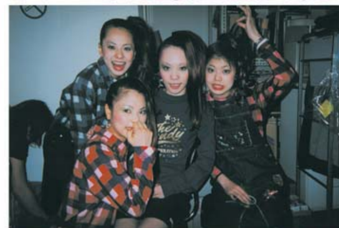
タレントギルゆき・あさみ・まきまきも。