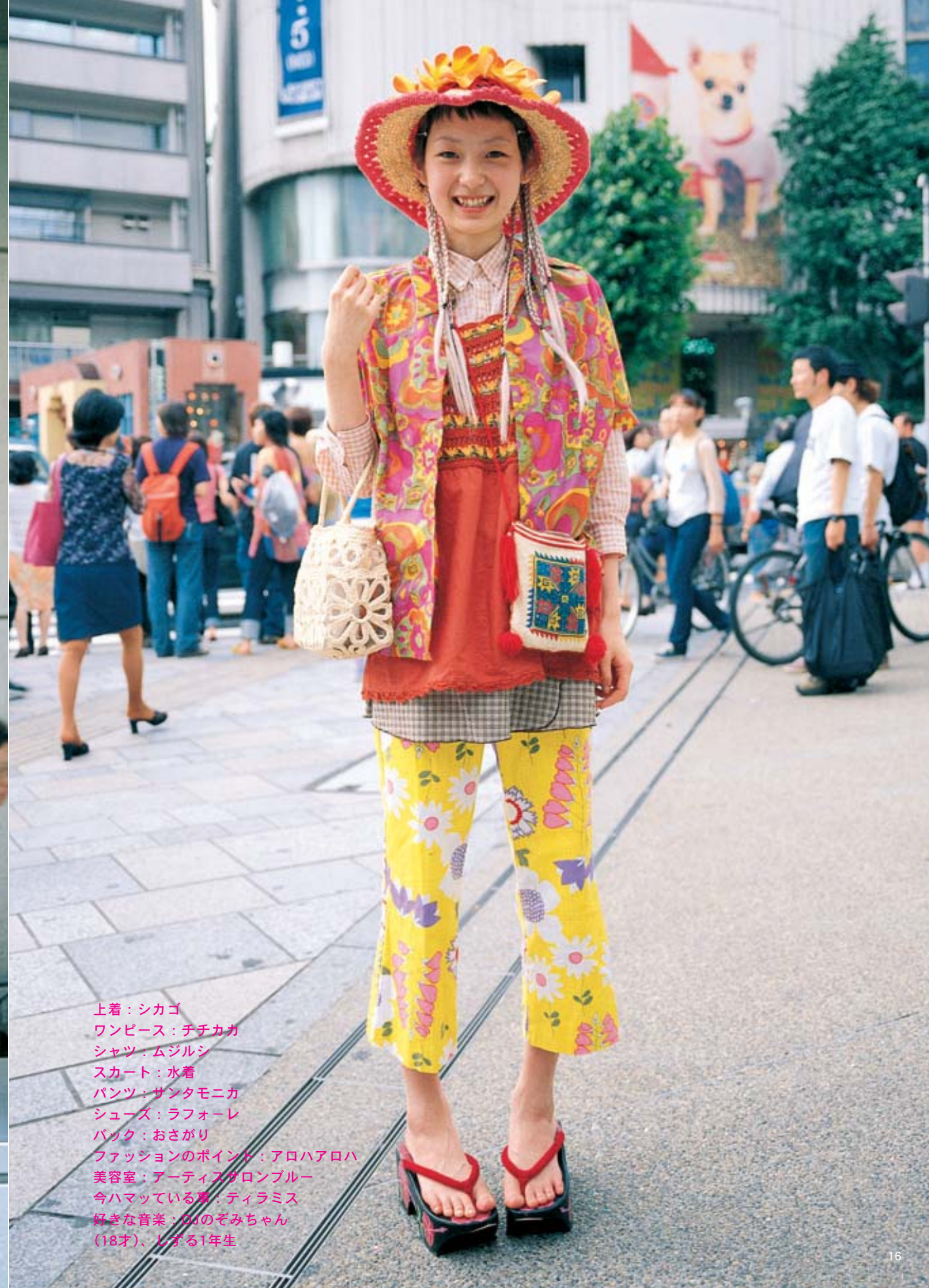
上着：シカゴ ワンピース：チチカガ シャツ：ムジルシ スカート：水着 パンツ：サンタモニカ シューズ：ラフォーレ バッグ：おさがり ファッションのポイント：アロハアロハ 美容室：アーティスサロンブルー 今ハマっている歌：ティラミス 好きな音楽：G.I.のぞみちゃん (18才)、しずる1年生