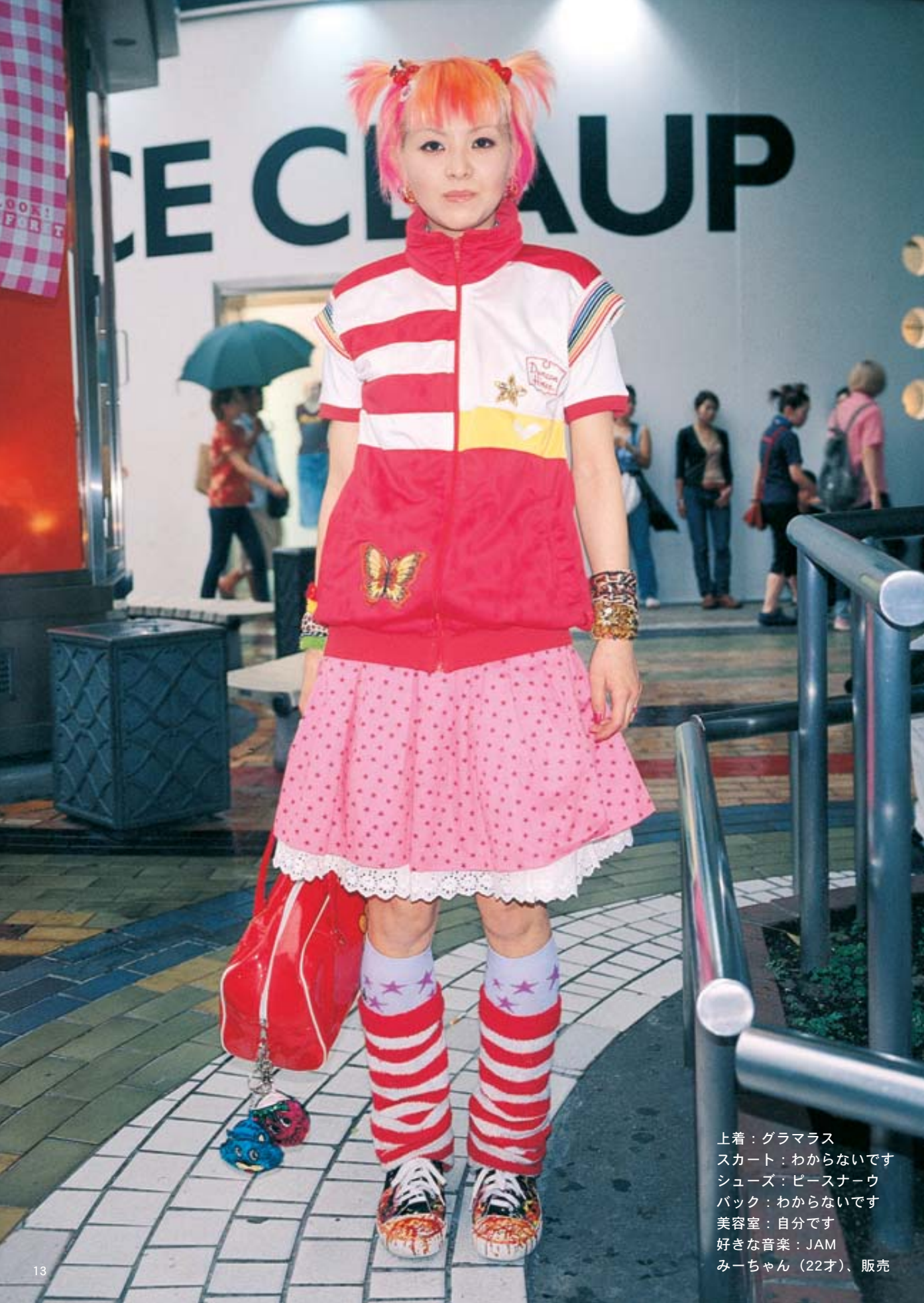
上着：グラマラス スカート：わからないです シューズ：ピースナーウ バック：わからないです 美容室：自分です 好きな音楽：JAM みーちゃん（22才）、販売