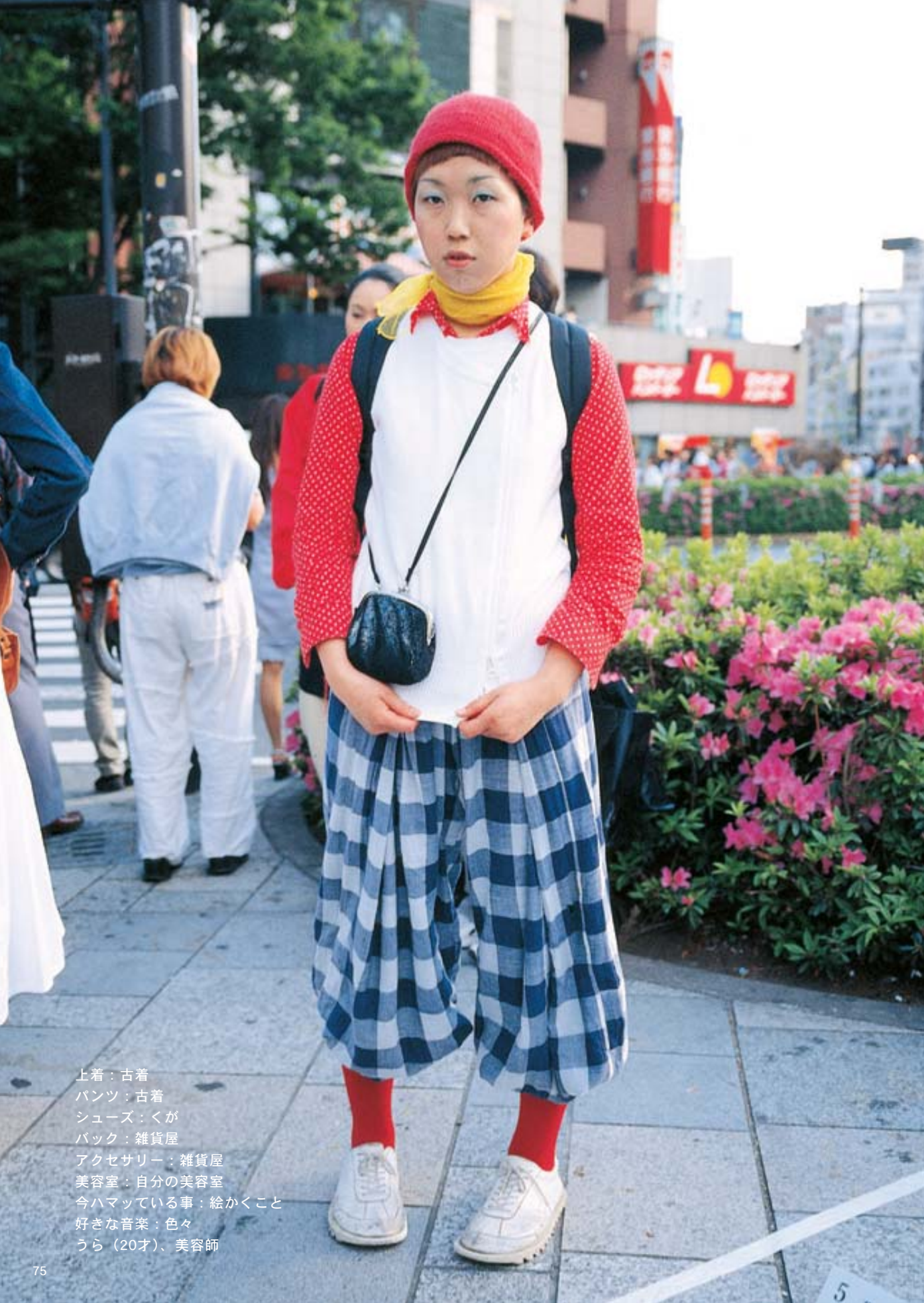
上着：古着 パンツ：古着 シューズ：くが バック：雑貨屋 アクセサリー：雑貨屋 美容室：自分の美容室 今ハマっている事：絵かくこと 好きな音楽：色々 うら（20才）、美容師