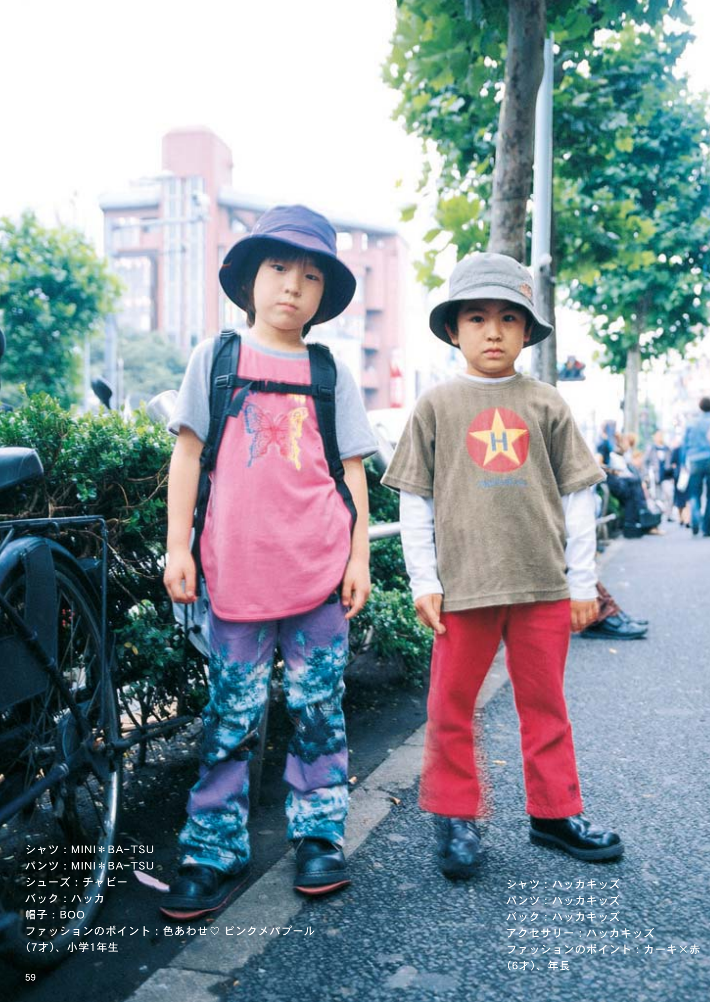
シャツ：MINI*BA-TSU パンツ：MINI*BA-TSU シューズ：チャビー バック：ハッカ 帽子：BOO ファッションのポイント：色あわせ♡ピンクメパブル (7才)、小学1年生