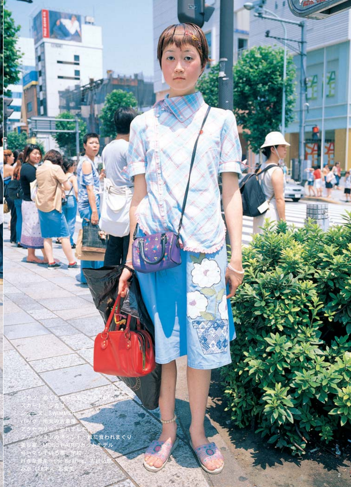
シャツ：めぐちゃんにもらったBetty's BLUE スカート：ジカゴ シューズ：SWIMMER バック：地元の古着屋 アクセサリー：忘れました。 ファッションのポイント：蚊に食われまくり 美容室：MODSHAIRのカットモデル 今ハマっている事：学校 好きな音楽：the Beatles、吉田拓郎 みか（18才）、お茶美