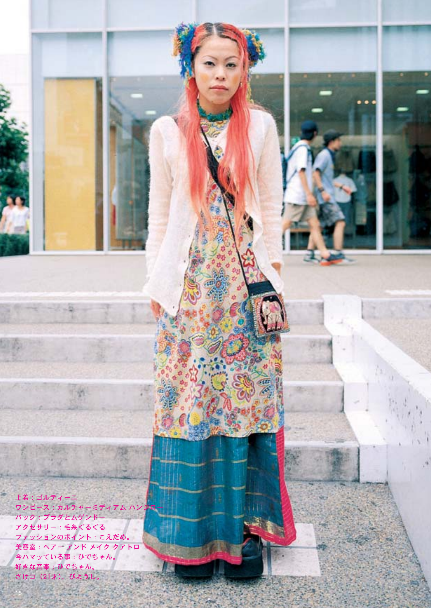
上着：ゴルドーニ ワンピース：カルチャーミディアム ハンジロー バック：ブラダとムゲンドー アクセサリー：毛糸ぐるぐる ファッションのポイント：こえだめ。 美容室：ヘアー アンド メイク クアトロ 今ハマっている事：ひでちゃん。 好きな音楽：ひでちゃん。 さけコ (21才)、びようし。