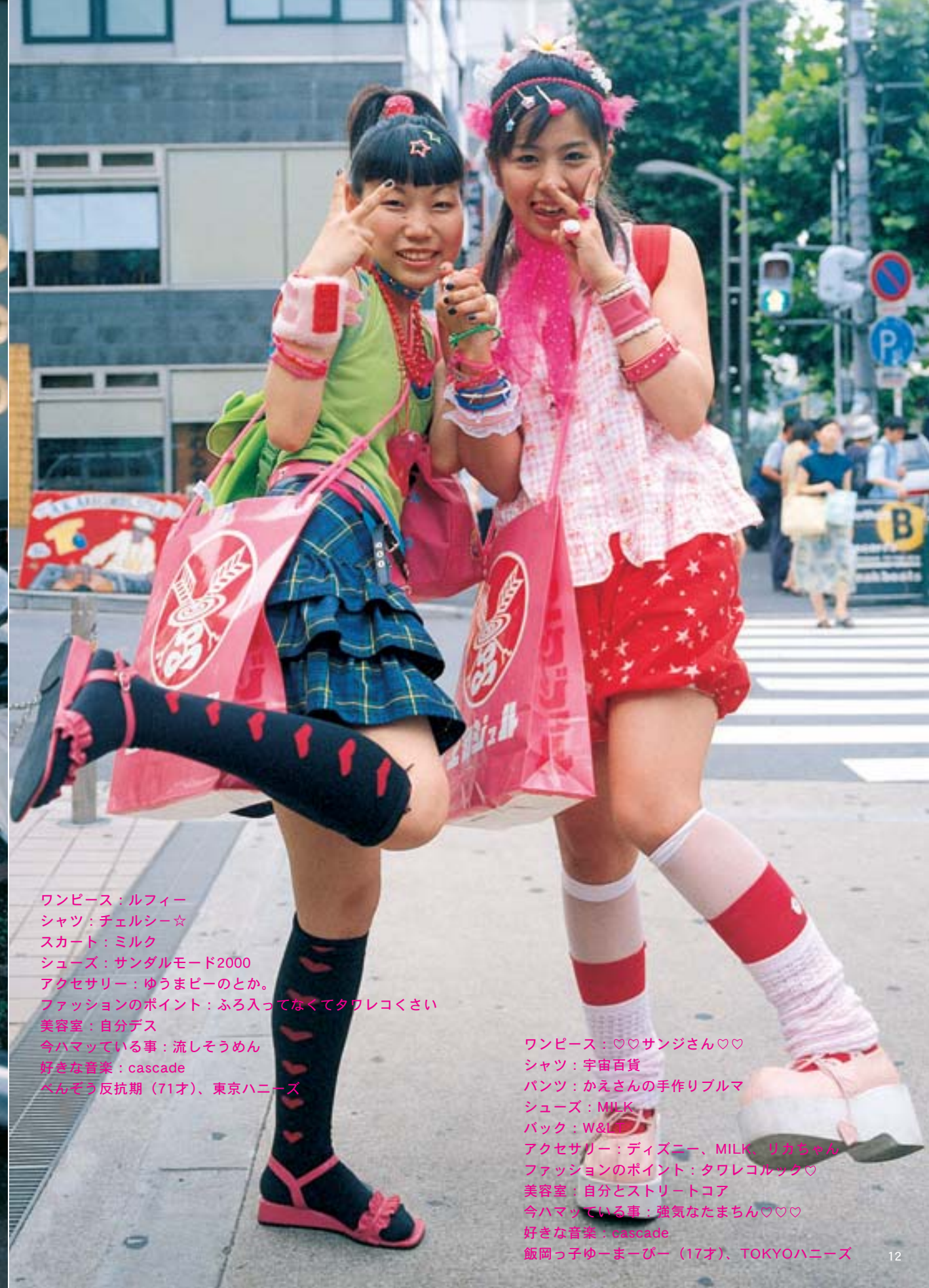
ワンピース：ルフィー シャツ：チェルシー☆ スカート：ミルク シューズ：サンダルモード2000 アクセサリー：ゆうまビーのとか。 ファッションのポイント：ふろ入ってなくてタワレコくさい 美容室：自分デス 今ハマっている事：流しそうめん 好きな音楽：cascade ペんぞう反抗期（71才）、東京ハニーズ