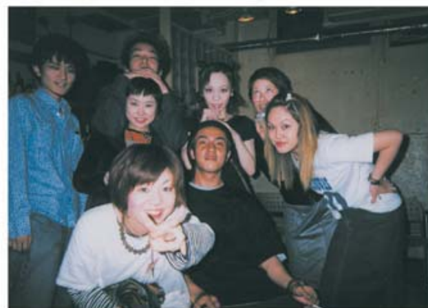
しんちゃん(毛虫)きんやまっち(ダ・ヴィンチ)なつ・かず(日サロ中) みち、なな、ふみ(前出すぎ)

こんにちは。今月は、愛猫モンキの写真を見せちゃうぞー。日に日に、でかくなって、今じゃうーとか 声出して大暴れの手には負えないモンチ。バカ猫だけど、寝てる時は、かわいこちゃんだよ。私も ついに、ニャンコファミリーの一員に。今月はねえそのイセにも、CAVEのイベントのと、C.Sのファッション ショーのと写真をバシバシ出しちゃうよー。7月10日のPLAYAのラフ、音は悪かったけど、きもちよく歌えました。 まだまだ足りないもの煮詰めて、練習に入って、次のラフにむかうよー。スタッフの方、お客さん、ありがとう。