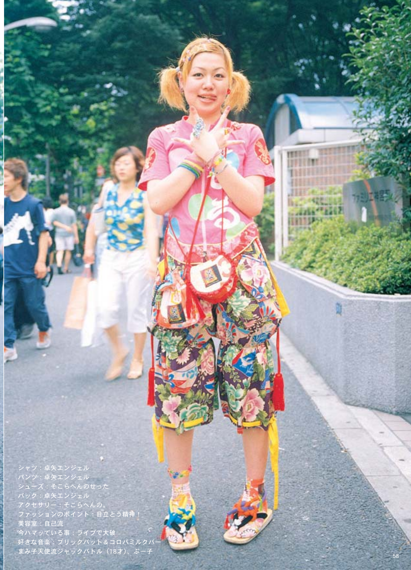
シャツ：卓矢エンジェル パンツ：卓矢エンジェル シューズ：そこらへんのせった バック：卓矢エンジェル アクセサリー：そこらへんの。 ファッションのポイント：目立とう精神！ 美容室：自己流 今ハマっている事：ライブで大破 好きな音楽：ブリックバット&コロバミルクバー まみ子天使流ジャックバトル (18才)、プー子