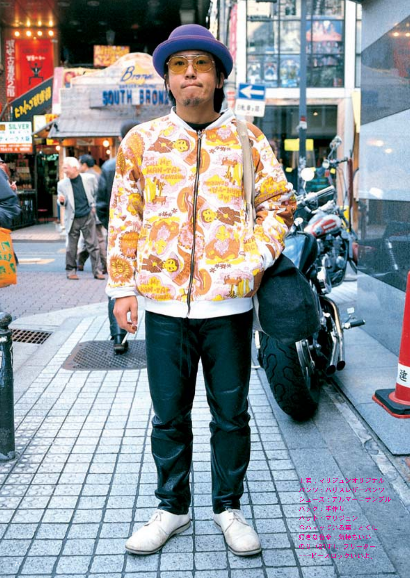
上着：マリジュンオリジナル パンツ：ハリスレザーパンツ シューズ：アルマーニサンプル バック：手作り ハット：マリジュン 今ハマっている事：とくに 好きな音楽：気持ちいい のり (21才)、フリーター ---ピースロックいいよ。