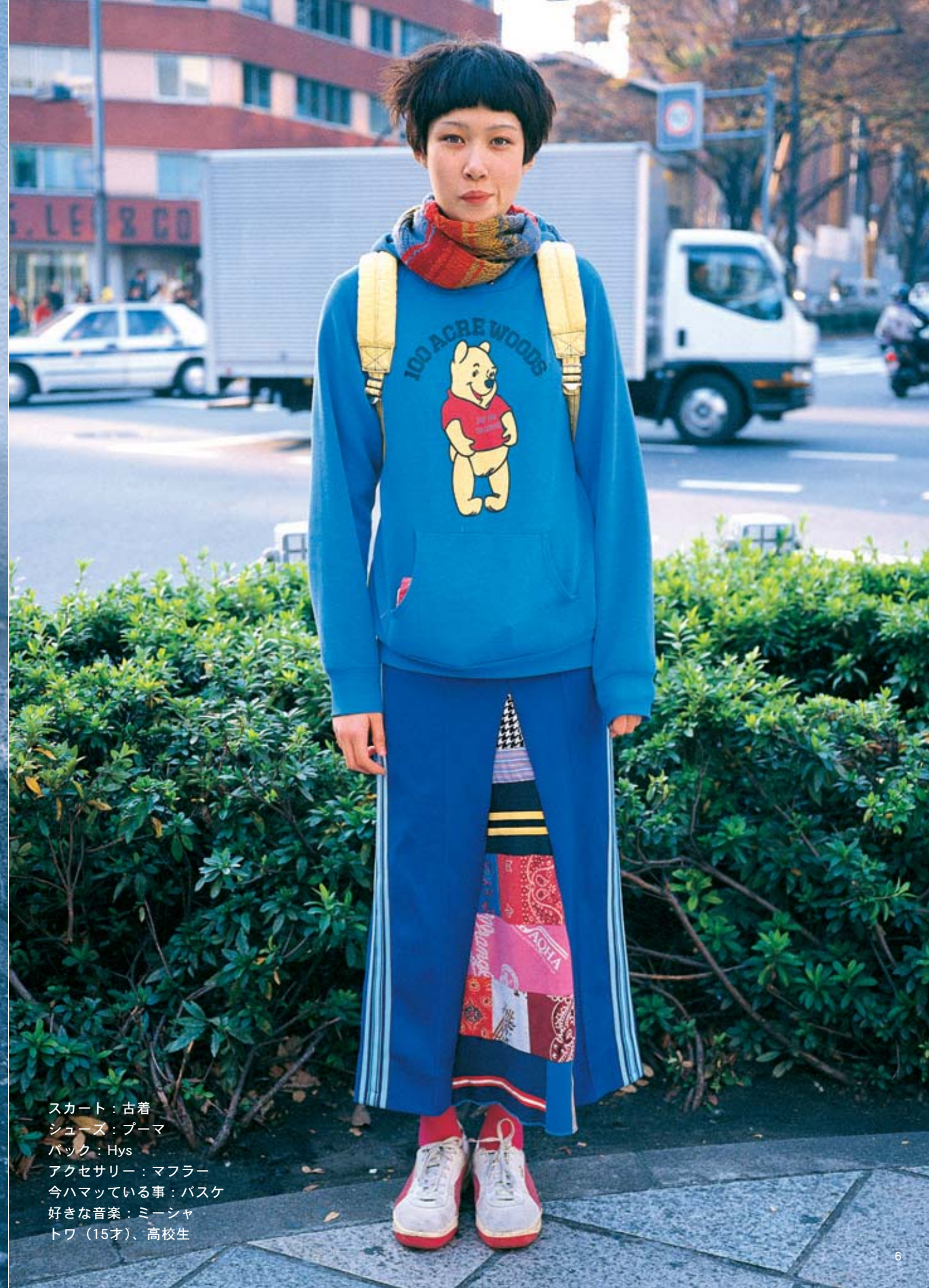
スカート：古着 シューズ：プーマ バック：Hys アクセサリー：マフラー 今ハマっている事：バスケット 好きな音楽：ミーシャ トワ（15才）、高校生