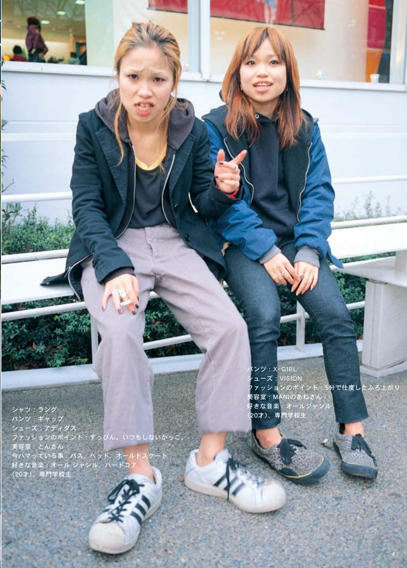
パンツ：X-GIRL シューズ：VISION ファッションのポイント：5分で仕度したふろ上がり 美容室：MANIのあねさん 好きな音楽：オールジャンル （20才）、専門学校生