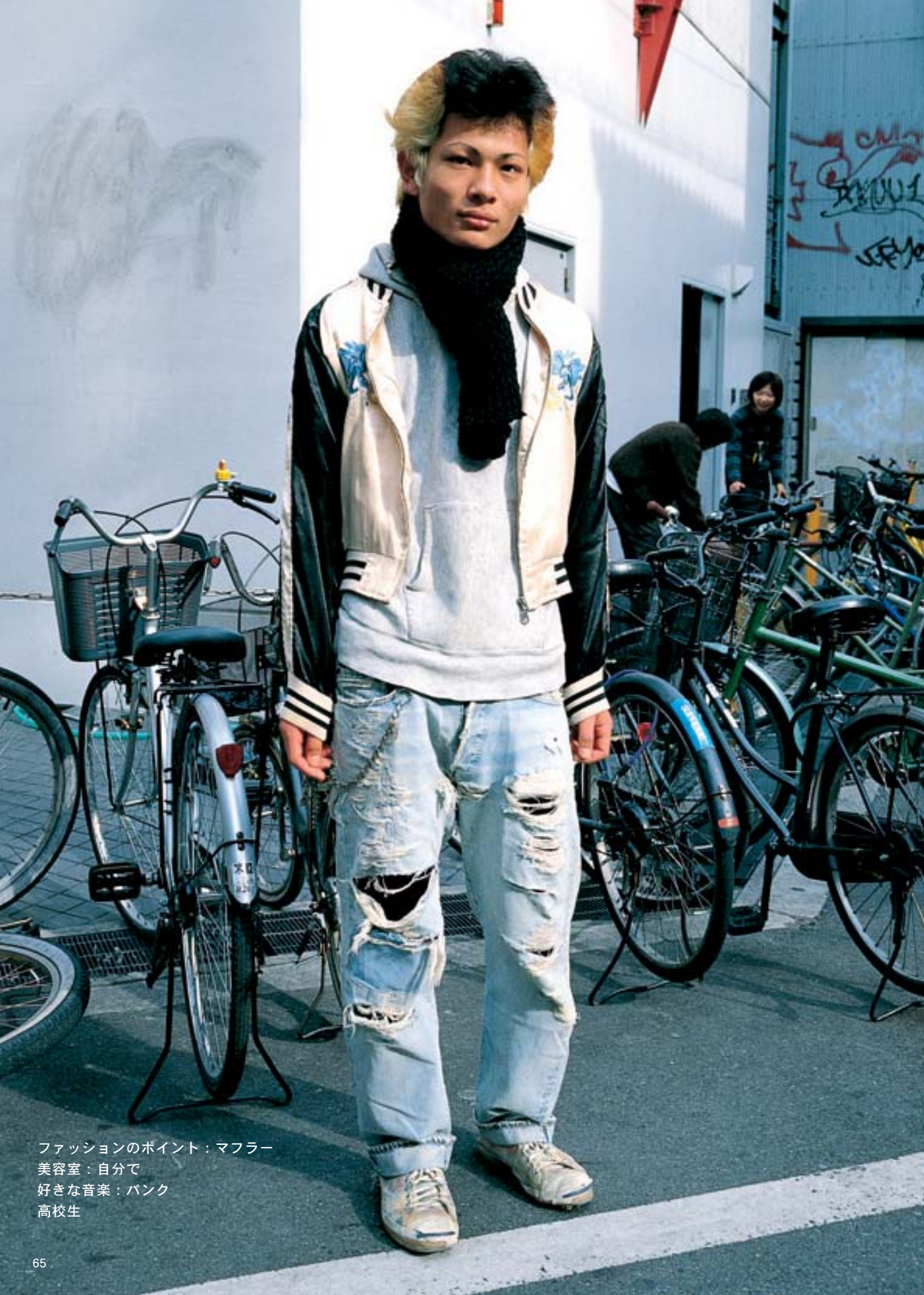
ファッションのポイント：マフラー 美容室：自分で 好きな音楽：パンク 高校生