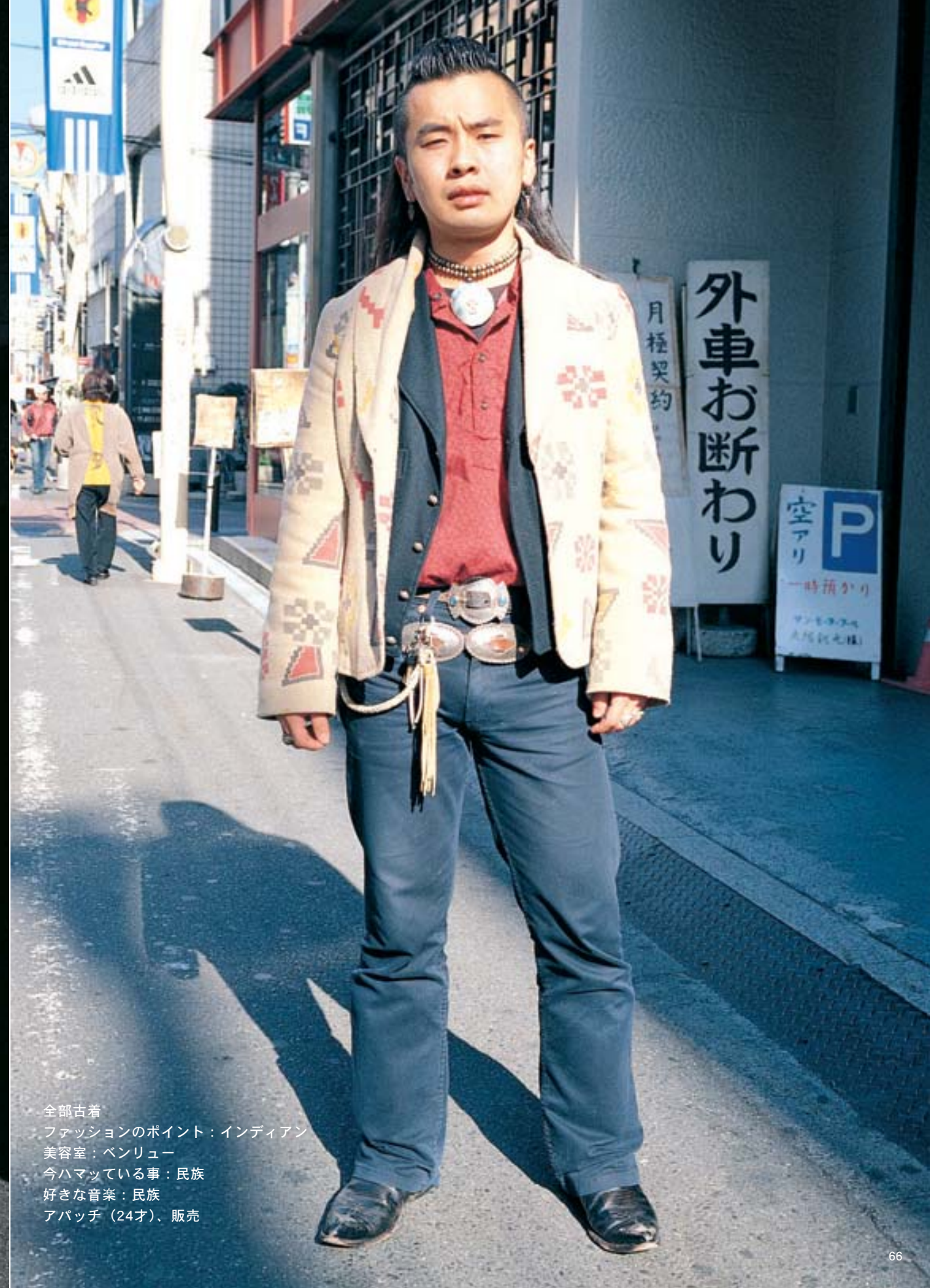
全部古着 ファッションのポイント：インディアン 美容室：ペンリユー 今ハマっている事：民族 好きな音楽：民族 アパッチ (24才)、販売