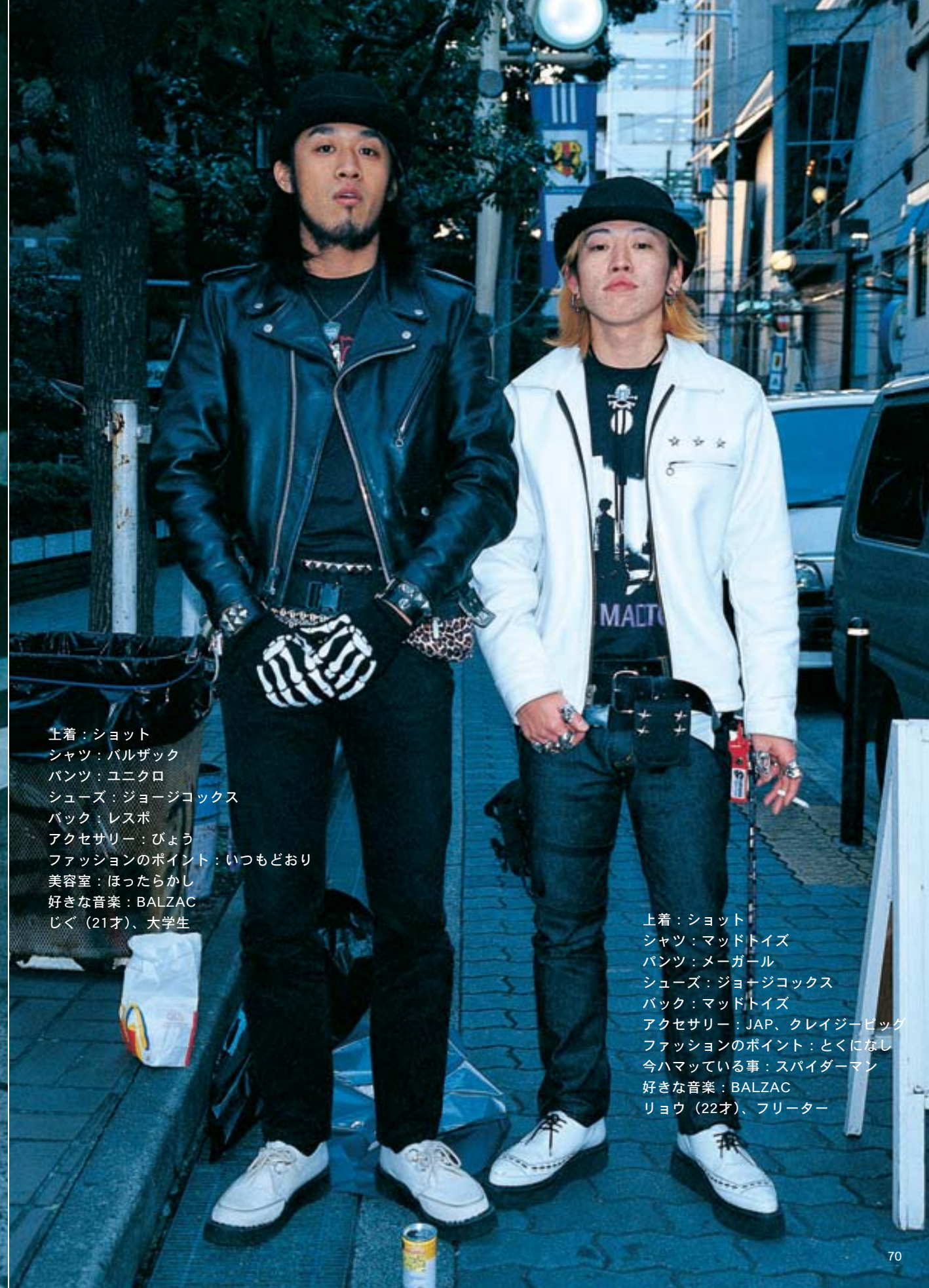
上着：ショット シャツ：バルザック パンツ：ユニクロ シューズ：ジョージコックス バック：レスポ アクセサリー：びょう ファッションのポイント：いつもどおり 美容室：ほったらかし 好きな音楽：BALZAC じぐ（21才）、大学生