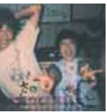
ゆっ子とそのお兄ちゃん♥かっ こいい♥