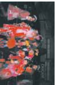
1/2のライブ。大阪のあずさ ちゃんとうさ、今度でみかく ねーまててねー