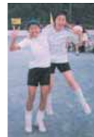
えりちゃんと、あちゃ 〜つつ