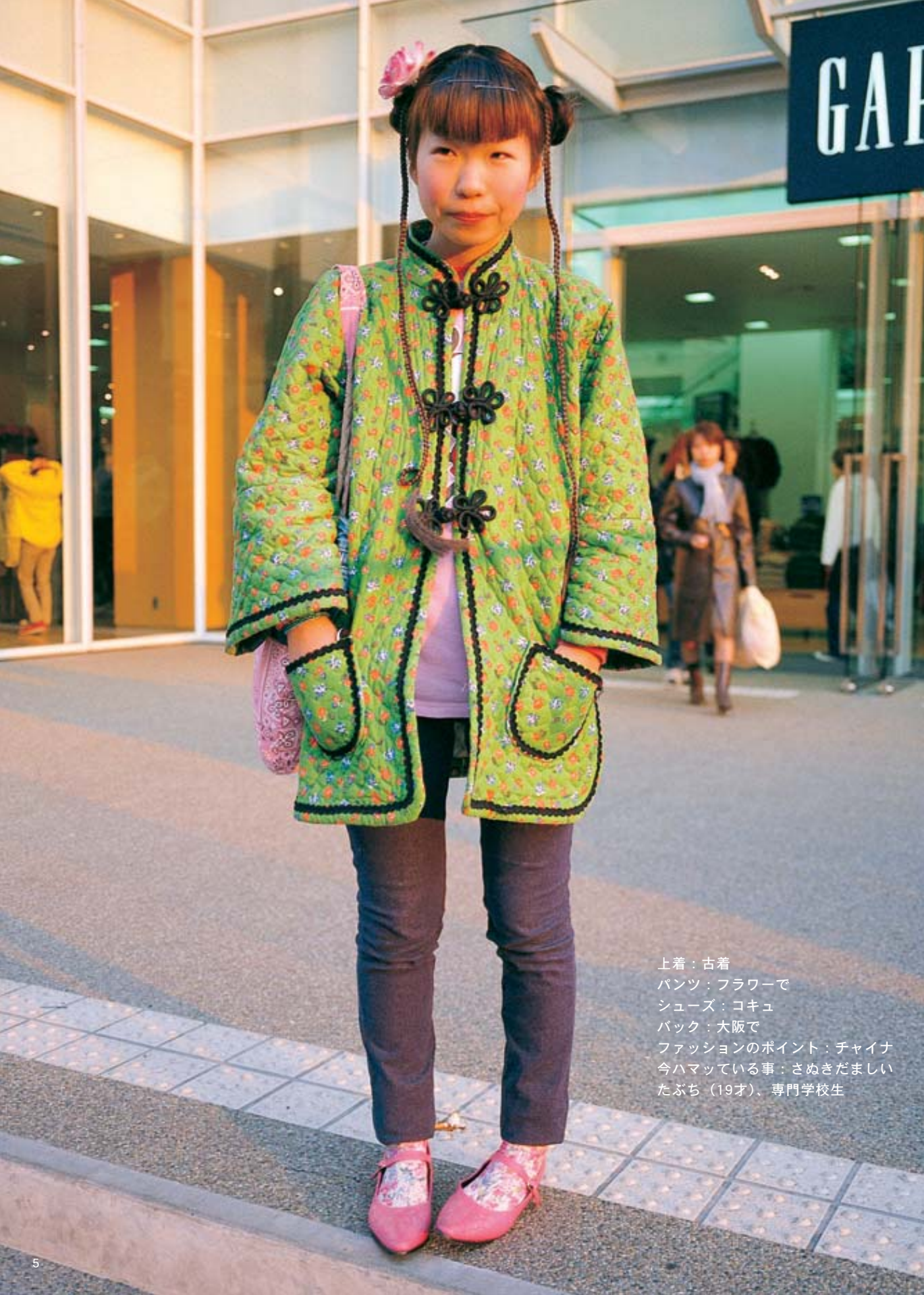
上着：古着 パンツ：フラワーで シューズ：コキュ バック：大阪で ファッションのポイント：チャイナ 今ハマっている事：さぬきだまし たぶち（19才）、専門学校生