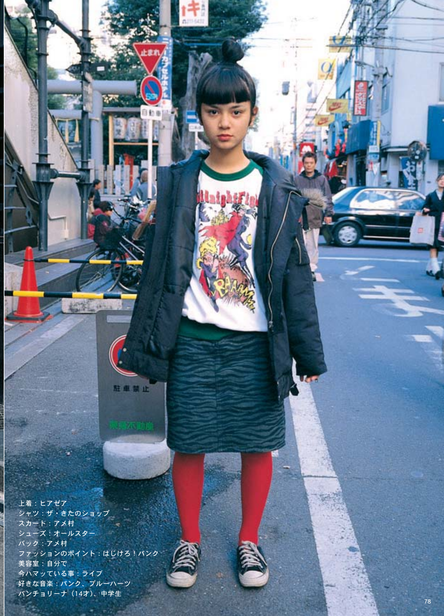
上着：ヒアゼア シャツ：ザ・ぎたのショップ スカート：アメ村 シューズ：オールスター バック：アメ村 ファッションのポイント：はじける！バンク 美容室：自分で 今ハマっている事：ライブ 好きな音楽：バンク、ブルーハーツ バンチョリーナ（14才）、中学生