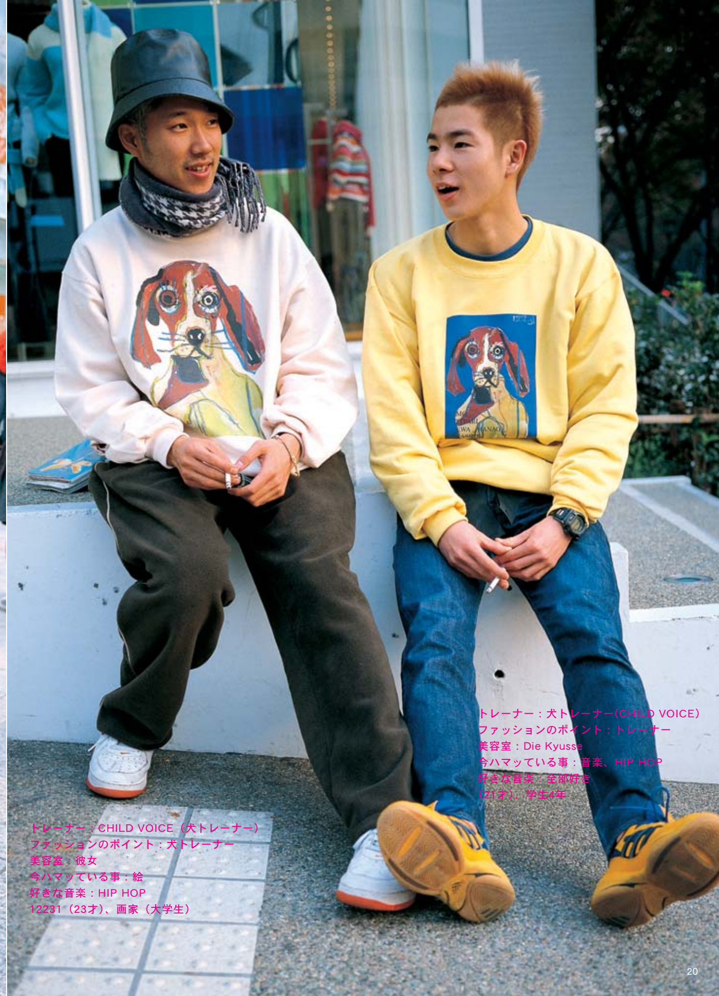
トレーナー：CHILD VOICE（犬トレーナー） ファッションのポイント：犬トレーナー 美容室：彼女 今ハマっている事：絵 好きな音楽：HIP HOP 12231（23才）、画家（大学生）