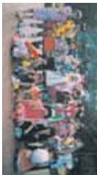
9月のライブ。みなさ んかわいすぎだよ。あ こがれ♥