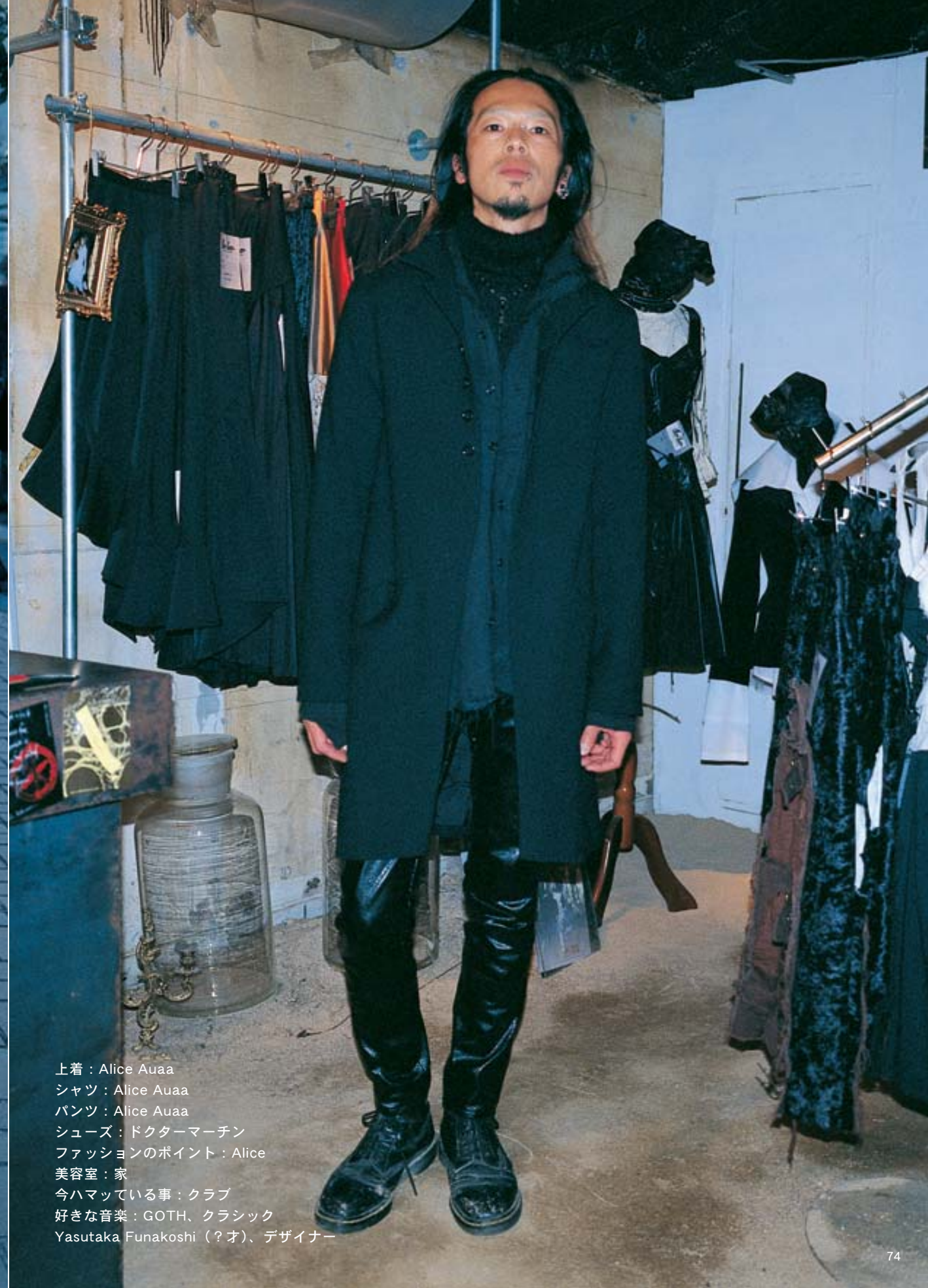
上着：Alice Auua シャツ：Alice Auua パンツ：Alice Auua シューズ：ドクターマーチン ファッションのポイント：Alice 美容室：家 今ハマっている事：クラブ 好きな音楽：GOTH、クラシック Yasutaka Funakoshi（？オ）、デザイナー