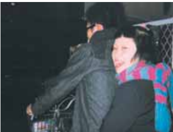
かねみくん。いいにおーい

今はすごい「うたかた」と おもしろい段馬食もう すくなくて、そろそろおん はりますよ。卒業いかだの みんなとはなれるのか いまだに「コリ」とはなれ るのよ。また、ママに ひみつで「1/2のフットーカン ライク」実は、いっちゃんしたの 「ひんおさ」の、ゆきして はやくこうこう生に なりたいうすのじゅん 下あったかみれなあそぼ あいちん、かおりちゃん、 いつおとまり会するのさ あちは、たのしみで「す ゆっ子、次のライク」は いっしょだよ。かくとく まゆん、一緒にフルー 表紙のうたしーねっ あそぼーあそぼー