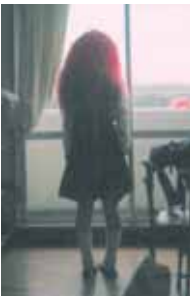
もののけ姫、あちゃ