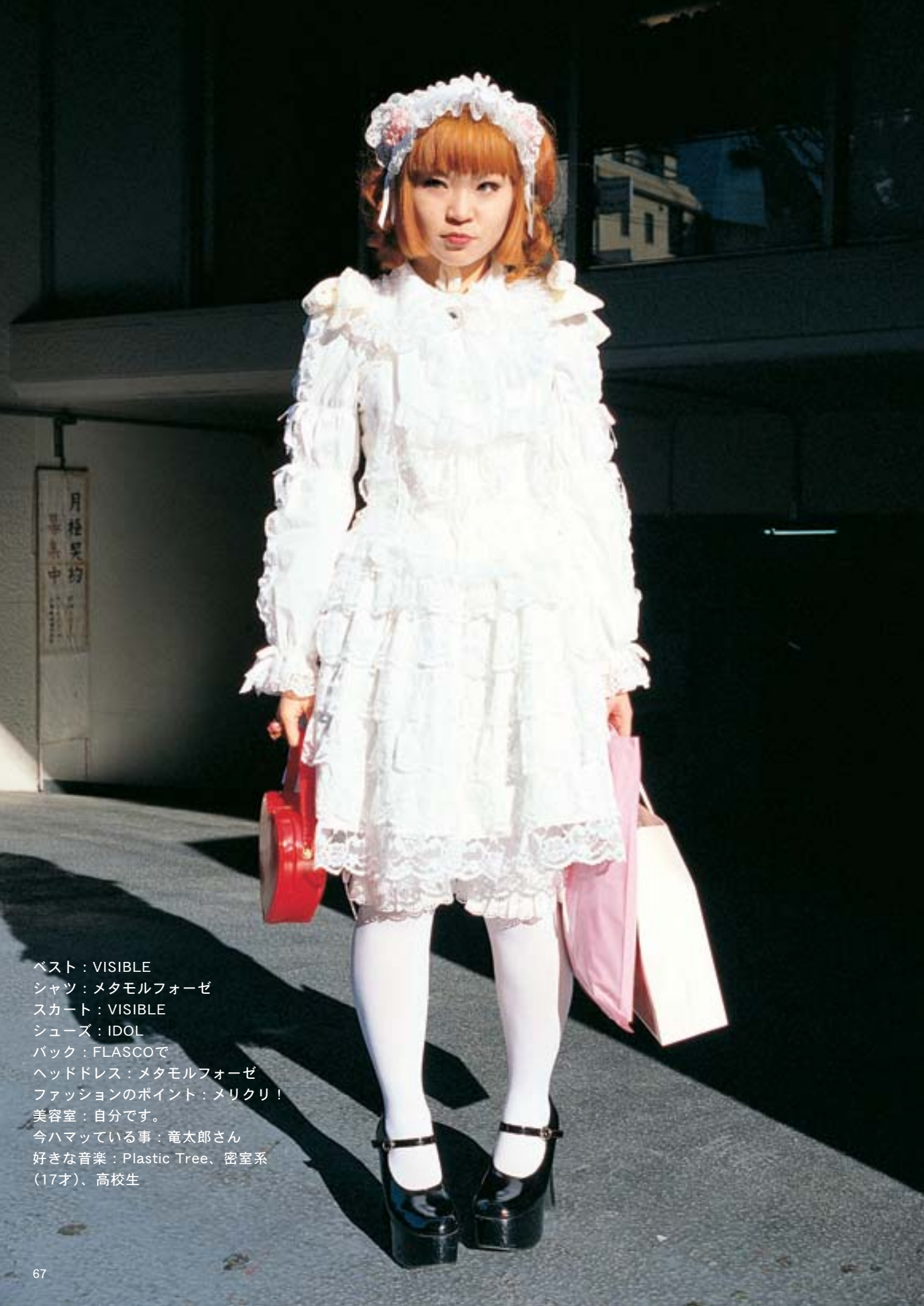
ベスト：VISIBLE シャツ：メタモルフォーゼ スカート：VISIBLE シューズ：IDOL バック：FLASCOで ヘッドドレス：メタモルフォーゼ ファッションのポイント：メリクリ！ 美容室：自分です。 今ハマっている事：竜太郎さん 好きな音楽：Plastic Tree、密室系 (17才)、高校生