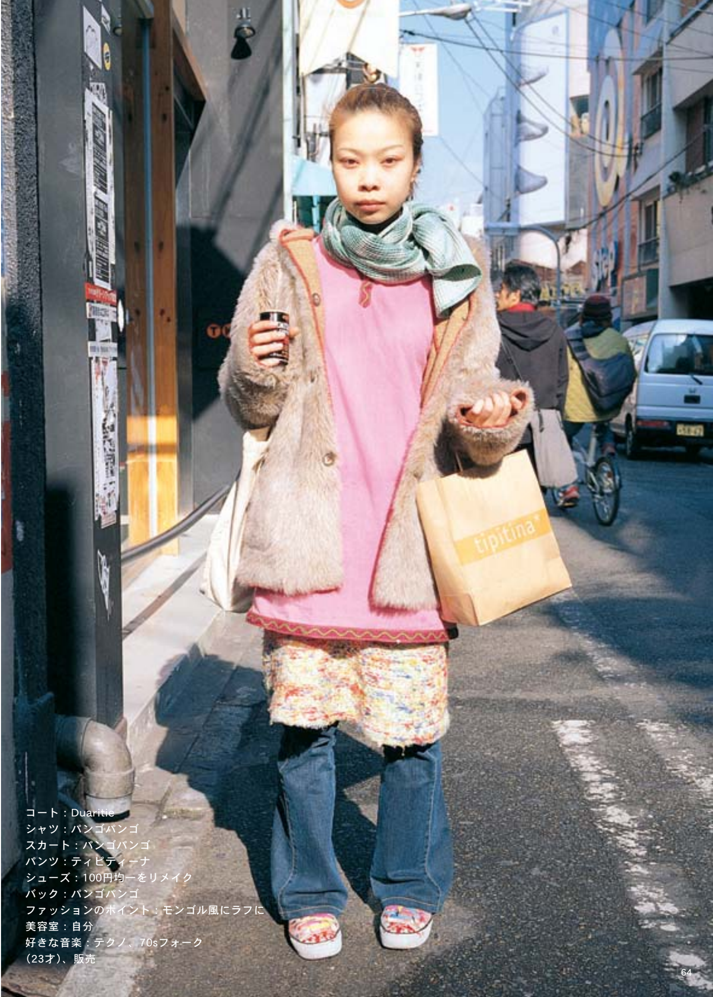
コート：Duaritie シャツ：バンゴバンゴ スカート：バンゴバンゴ パンツ：ティピティナ シューズ：100円均一をリメイク バック：バンゴバンゴ ファッションのポイント：モンゴル風にラフに 美容室：自分 好きな音楽：テクノ、70sフォーク (23才)、販売