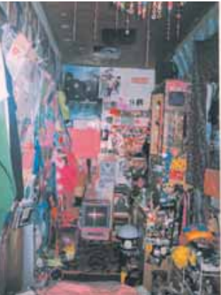
あちゃんのおへや♥きたなーいせまーい。

あちは、足がくさい ことが、はれぬい。 あと、足のうかきいろ たの♡みずんくけさ?