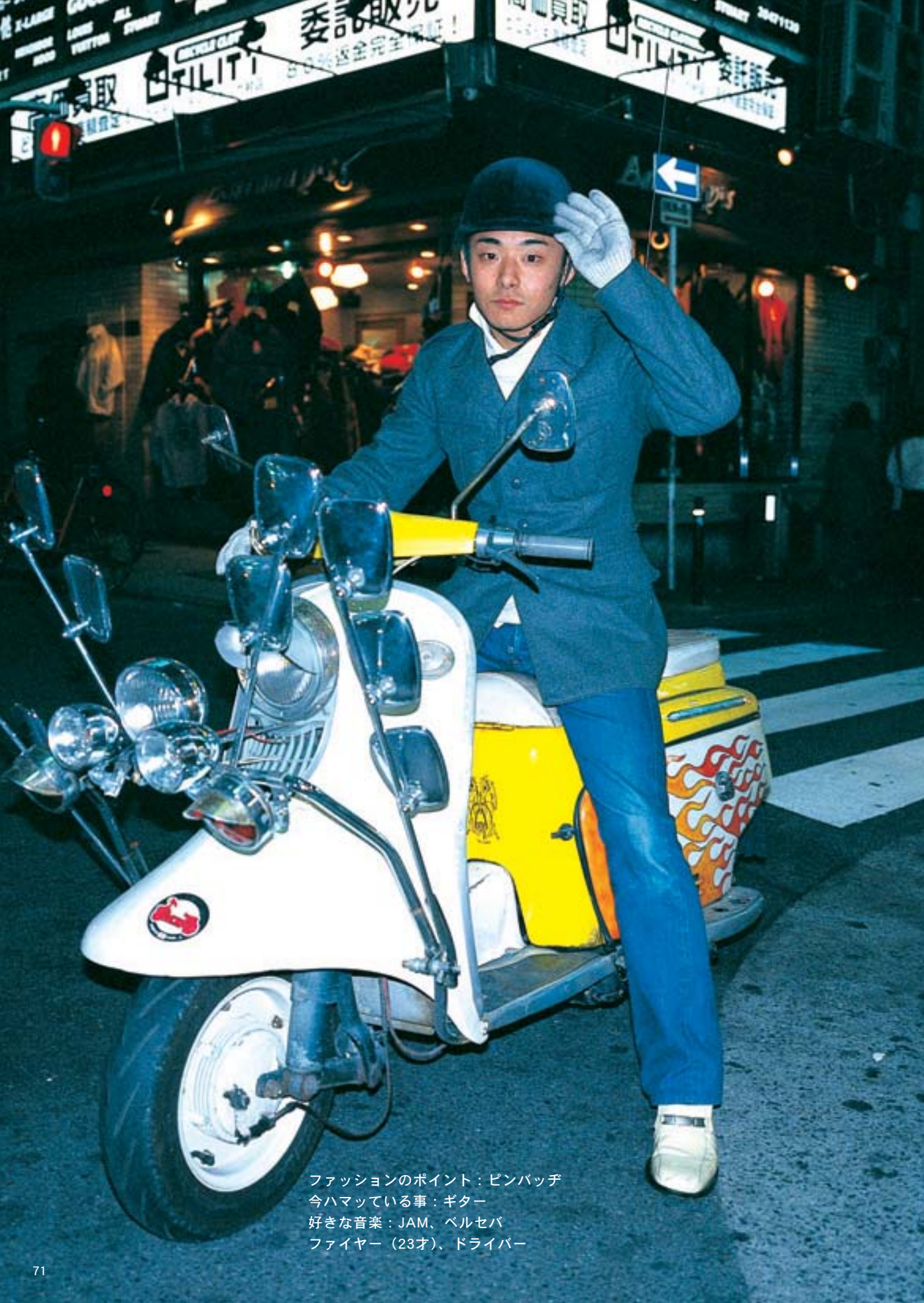
ファッションのポイント：ピンバッチ 今ハマっている事：ギター 好きな音楽：JAM、ベルセバ ファイヤー（23才）、ドライバー