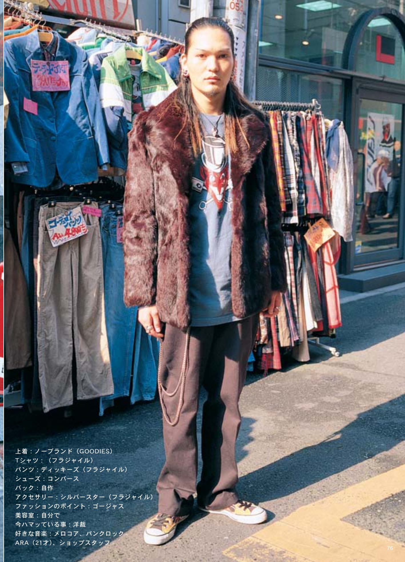
上着：ノーブランド (GOODIES) Tシャツ：(フラジャイル) パンツ：ディッキーズ (フラジャイル) シューズ：コンバース バック：自作 アクセサリー：シルバースター (フラジャイル) ファッションのポイント：ゴージャス 美容室：自分で 今ハマっている事：洋裁 好きな音楽：メロコア、パンクロック ARA (21才)、ショップスタッフ