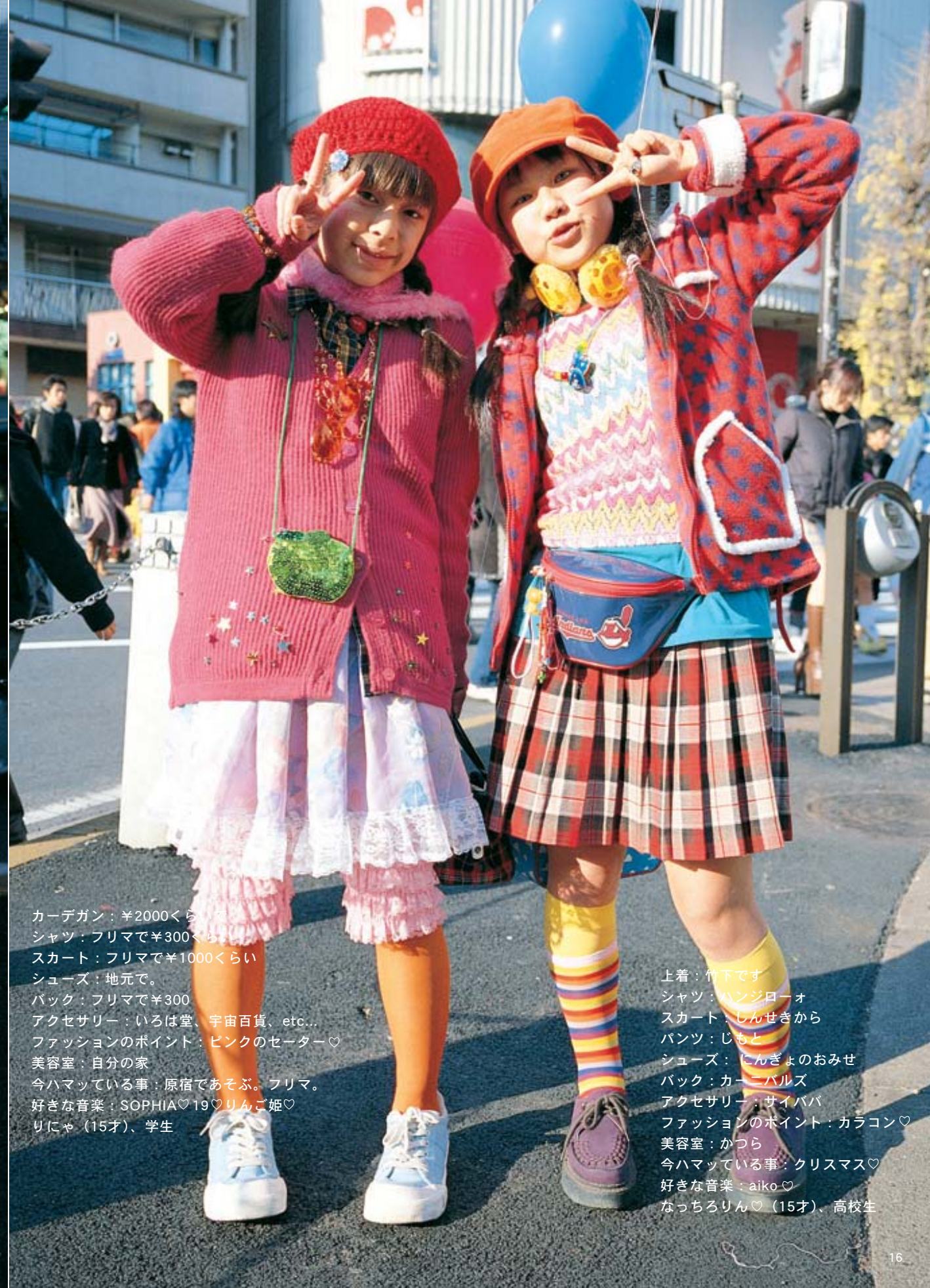
カーデガン：¥2000くらい シャツ：フリマで¥300くらい スカート：フリマで¥1000くらい シューズ：地元で。 バック：フリマで¥300 アクセサリ：いろは堂、宇宙百貨、etc... ファッションのポイント：ピンクのセーター♡ 美容室：自分の家 今ハマっている事：原宿であそぶ。フリマ。 好きな音楽：SOPHIA♡19♡りんご姫♡ りじゃ（15才）、学生