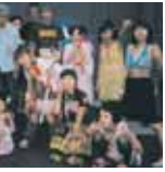
8月のCASCADEライブ。ツナさん かっこいいですね。またいま しょう。

今、だいすきな人がいます。 同じクラスで、同じ学年です。 あなは「コリ」です。 あちに、気がついて♡ すきすきすきすき♡