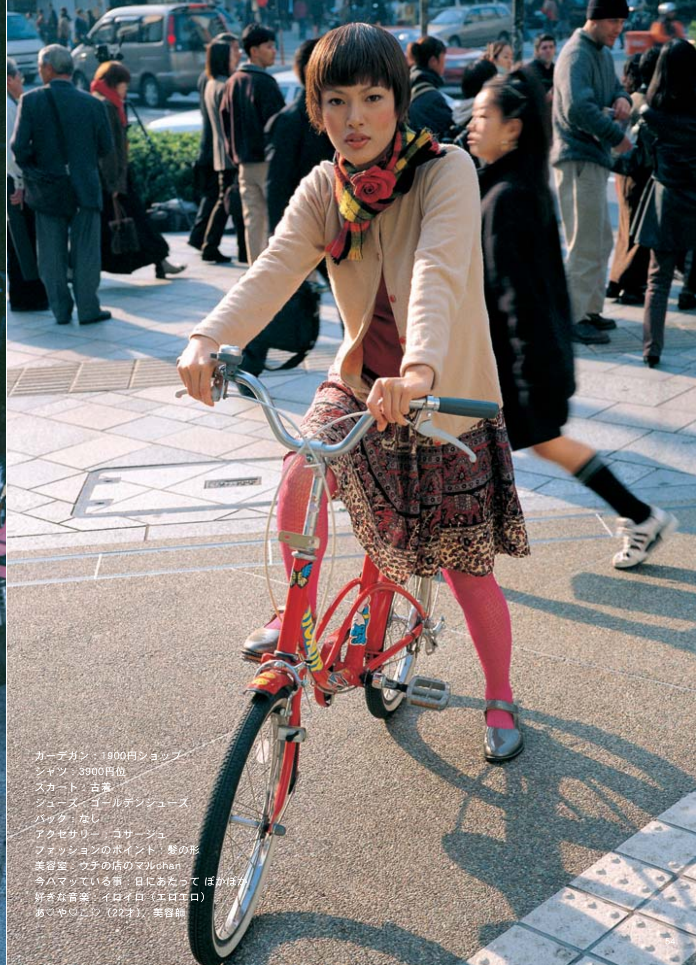
ガーデガン：1900円ショップ シャツ：3900円位 スカート：古着 シューズ：ゴールデンシューズ バック：なし アクセサリー：ゴサージュ ファッションのポイント：髪 美容室：ウチの店のマルchan 今ハマっている事：日にあたって ぽかぽか 好きな音楽：イロイロ (エロエロ) あ♡や♡こ♡ (22才)、美容師