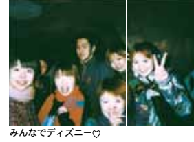
みんなでディズニー

最近の一日 (休日) 起きる→着飾る→原宿→友達と遊ぶ→買物→帰って夕食→お風呂→課題→なすびにTEL→寝る