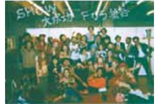
パンタンのファッションショー