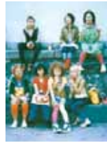
みんなでハイポーズ