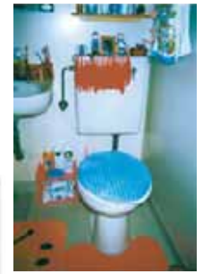
キノコ・トイレです