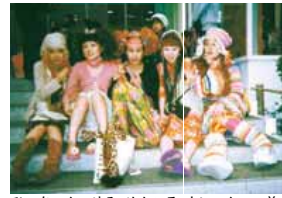
ひーちゃん Wゆみ めんころ まいつん GAP前で