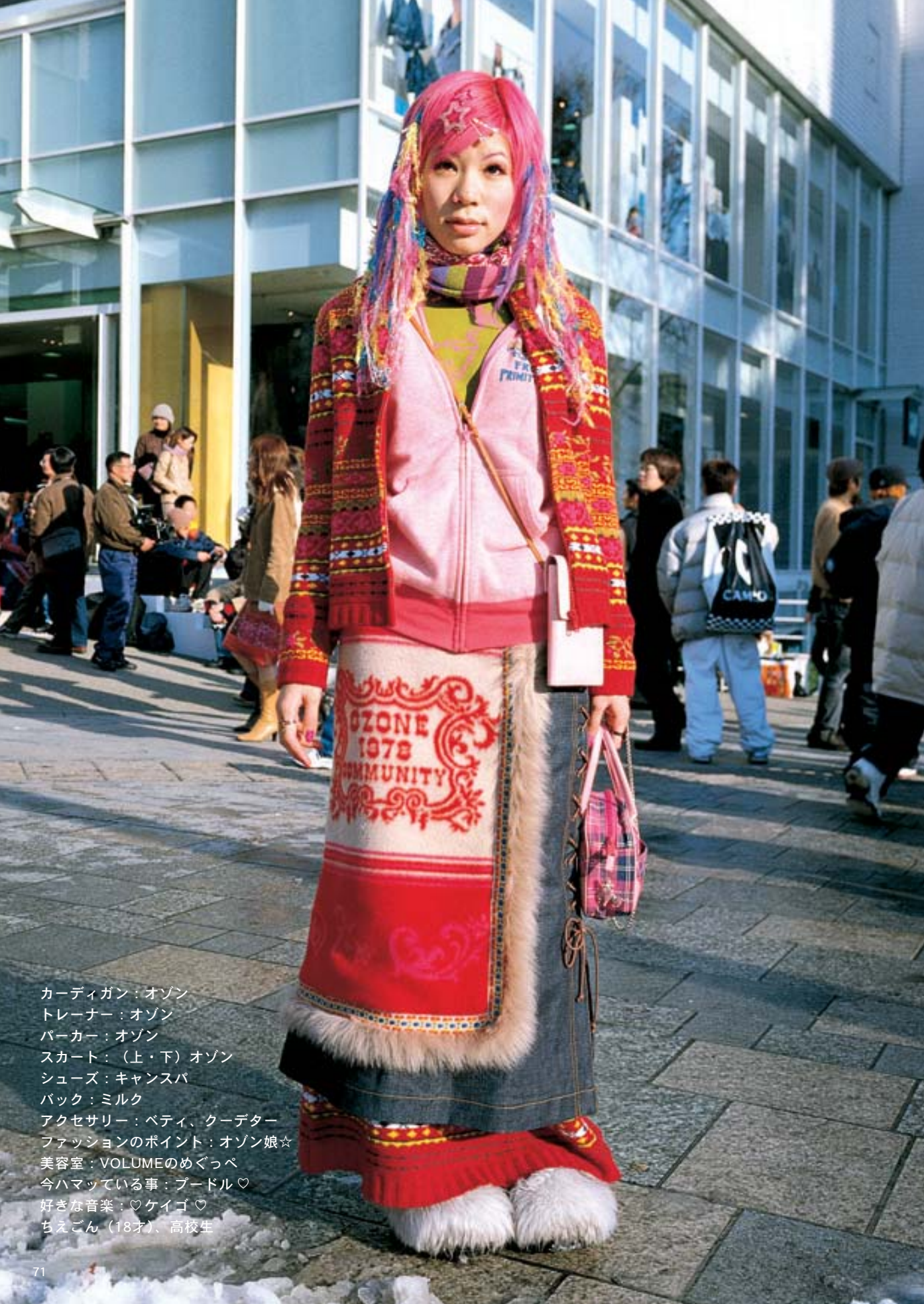
カーディガン：オゾン トレーナー：オゾン パーカー：オゾン スカート：（上・下）オゾン シューズ：キャンSPA バック：ミルク アクセサリー：ベティ、クーデター ファッションのポイント：オゾン娘☆ 美容室：VOLUMEのめぐっぺ 今ハマっている事：ブードル♡ 好きな音楽：♡ケイゴ♡ ちえごん（18才）、高校生