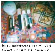
毎日にかかせないもの! パーバー (ボーチ) はおじさんにももらった。