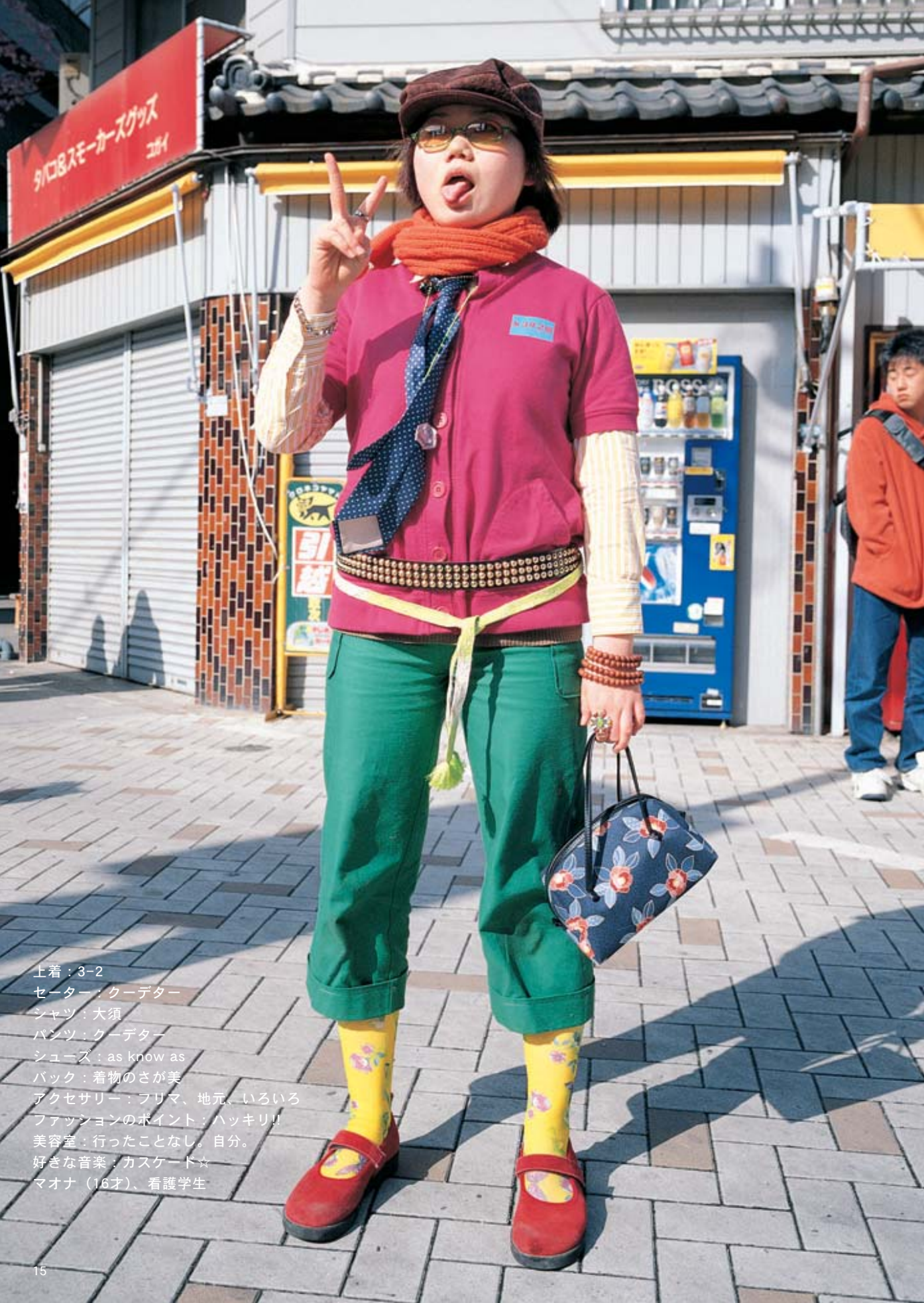
上着：3-2 セーター：クーデター シャツ：大須 パンツ：クーデター シューズ：as know as バック：着物のさが美 アクセサリー：フリマ、地元、いろいろ ファッションのポイント：ハッキリ!! 美容室：行ったことなし。自分。 好きな音楽：カスケード☆ マオナ (16才)、看護学生