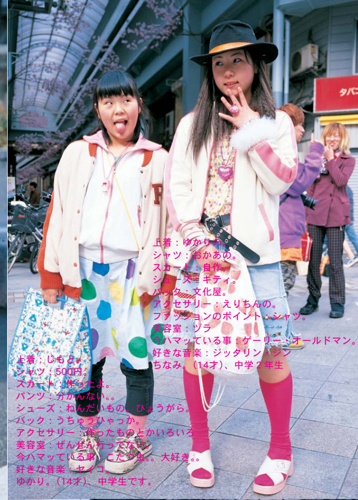
上着：ゆかりん シャツ：おかあひ。 スカーフ：自作 シューズ：キティ。 バック：文化屋。 アクセサリー：えりちんの。 ファッションのポイント：シャツ。 美容室：ツラ 今ハマっている事：ゲーリー・オールドマン。 好きな音楽：ジッタリン・ジッタ ちなみ（14才）、中学7年生