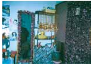
扉と鏡を100円Shop で買ったモールでかざりつけ