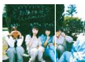
工業高校出身です!