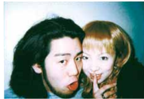
なすびとめんころ♡