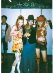
麻美・ユア・メンコロ ショーのあと