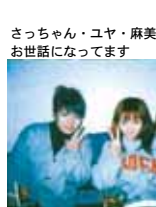
さっちゃん・ユア・麻美のお世話になってます