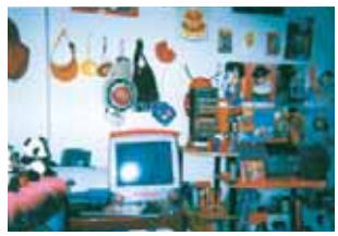
MY ROOM ☆

一番楽しかったこと 思い出はいい! 楽しい! おなかいい! お茶をいいたい! あたしはいいで、...。とりあえず、過去の思い出を、ありがとう。