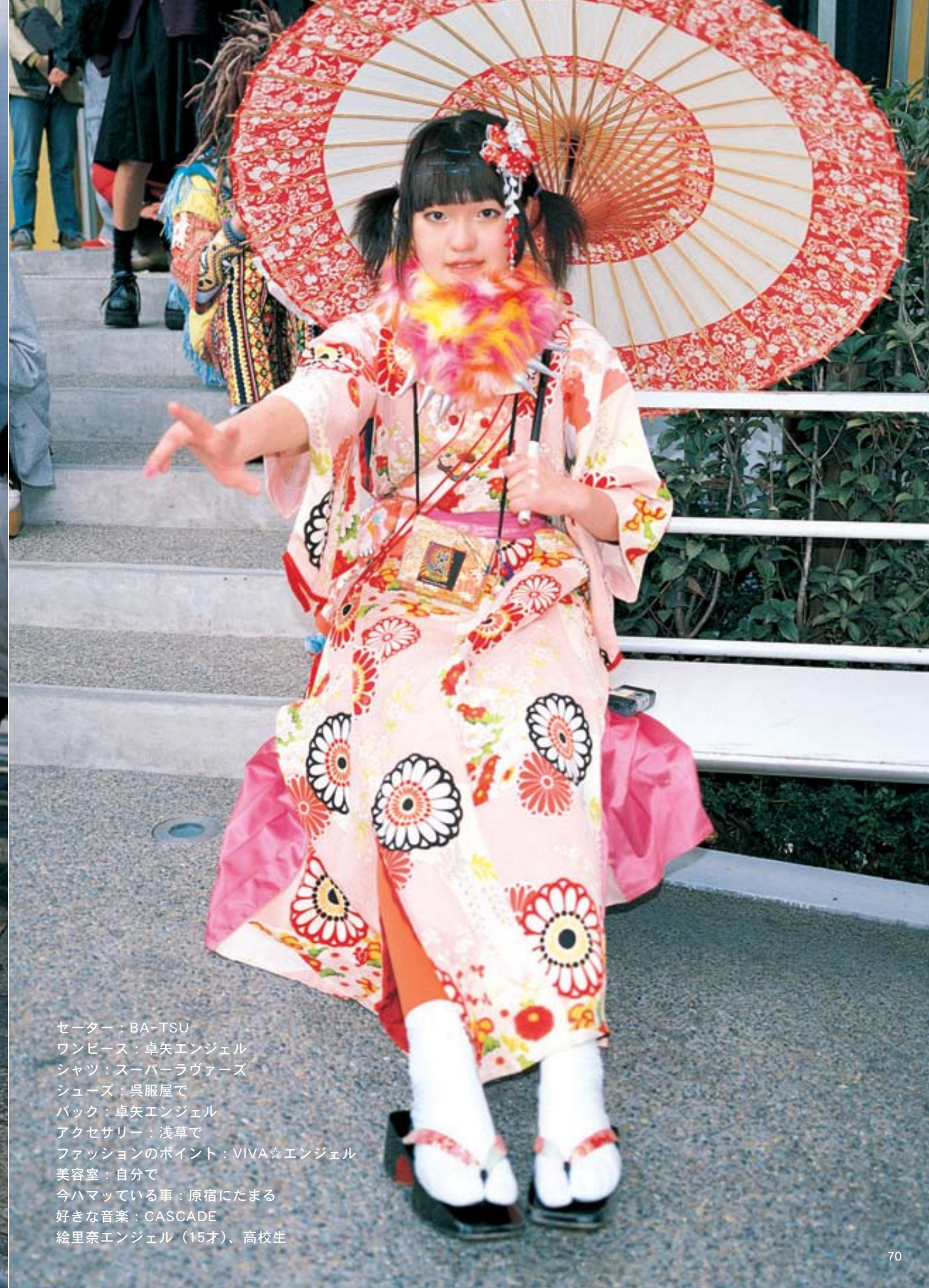
セーター：BA-TSU ワンピース：卓矢エンジェル シャツ：スーパーヴァーズ シューズ：呉服屋で バック：卓矢エンジェル アクセサリー：浅草で ファッションのポイント：VIVA☆エンジェル 美容室：自分で 今ハマっている事：原宿にたまる 好きな音楽：CASCADE 絵里奈エンジェル（15才）、高校生