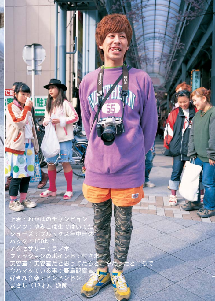
上着：わかばのチャンピオン パンツ：ゆみこは生ではいた シューズ：ブルックス年中無休 バック：100均？ アクセサリー：ラブボ ファッションのポイント：村さ来 美容室：美容室だと思ってたらこやだったところで 今ハマっている事：野鳥観察 好きな音楽：ドンドンドン まきし（18才）、漁師