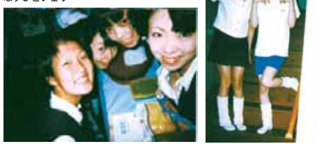
高校時代!! まりこ・あやちゃん・めくみちゃん・めんころ