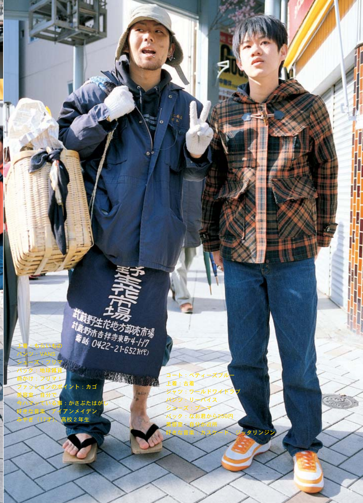
上着：もらいもの パンツ：VANS シューズ：フリマ バック：地球雑貨 前かけ：フリマ! ファッションのポイント：カゴ 美容室：自分で 今ハマっている事：かさぶたはがし 好きな音楽：ダイヤモンド みやぎ (17才)、高校2年生