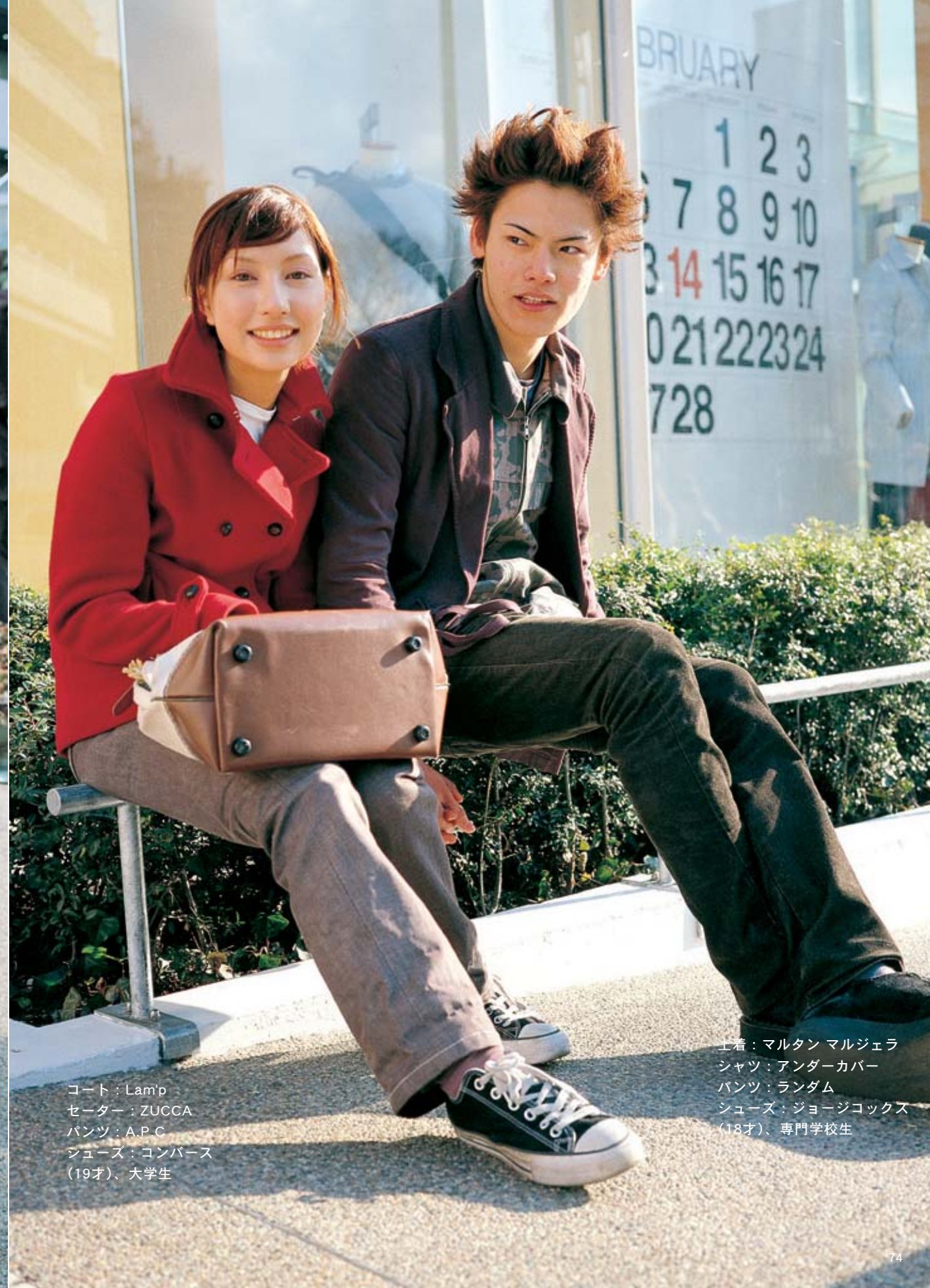
コート：Lam'p セーター：ZUCCA パンツ：A.P.C シューズ：コンバース (19才)、大学生