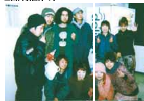
クラスのゆかいな仲間たち