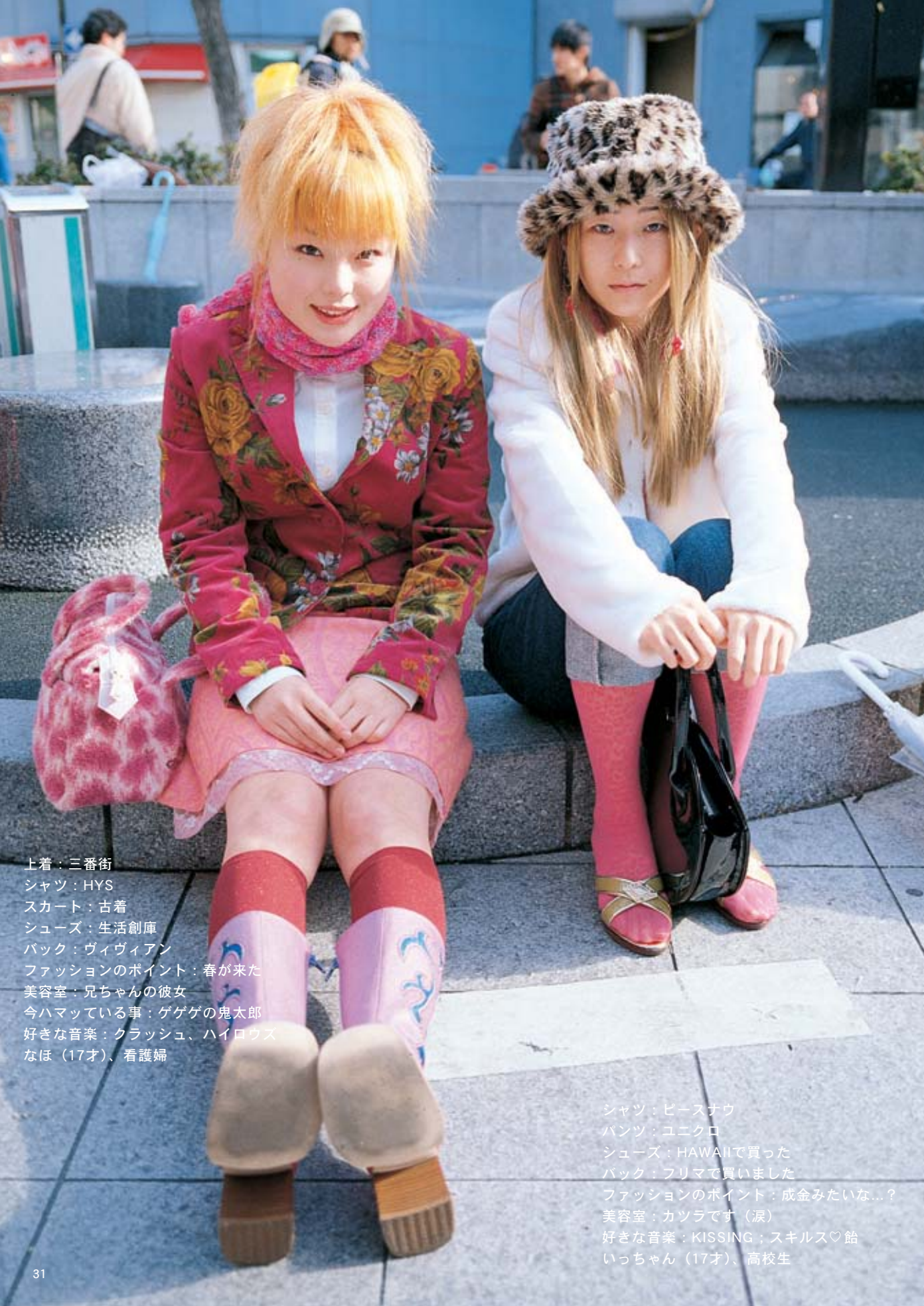
上着：三番街 シャツ：HYS スカート：古着 シューズ：生活創庫 バック：ヴィヴィアン ファッションのポイント：春が来た 美容室：兄ちゃんの彼女 今ハマっている事：ゲゲゲの鬼太郎 好きな音楽：クラッシュ、ハイロウス なほ（17才）、看護婦