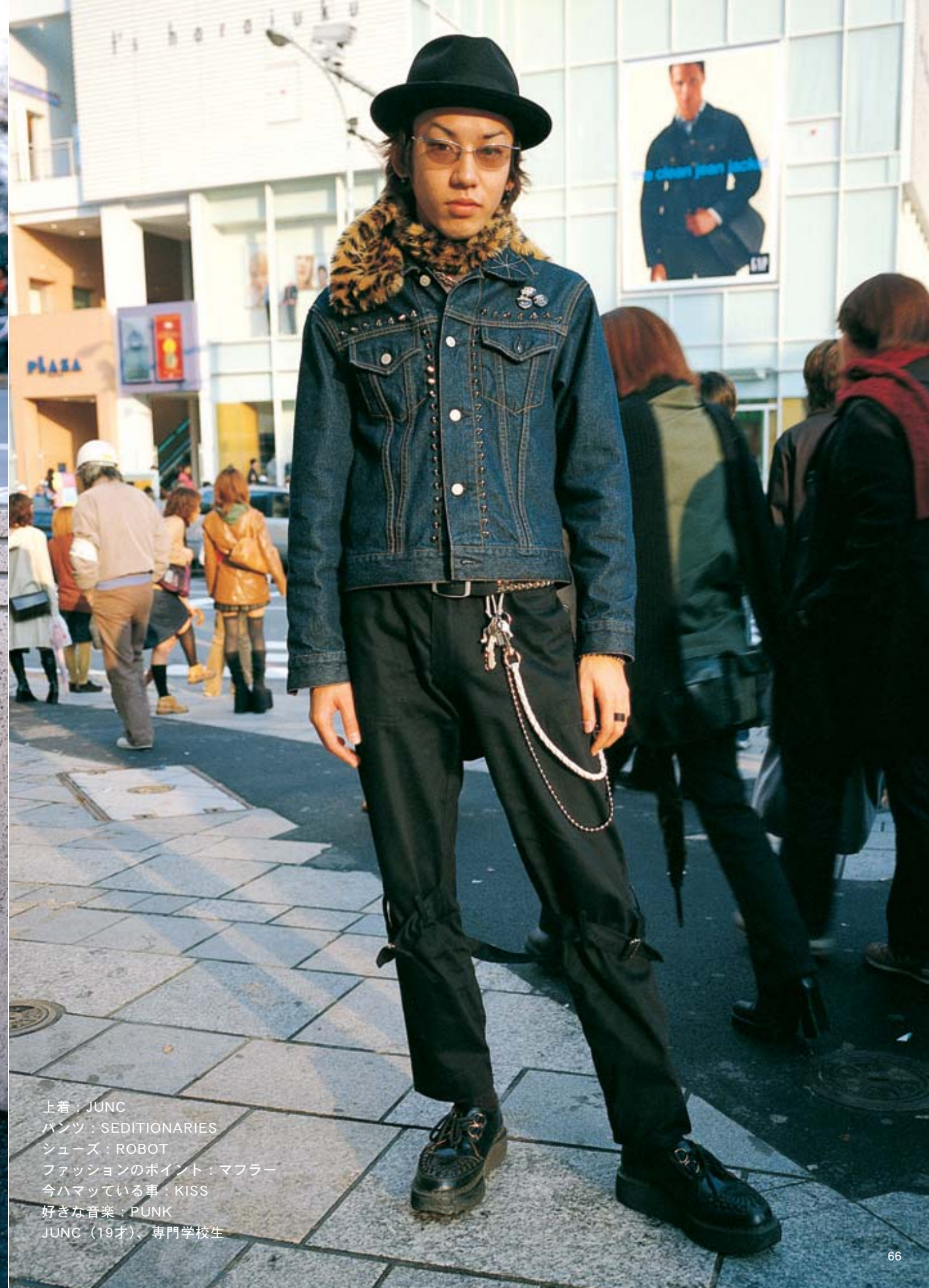
上着：JUNC パンツ：SEDITIONARIES シューズ：ROBOT ファッションのポイント：マフラー 今ハマっている事：KISS 好きな音楽：PUNK JUNC（19才）、専門学校生